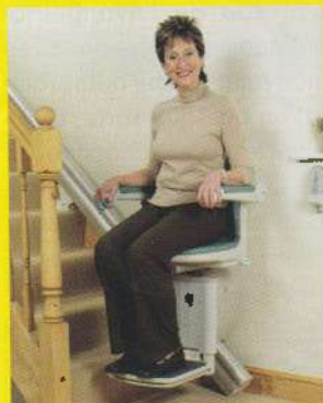
ESCALIER COURBE ET ESCALIER DROIT