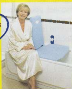
ELEVATEUR DE BAINS