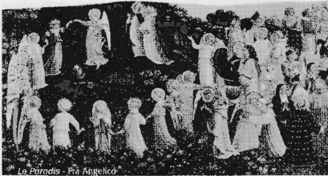
Le Paradis - Fra Angelico

C'est ce qu'évoque le magnifique tableau de