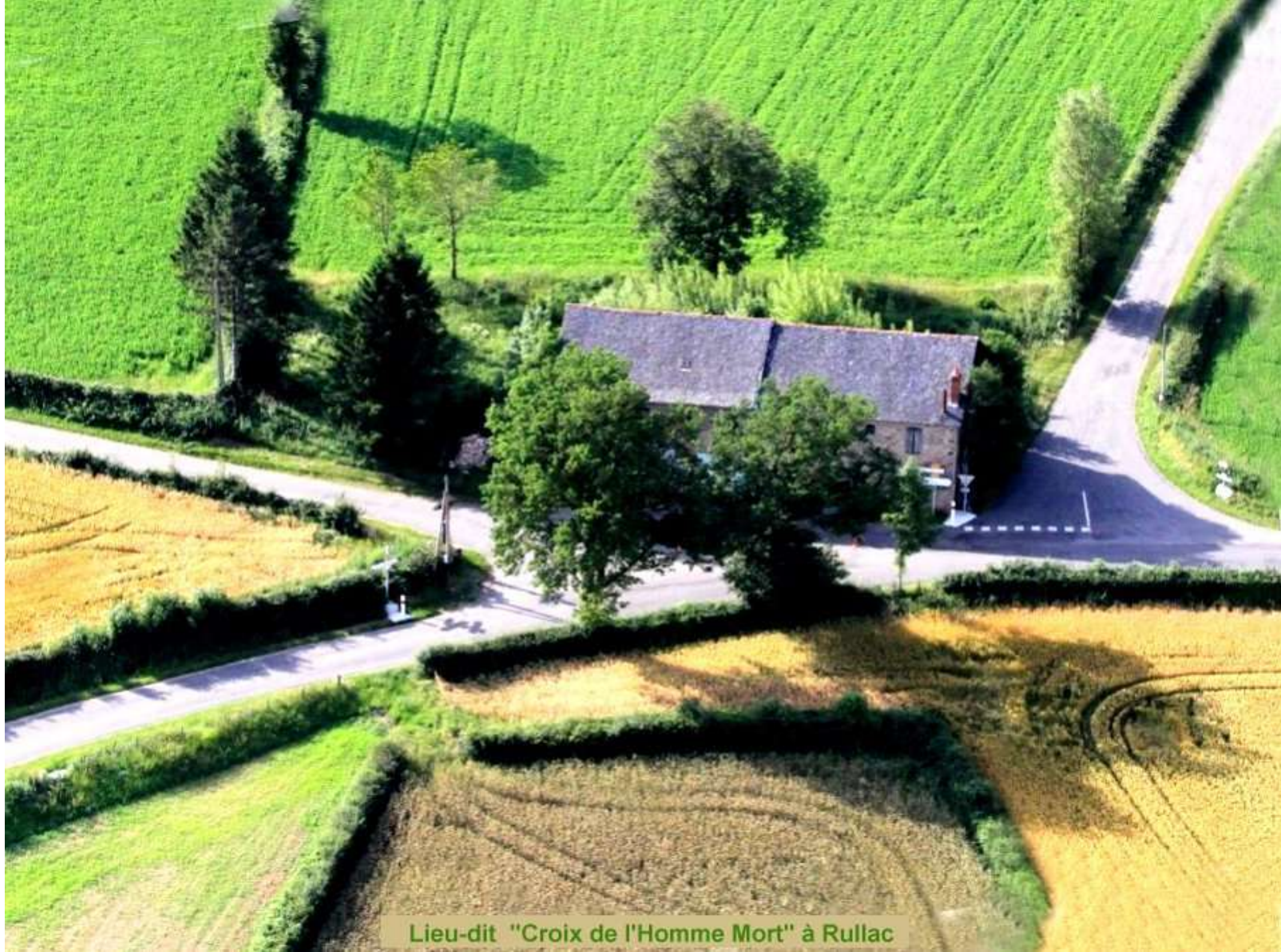
Lieu-dit "Croix de l'Homme Mort" à Rullac