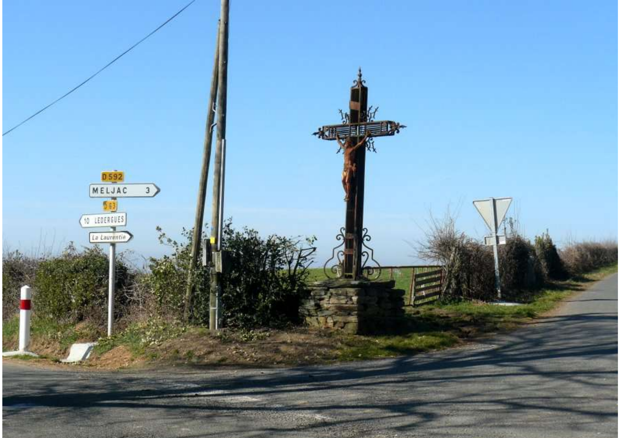
2012 => après déplacement des panneaux indicateurs