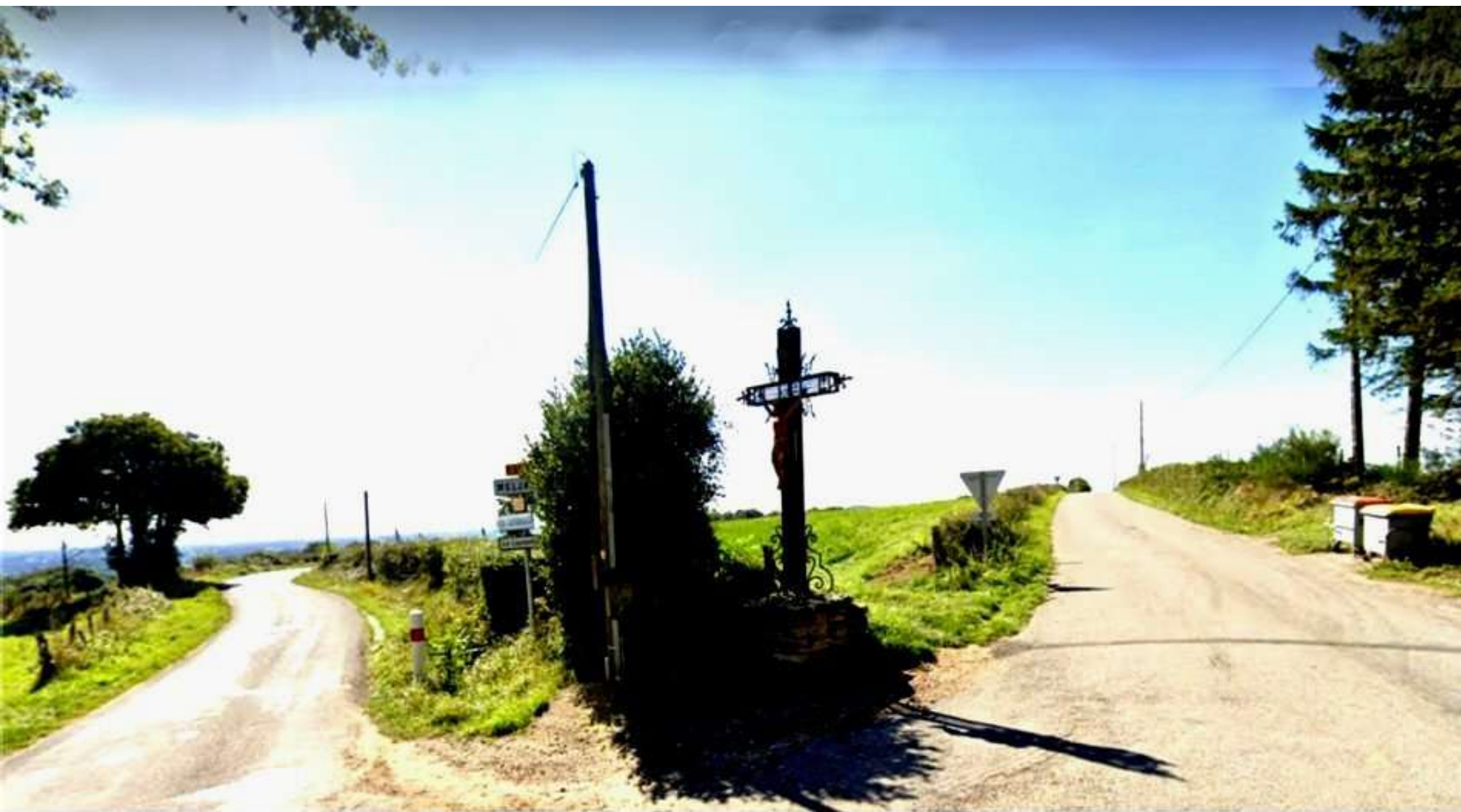
au carrefour de la D592 et de la D63, se dresse la "Croix de l'Homme Mort"