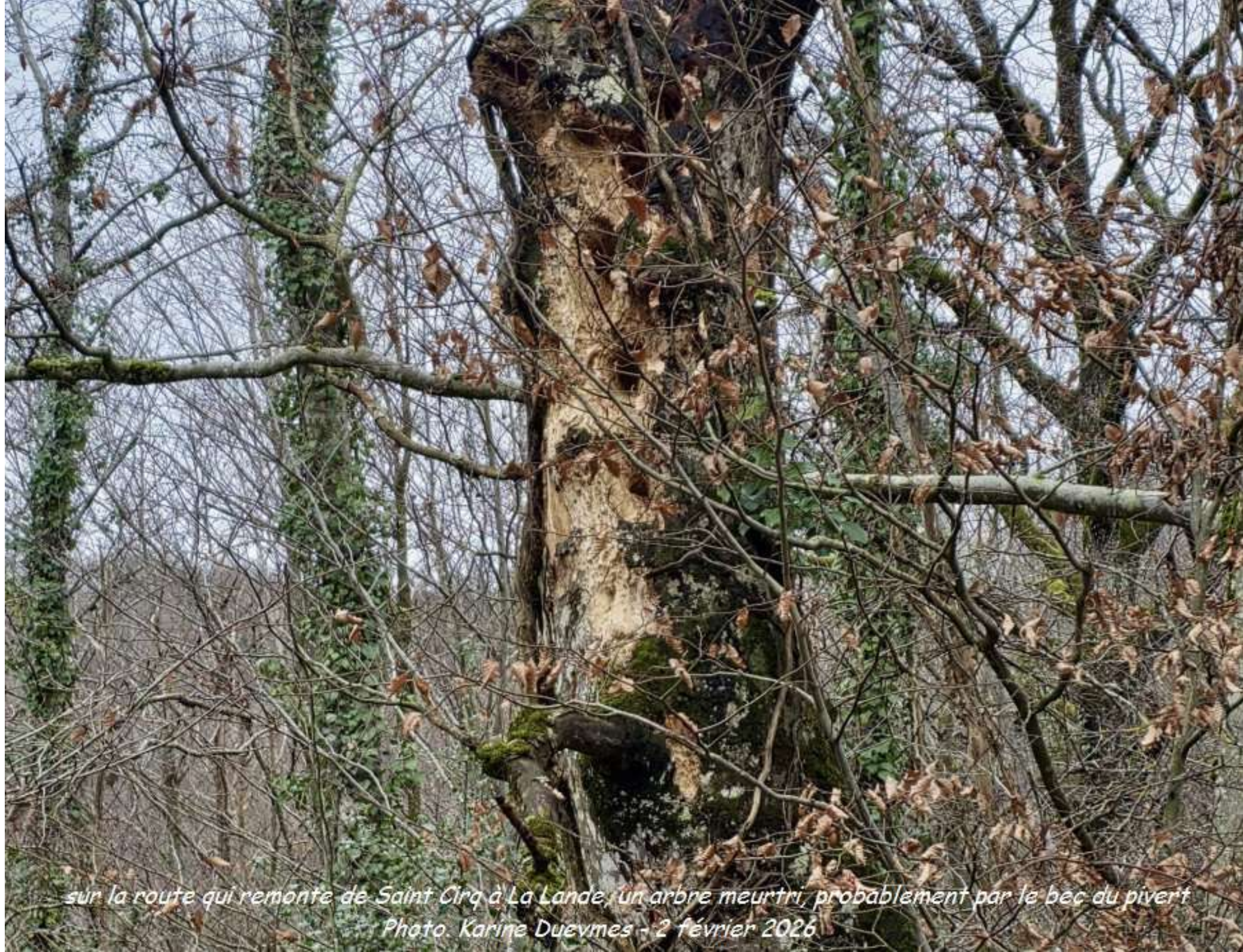
sur la route qui remonte de Saint Cirq à La Lande, un arbre meurtri, probablement par le bec du pivert Photo. Karine Duevmes - 2 février 2026