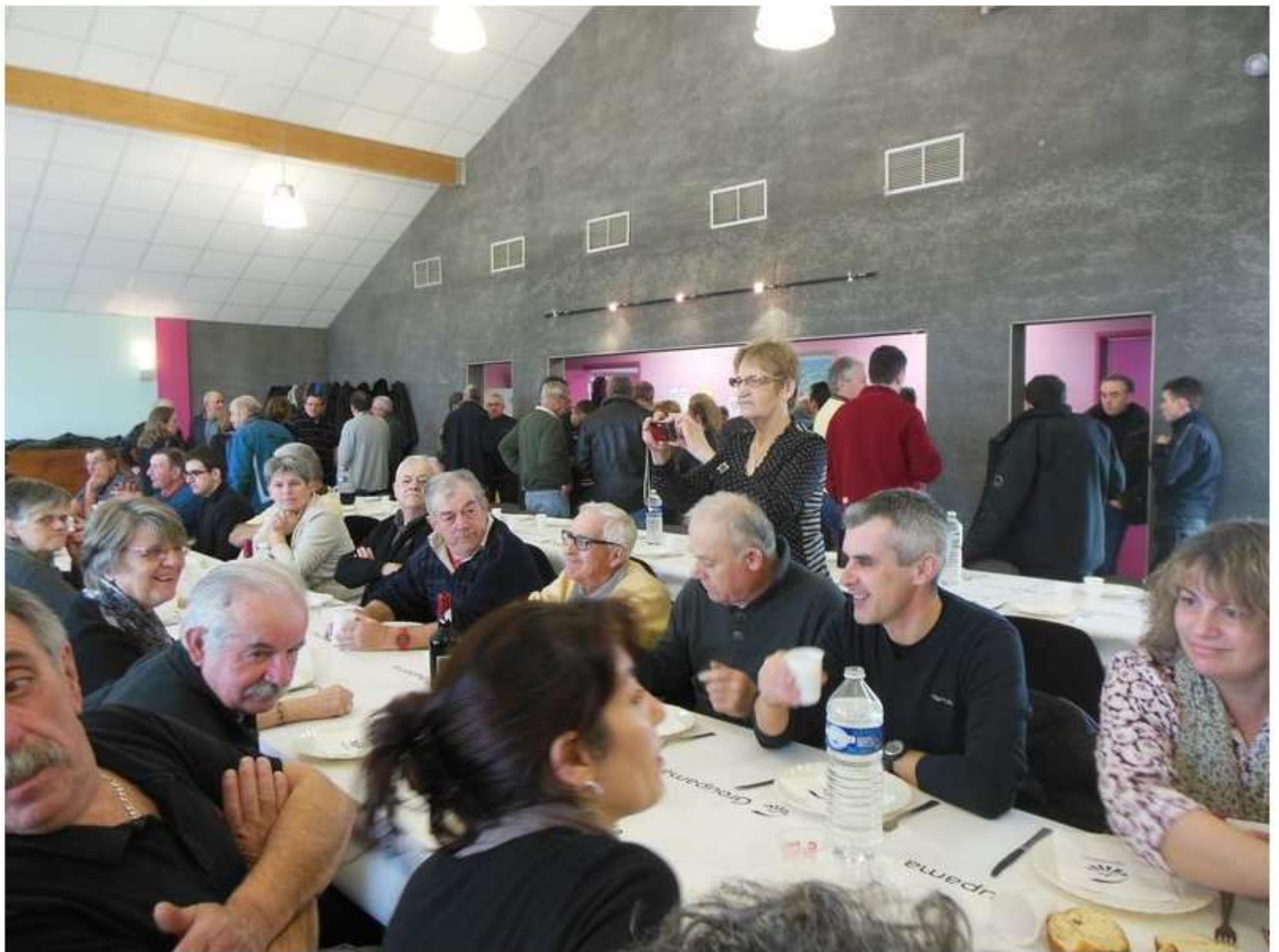
9 février 2014 - Le "petit-déjeuner de la Saint-Blaise"