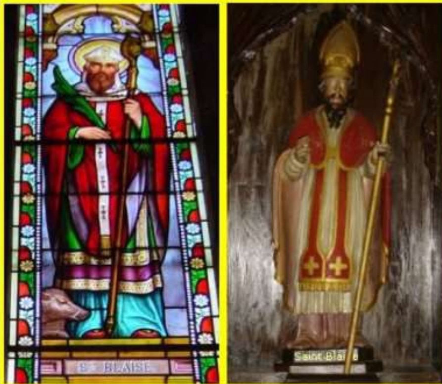
vitrail et statue en bois - église Saint-Blaise de Meljac (Aveyron)