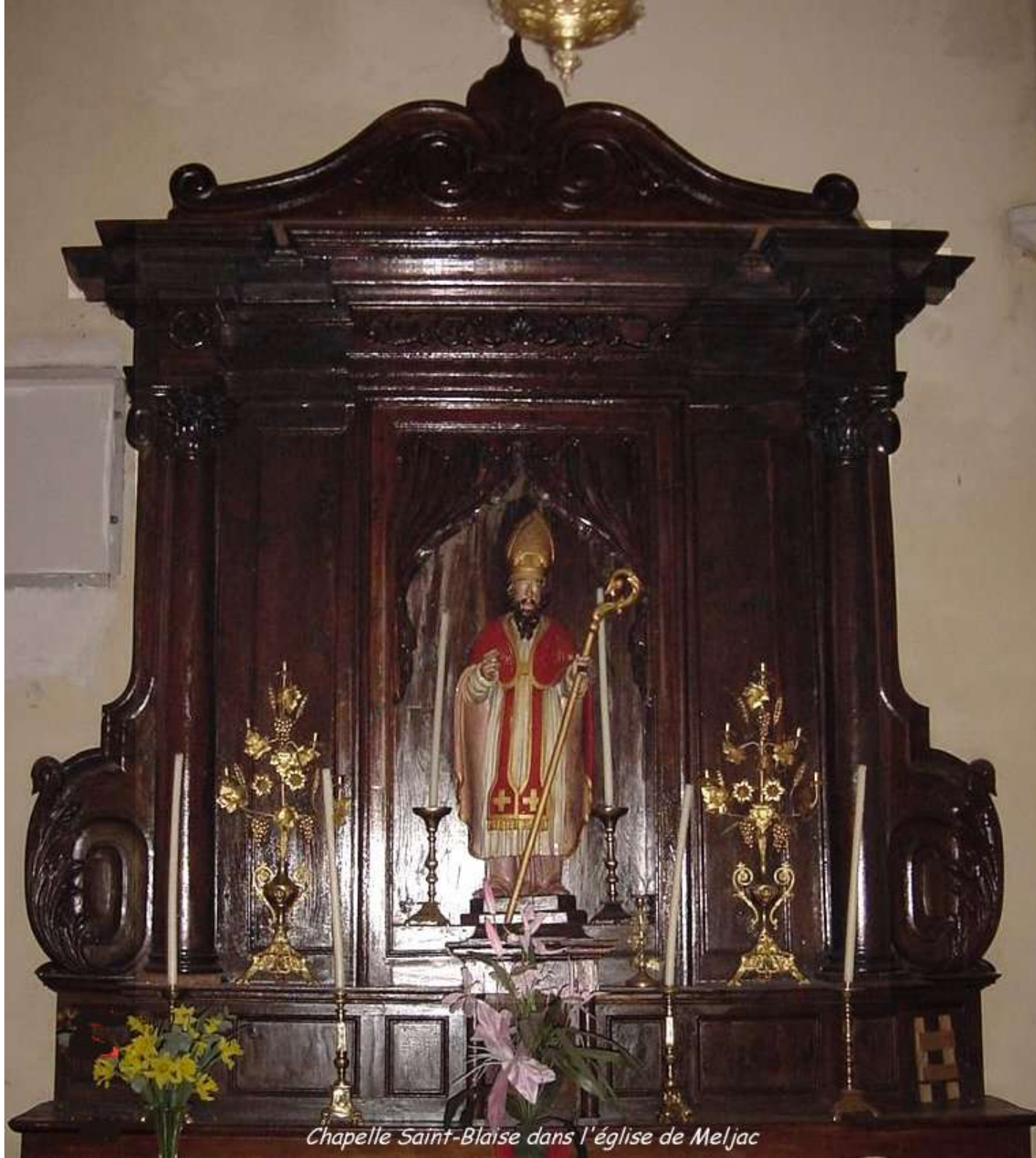
Chapelle Saint-Blaise dans l'église de Meljac