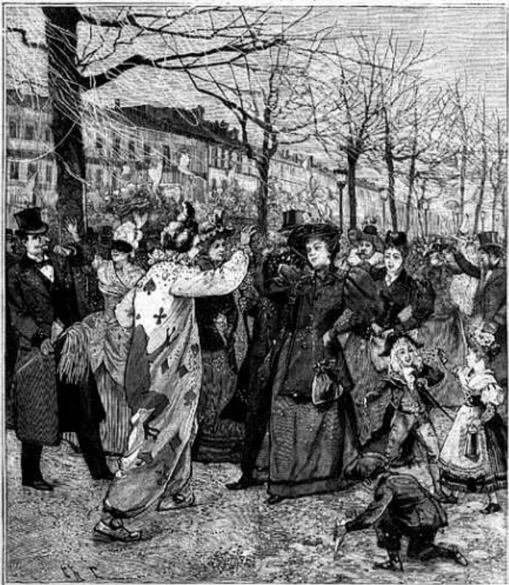
LA BATAILLE DES « CONFETTI » SUR LES BOULEVARDS

(Voir à l'intérieur de ce Numéro une gravure de double page représentant « le Cortège du Bœuf-Gras »)