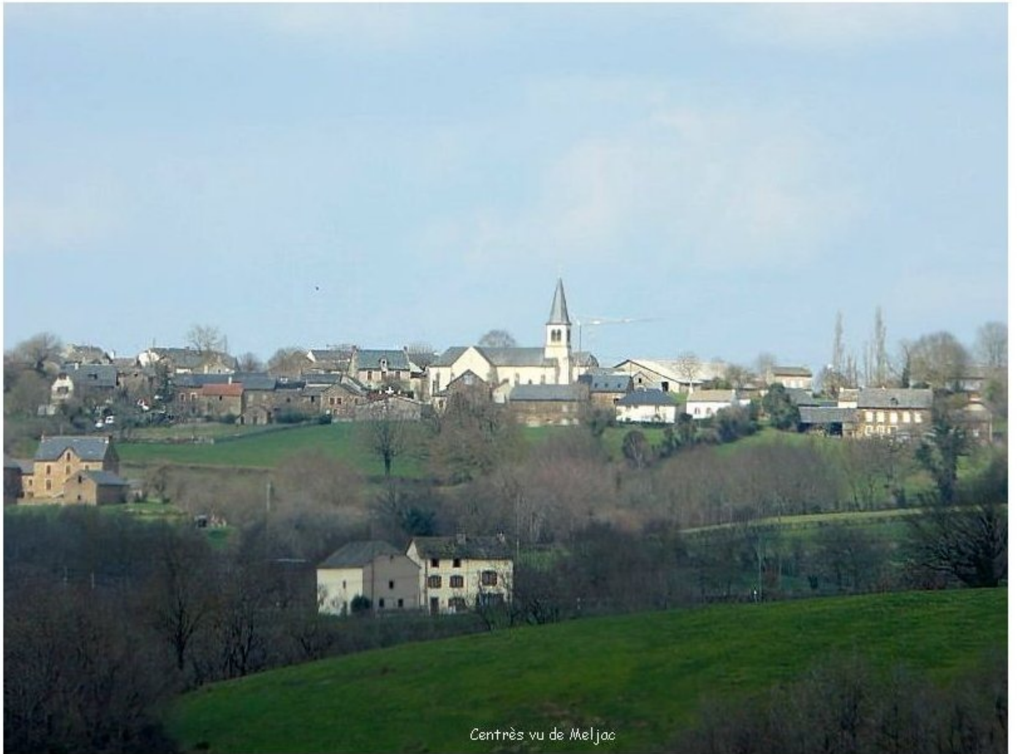
Centres vu de Meljac