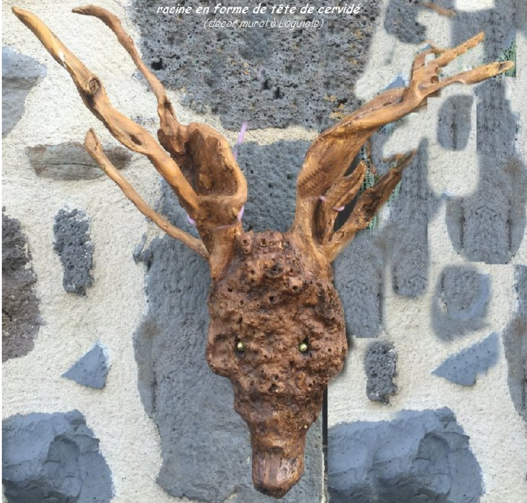
racine en forme de tête de cervidé (décor mural à Laquiote)