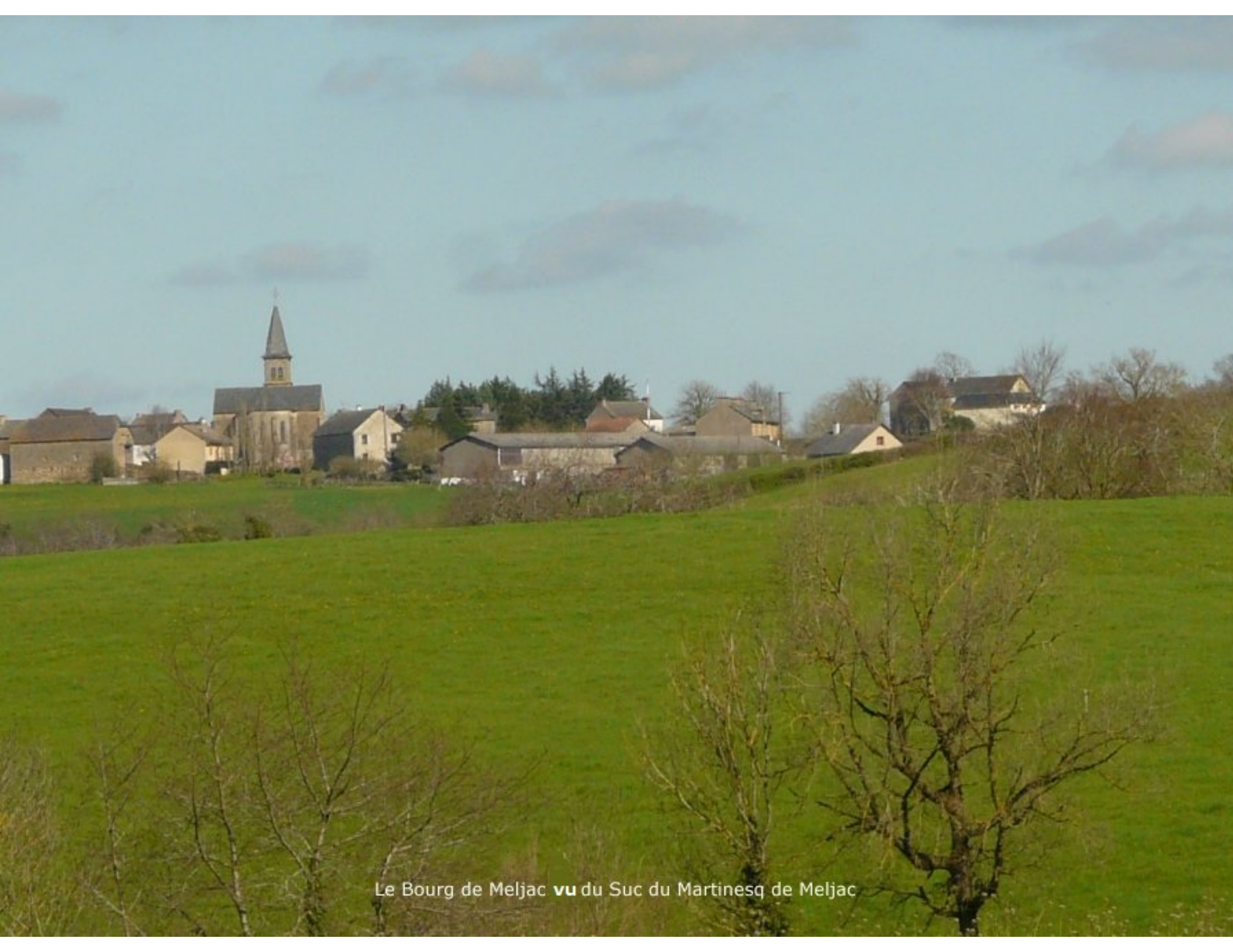
Le Bourg de Meljac vu du Suc du Martinesq de Meljac