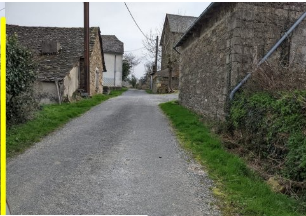
Promenade au Féraldesq - lundi 2 mars 2026