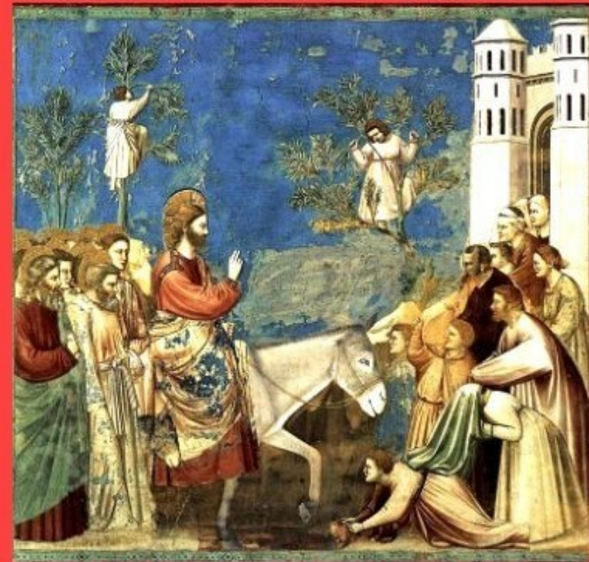
Giotto di Bondone - scène de la vie du Christ