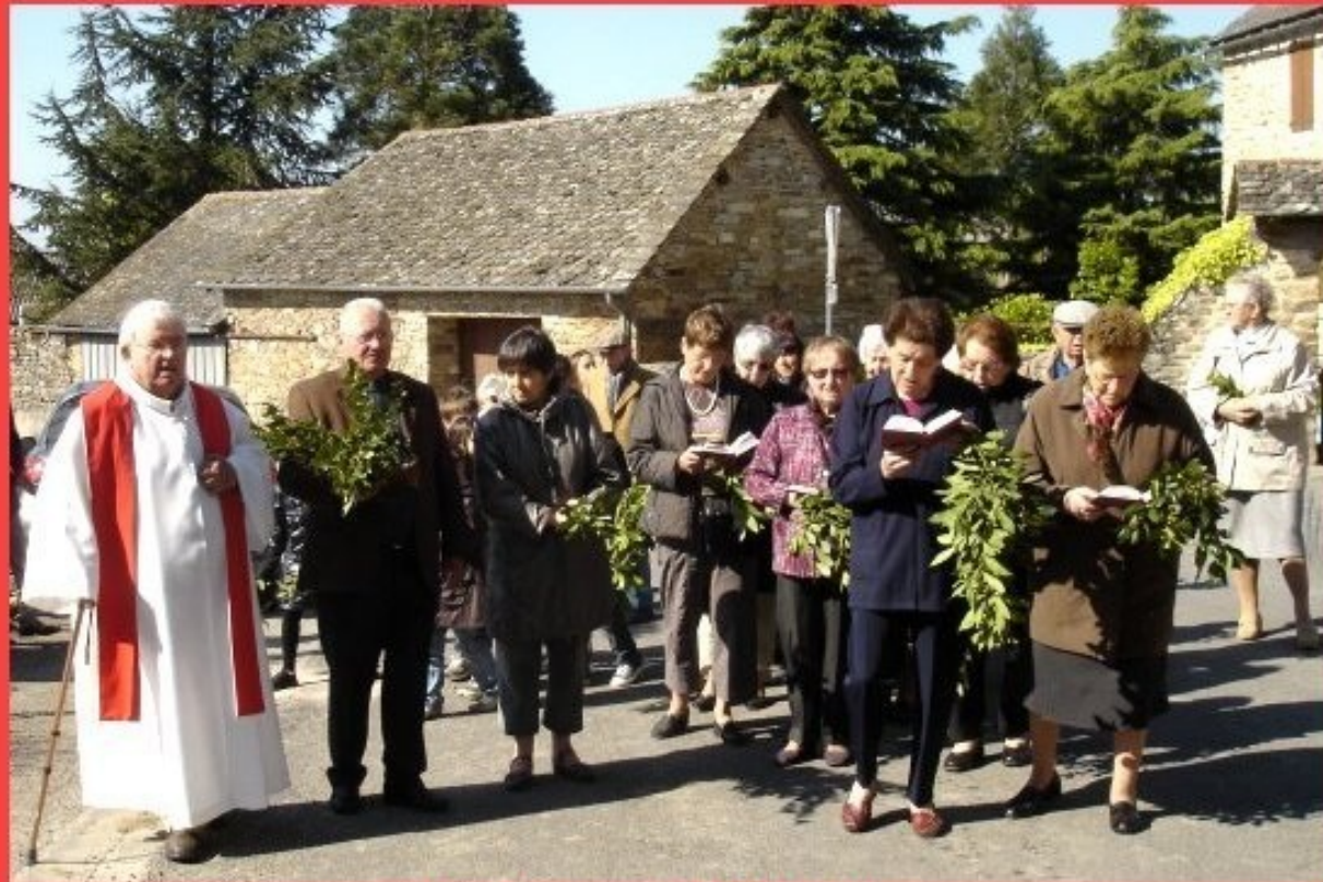
Les Rameaux 2011 à Meljac