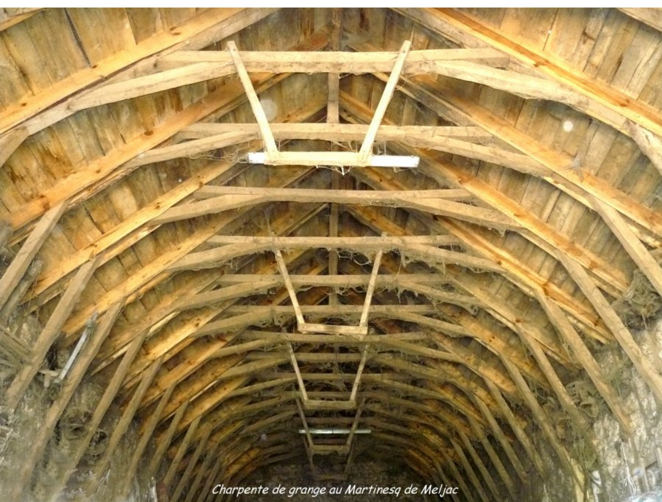
Charpente de grange au Martinesq de Meljac