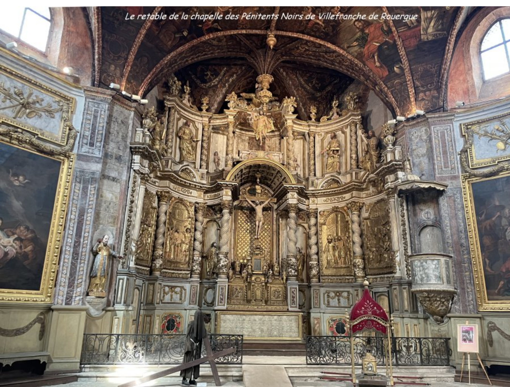
Le retable de la chapelle des Pénitents Noirs de Villefranche de Rouergue