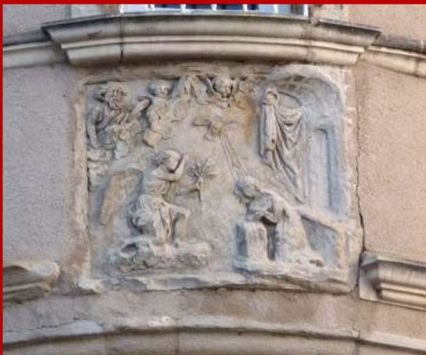
Maison Renaissance dite de l'Annonciation 2 place du Bourg à Rodez

Elle doit son nom de "Maison de l'Annonciation" à la présence d'un bas-relief sur la tourelle qui représente une scène de l'Annonciation.