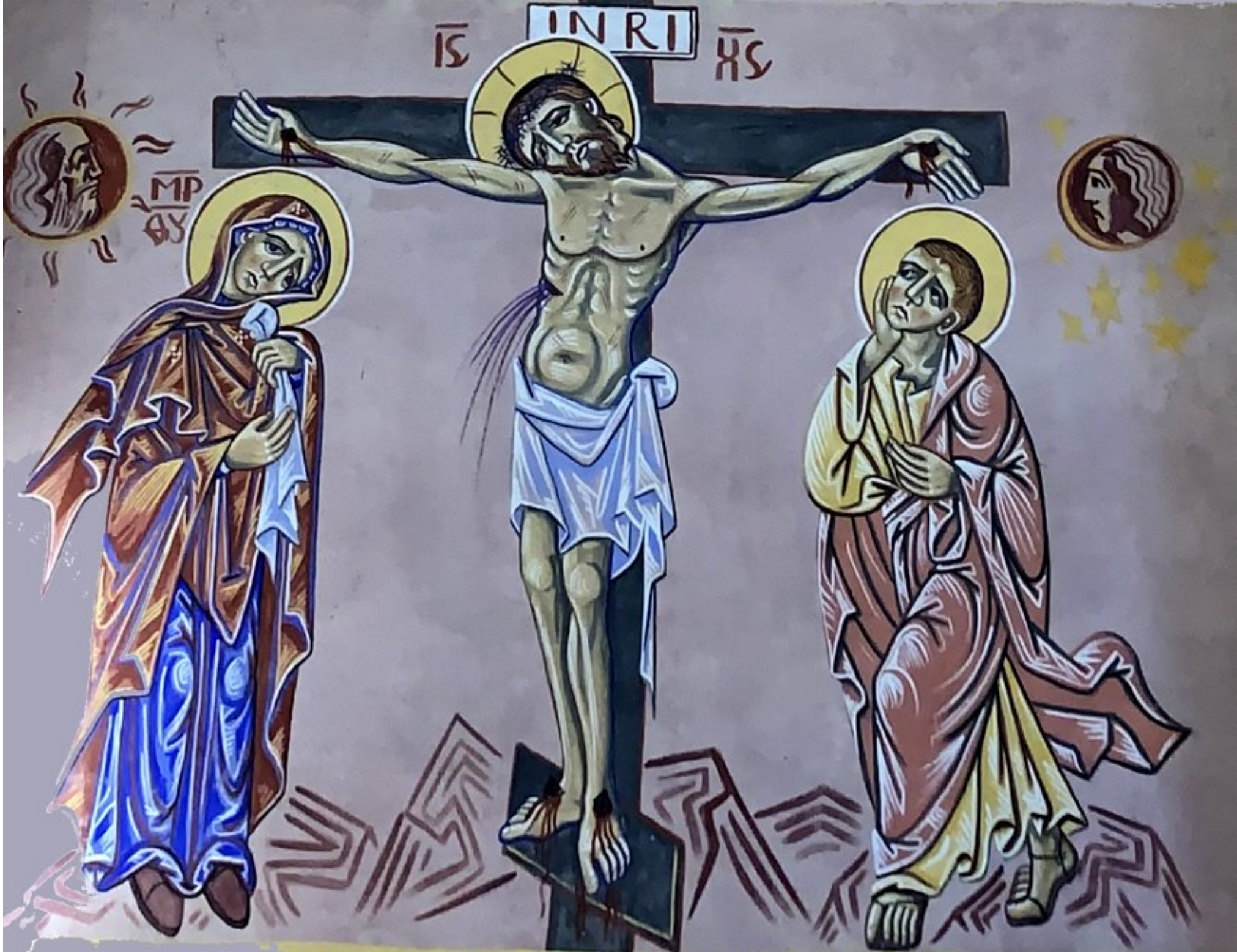
Mise en Croix - église d'Alban (Tarn) - fresque de Nicolas Greschny