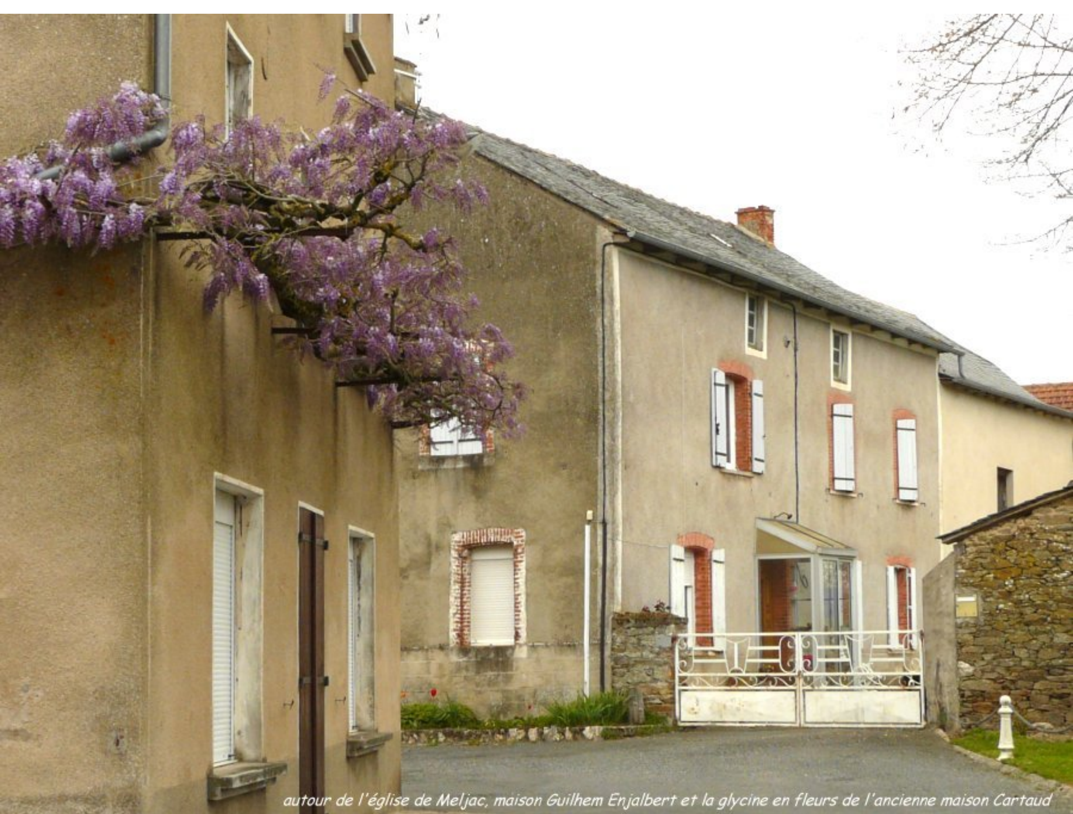
autour de l'église de Meljac, maison Guilhem Enjalbert et la glycine en fleurs de l'ancienne maison Cartaud