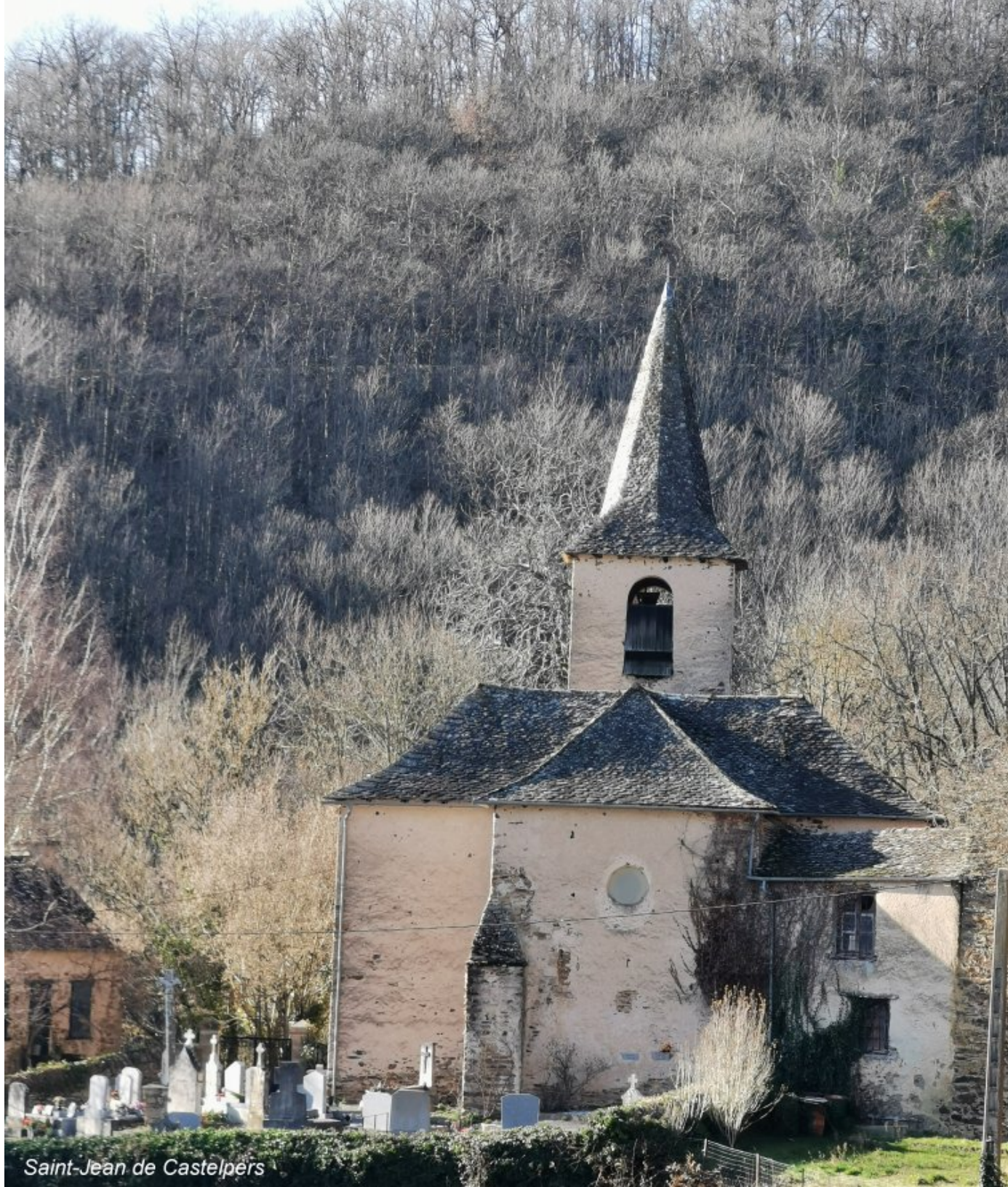
Saint-Jean de Castelpers