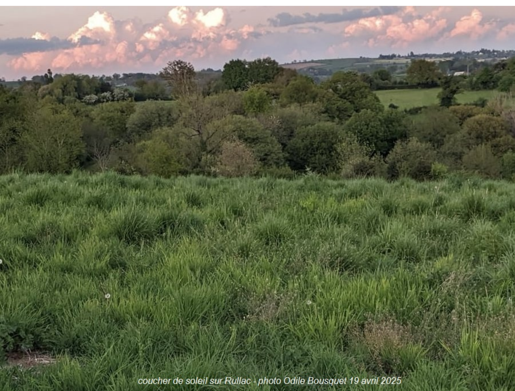
coucher de soleil sur Rullac - photo Odile Bousquet 19 avril 2025