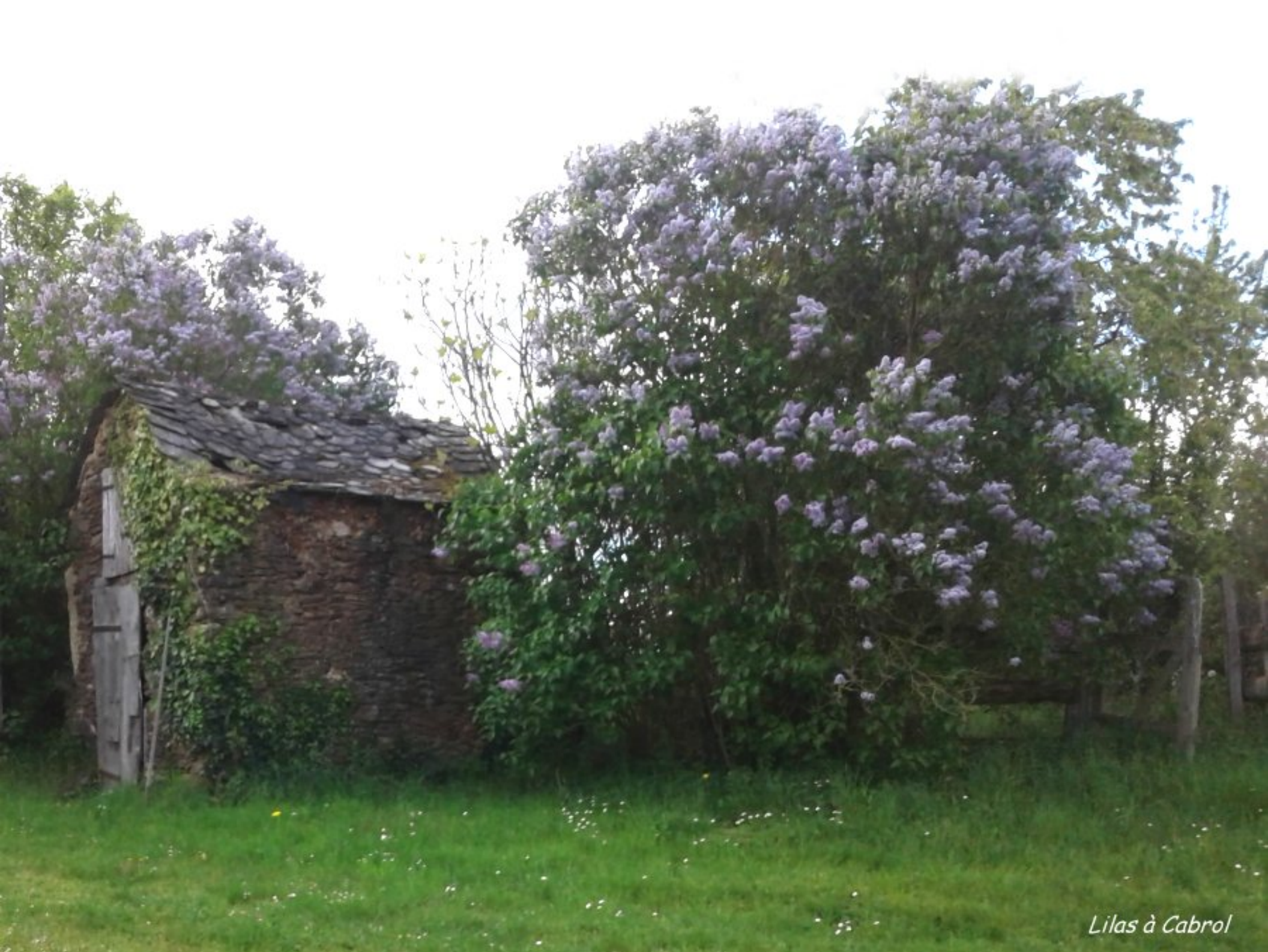
Lilas à Cabrol