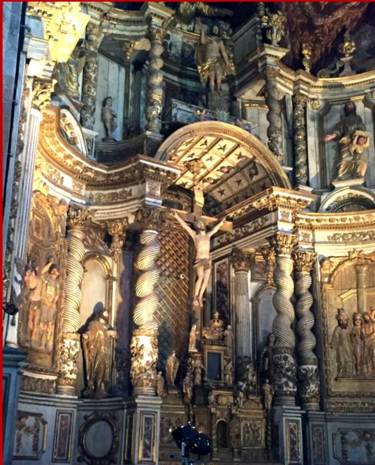
Chapelle des Pénitents Noirs à Villefranche de Rouergue - Scènes de la Passion du Christ