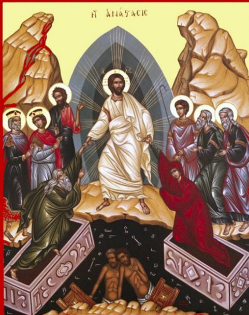
Résurrection du Christ - icone byzantine ci-dessus