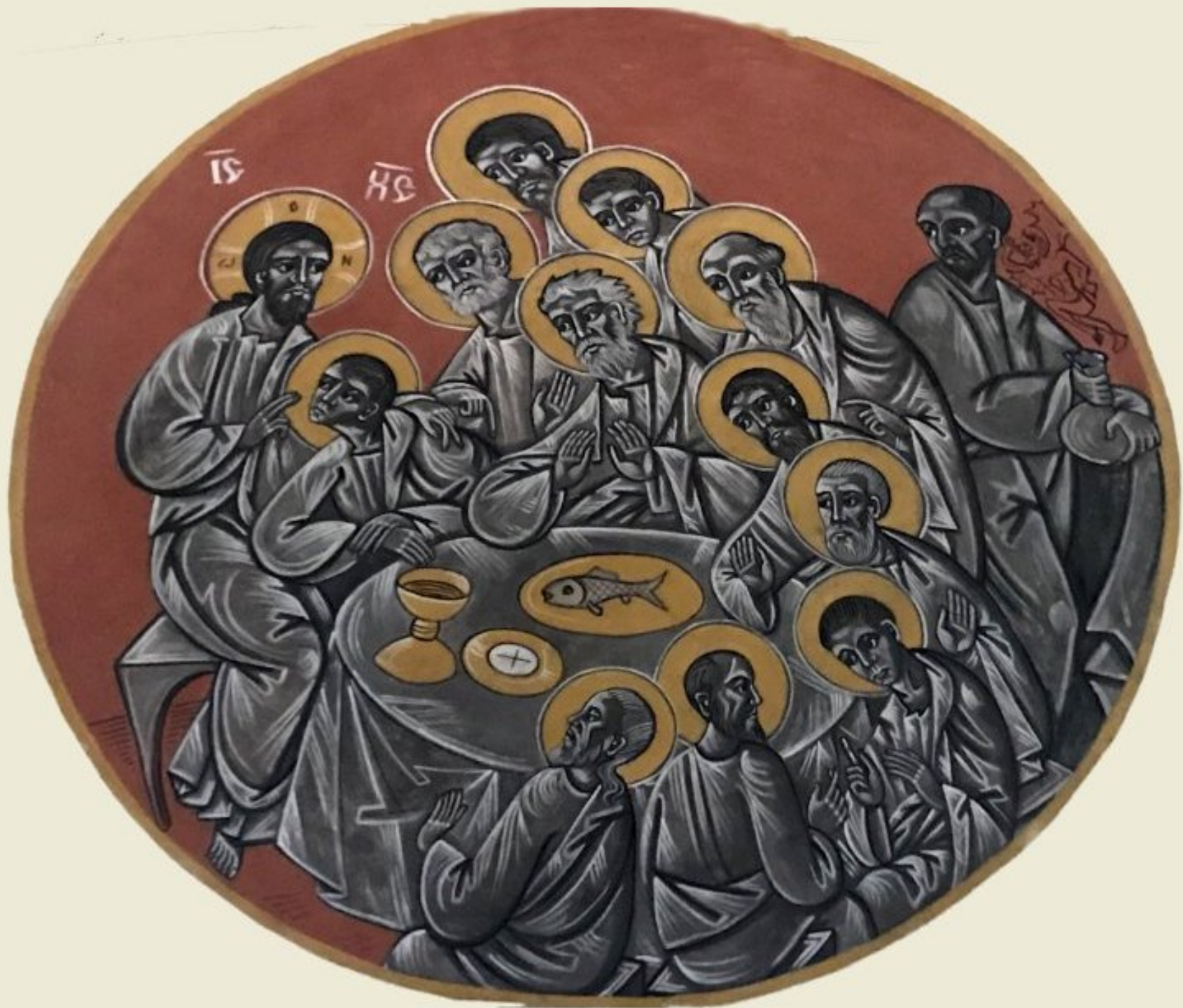
Eglise de Lagarde (Aveyron) - La Cène - Fresque de Nicolas Greschny