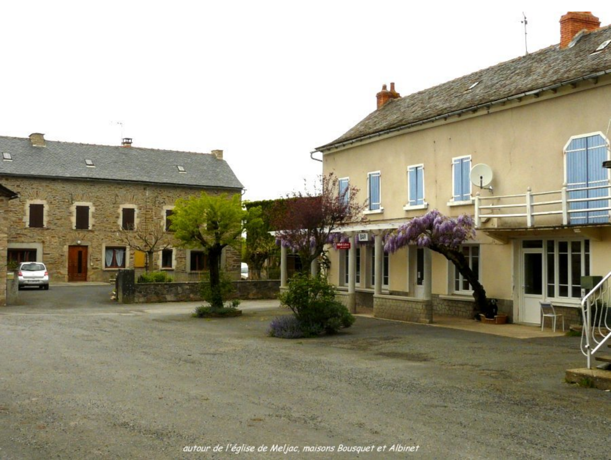
autour de l'église de Meljac, maisons Bousquet et Albinet