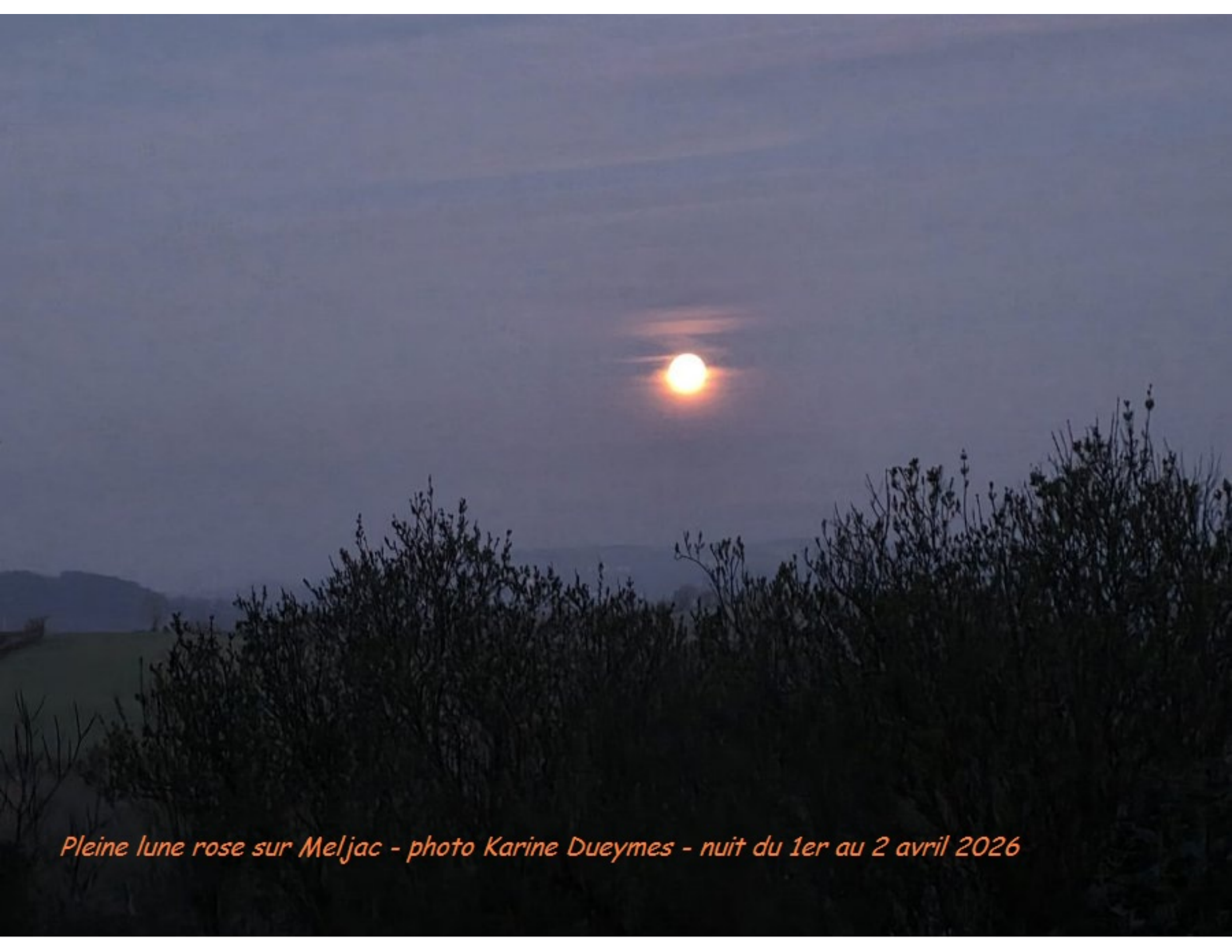
Pleine lune rose sur Meljac - nuit du 1er au 2 avril 2026