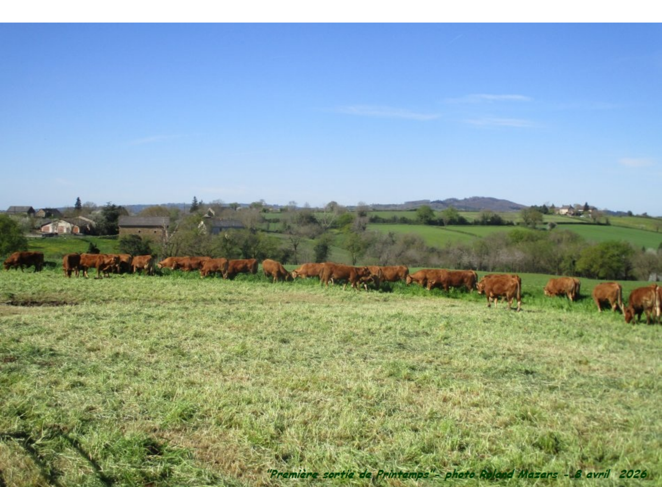
"Première sortie de Printemps" - photo Roland Mazars - 8 avril 2026