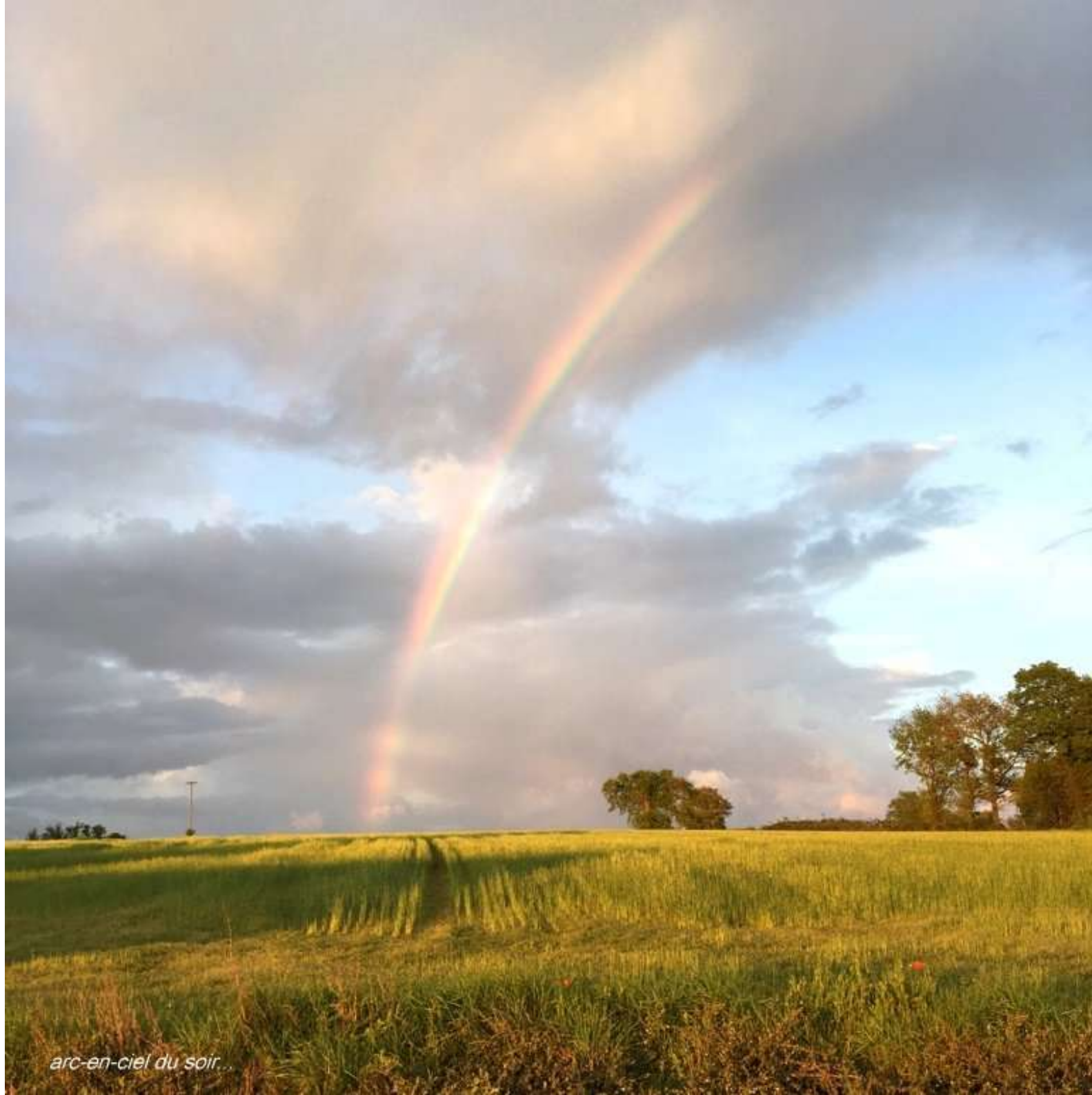
arc-en-ciel du soir...