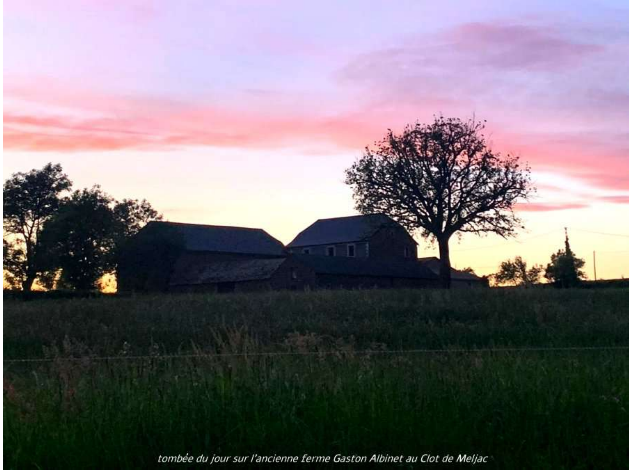
tombée du jour sur l'ancienne ferme Gaston Albinet au Clot de Meljac