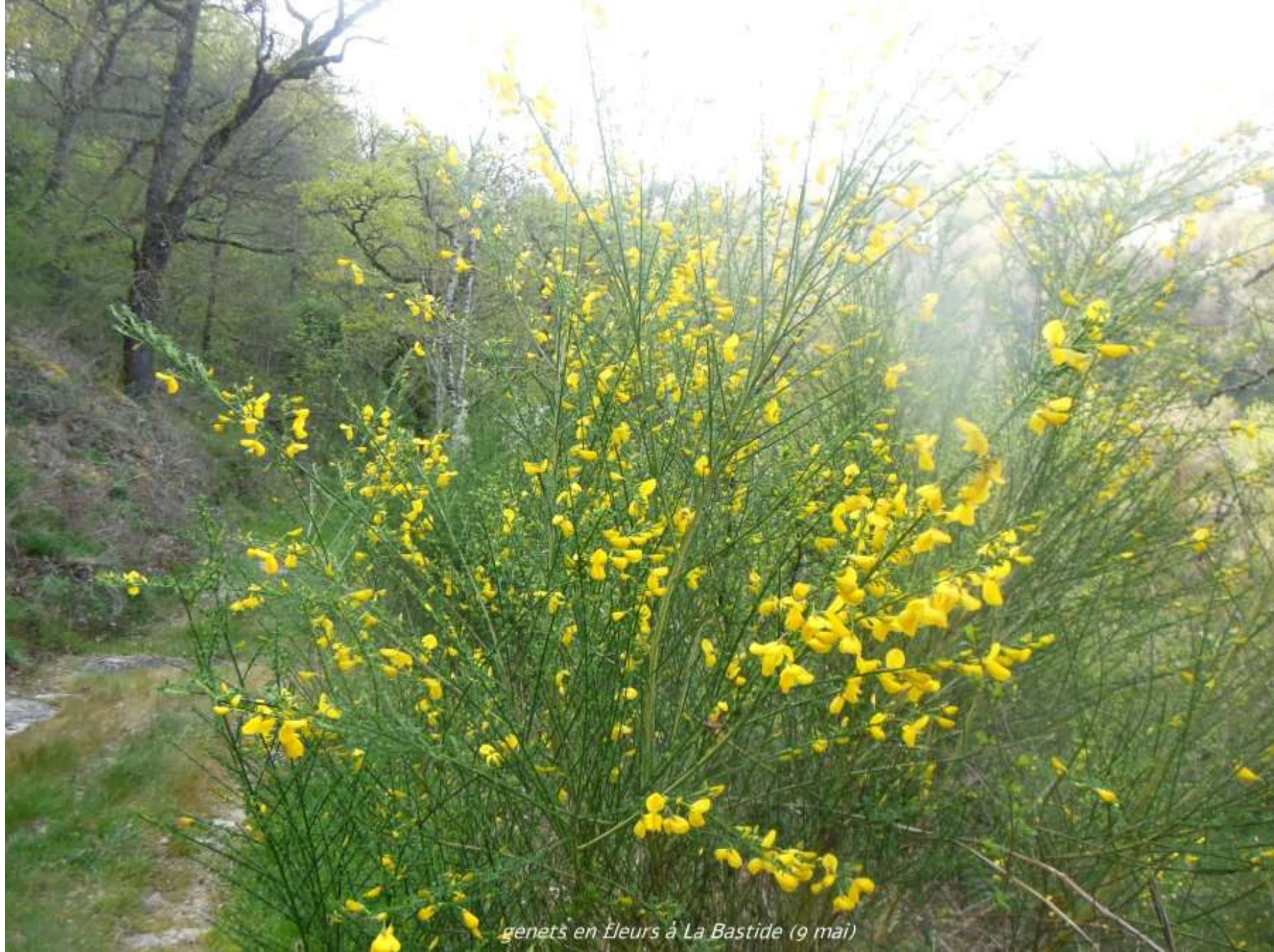
genets en fleurs à La Bastide (9 mai)