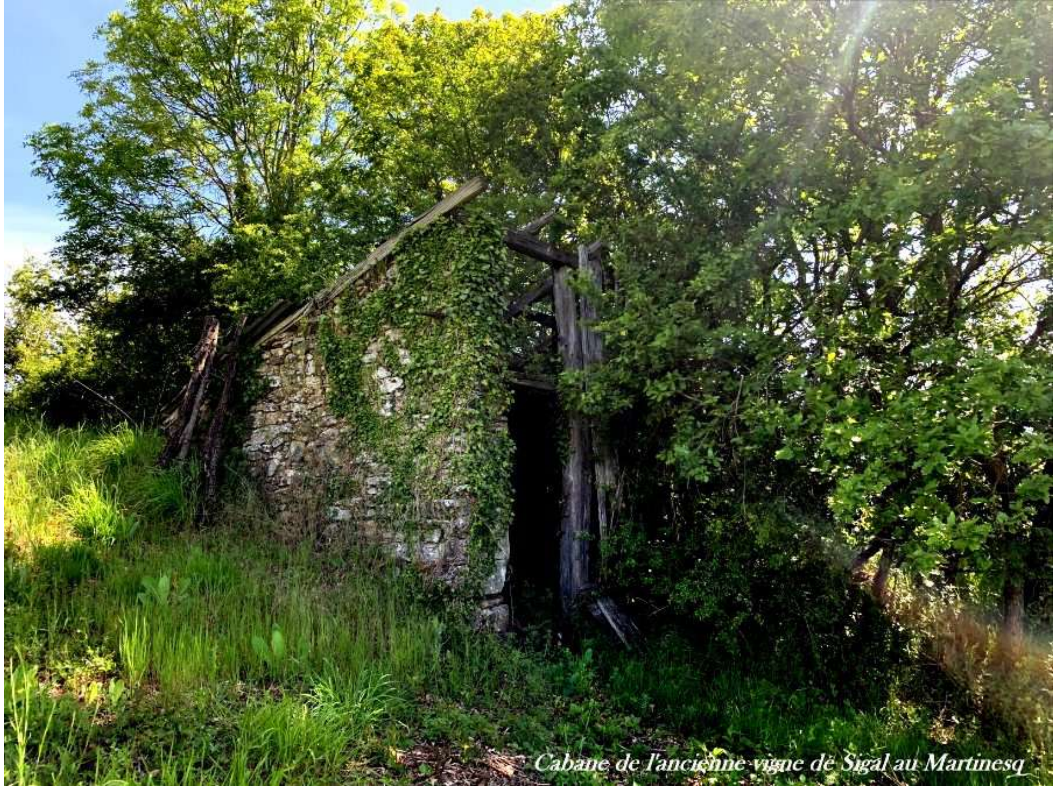
Cabane de l'ancienne vigne de Sigal au Martinesq