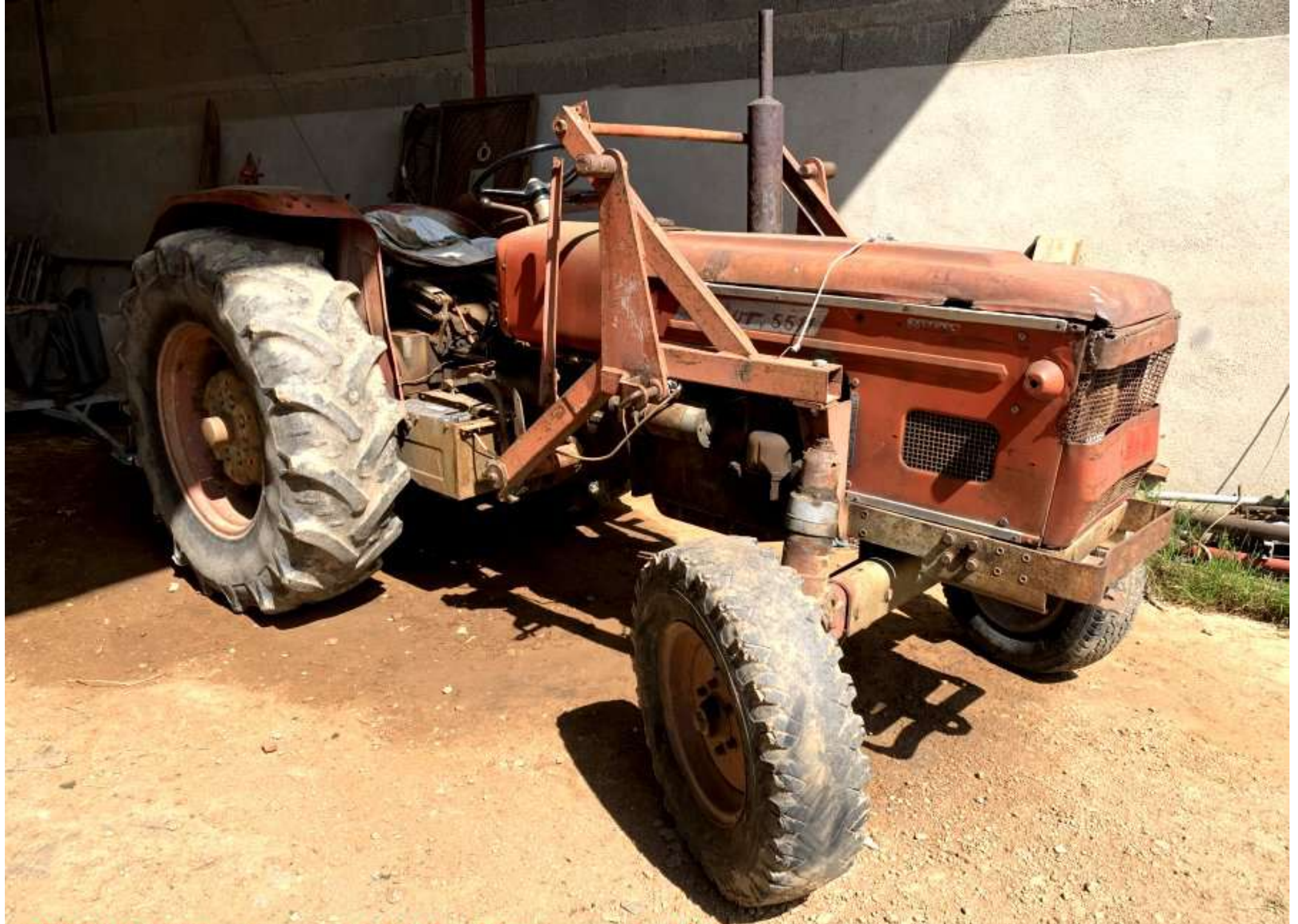
ZETOR 5571 - Année 1968 (Le Martinesq de Meljac)