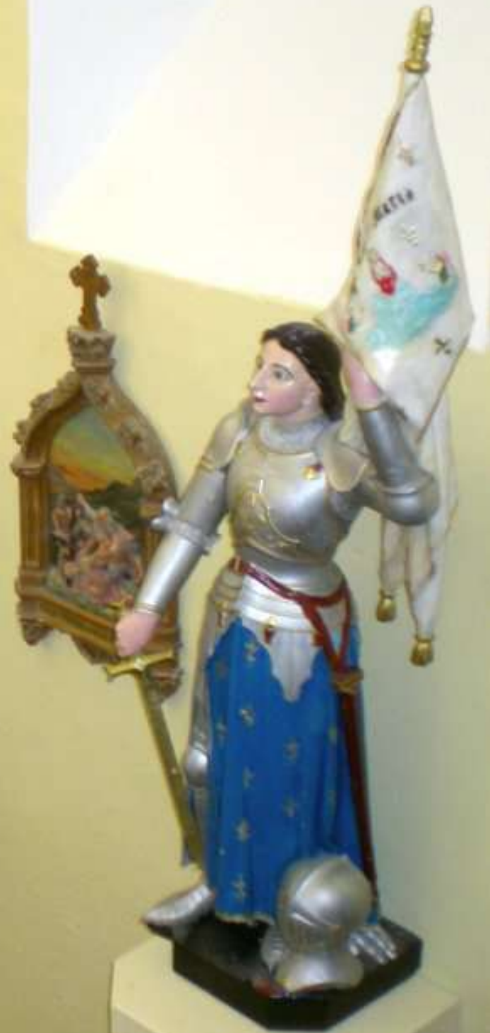
église de Céor