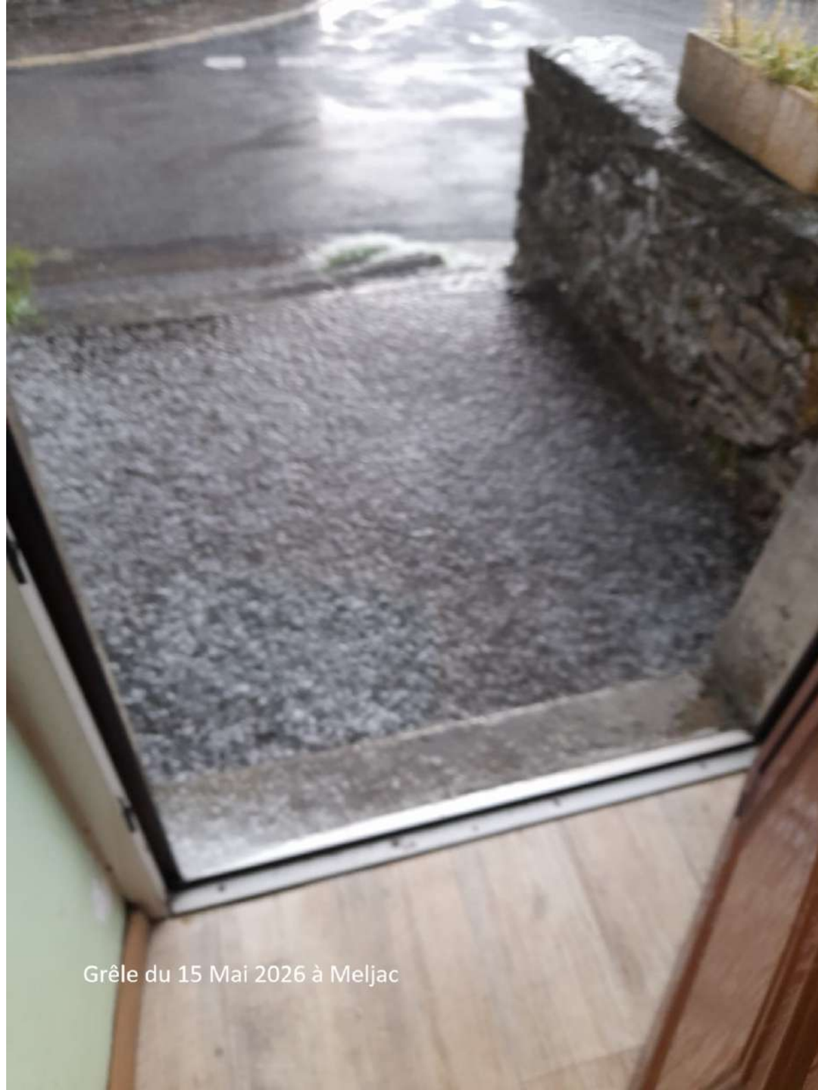
Grêle du 15 Mai 2026 à Meljac