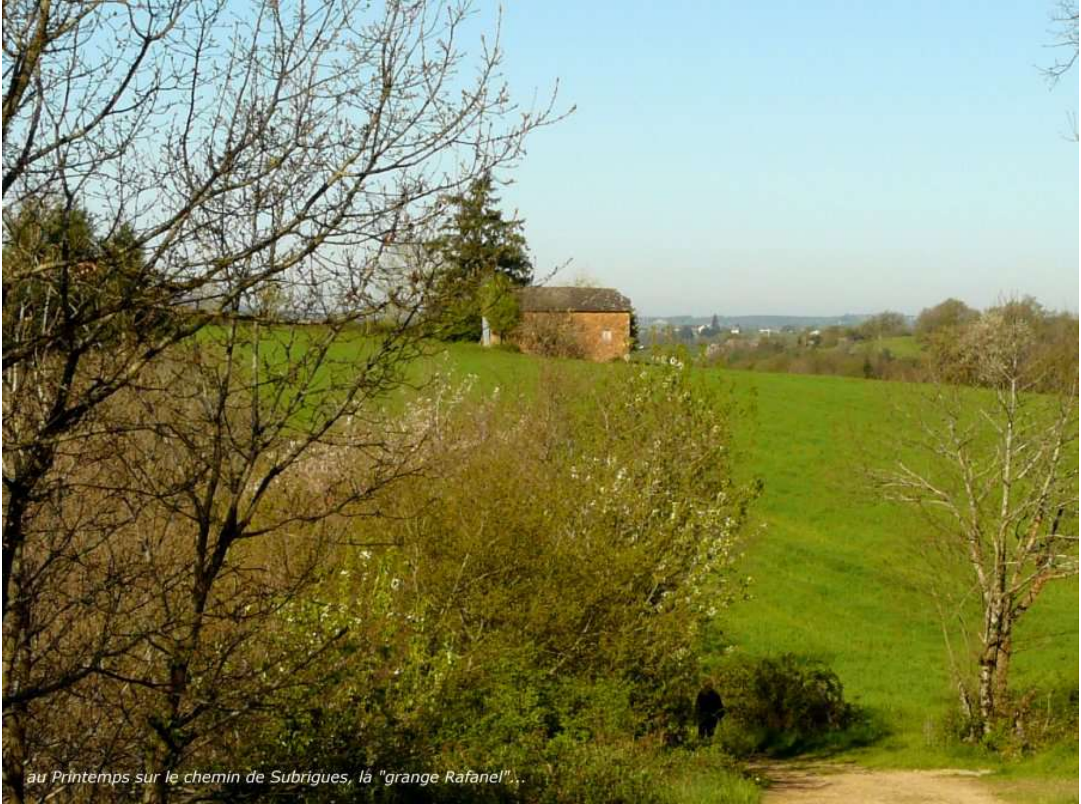
au Printemps sur le chemin de Subrigues, là "grange Rafanel"...