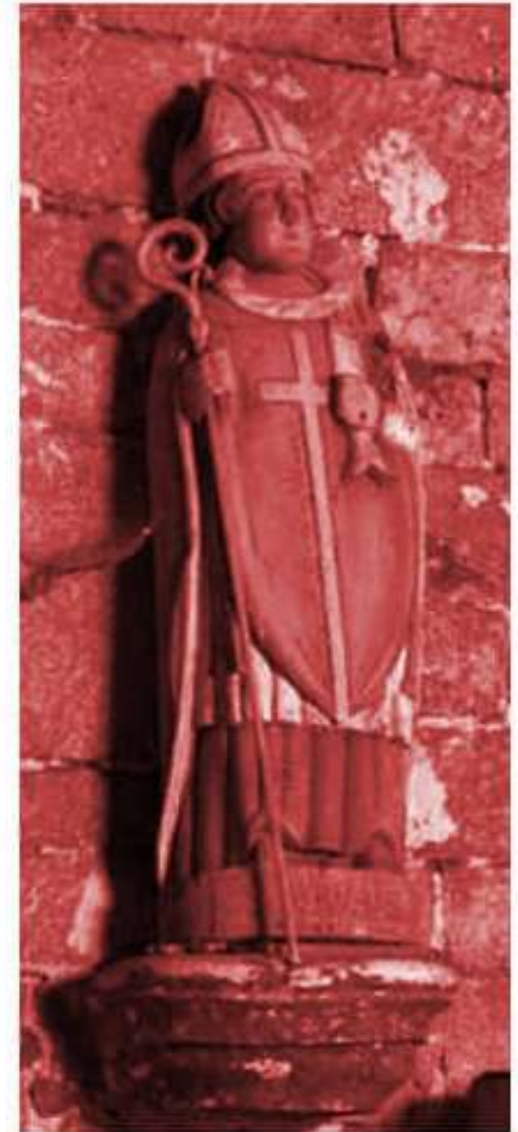
Saint Servais 13 mai

« Les saints Servais, Pancrace et Mamert : à eux trois, un petit hiver », dit le dicton populaire ou encore « Avant saint Servais point d'été, après saint Servais plus de gelée. »