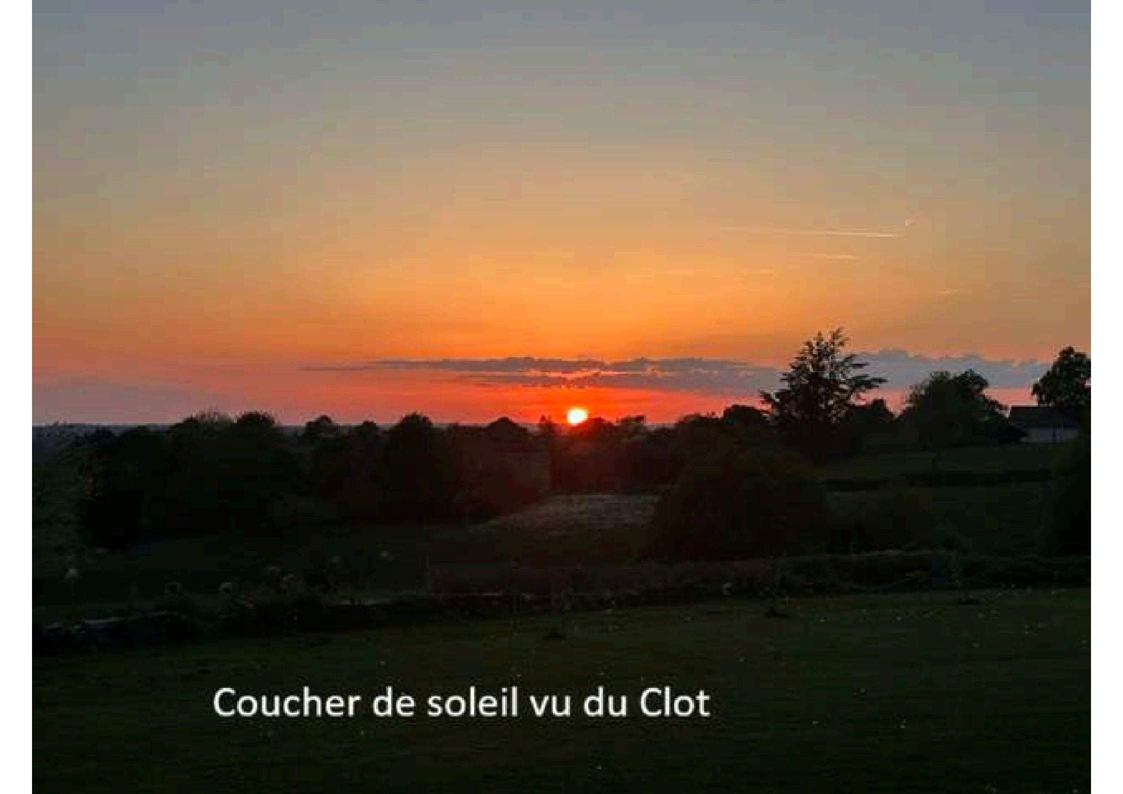
Coucher de soleil vu du Clot