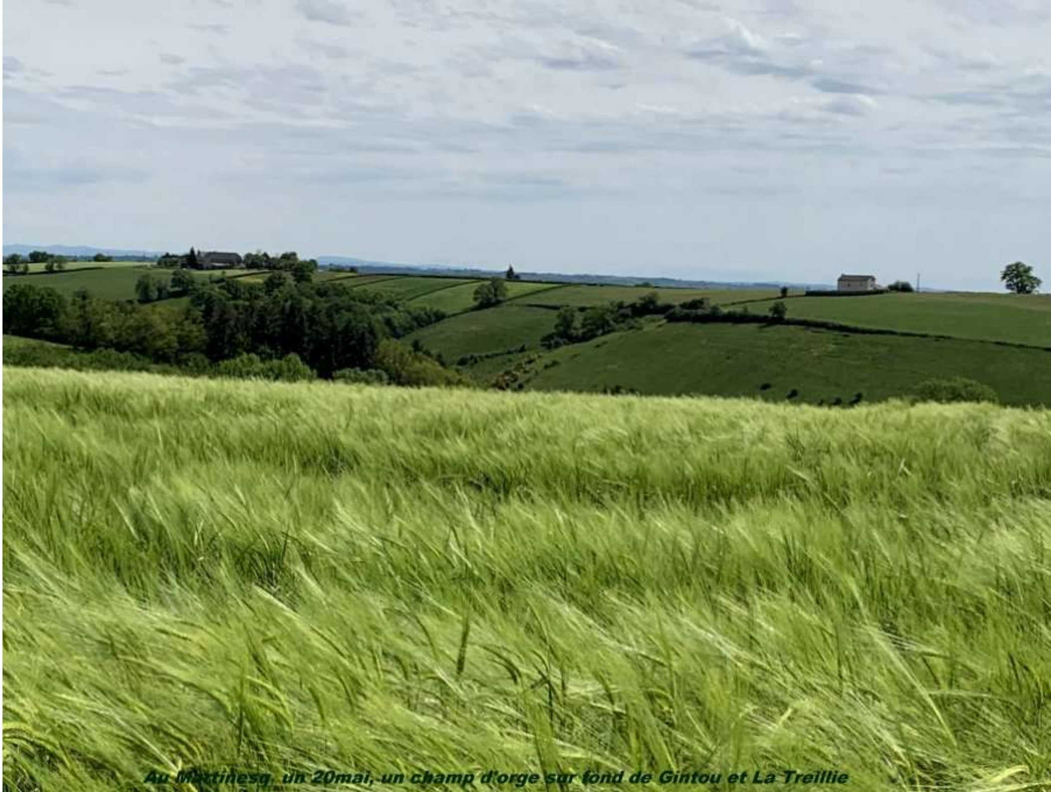
Au Martinesq, un 20mai, un champ d'orge sur fond de Gintou et La Treillie