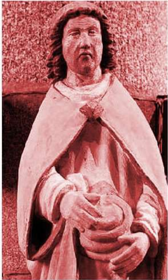
Saint Mamert 11 mai