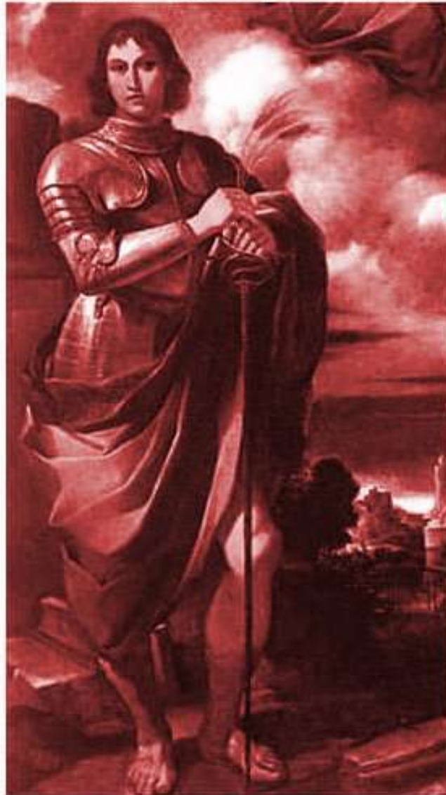
Saint Pancrace 12 mai