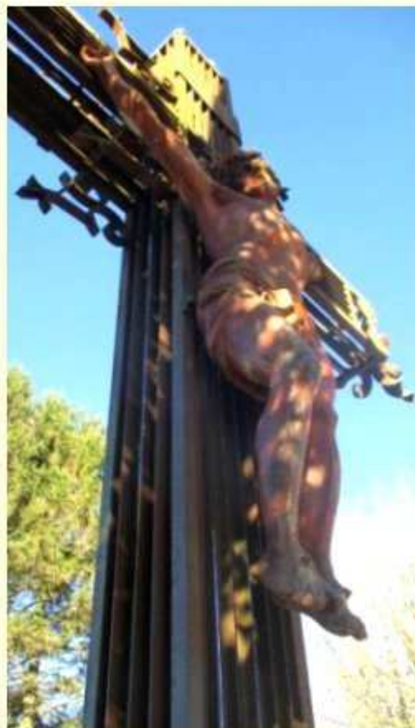
"la divine image est depuis 1909 exposée sur l'ouvrage fonte-fer" (extrait du "Dolmen de l'Homme Mort")

A l'évidence les travaux de rénovation de la Croix de l'Homme Mort iront bien au-delà d'une simple consolidation du socle et de la peinture de la Croix ainsi que mentionné dans le bulletin municipal 2022 de Meljac.