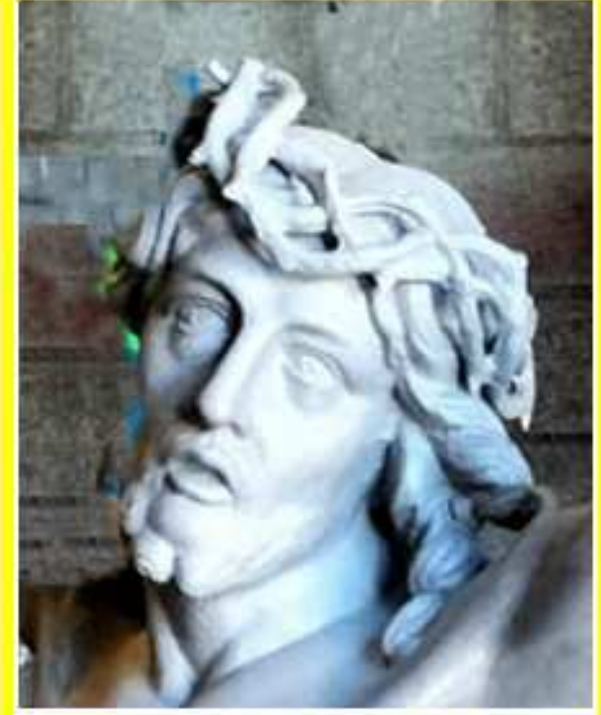
statue du Christ de la Croix de l'Homme Mort avant et après sablage