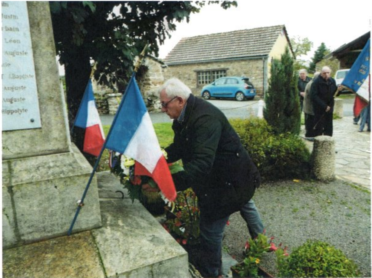
CEREMONIE DU 11 NOVEMBRE 2019