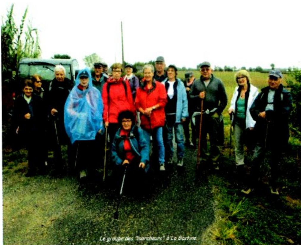
Le groupe des "marcheurs" à La Bastine

LE BUREAU DU CLUB VOUS SOUHAITE DE BONNES FETES DE FIN D'ANNEE ET VOUS PRESENTE SES MEILLEURS VOEUX DE SANTE ET BONHEUR POUR 2020