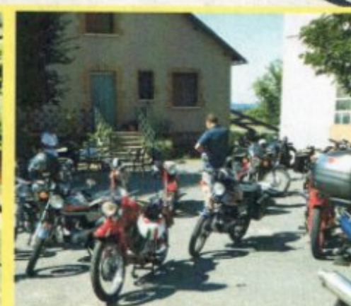
La ronde des motos a fait une halte à Meljac le dimanche 25 août 2019.