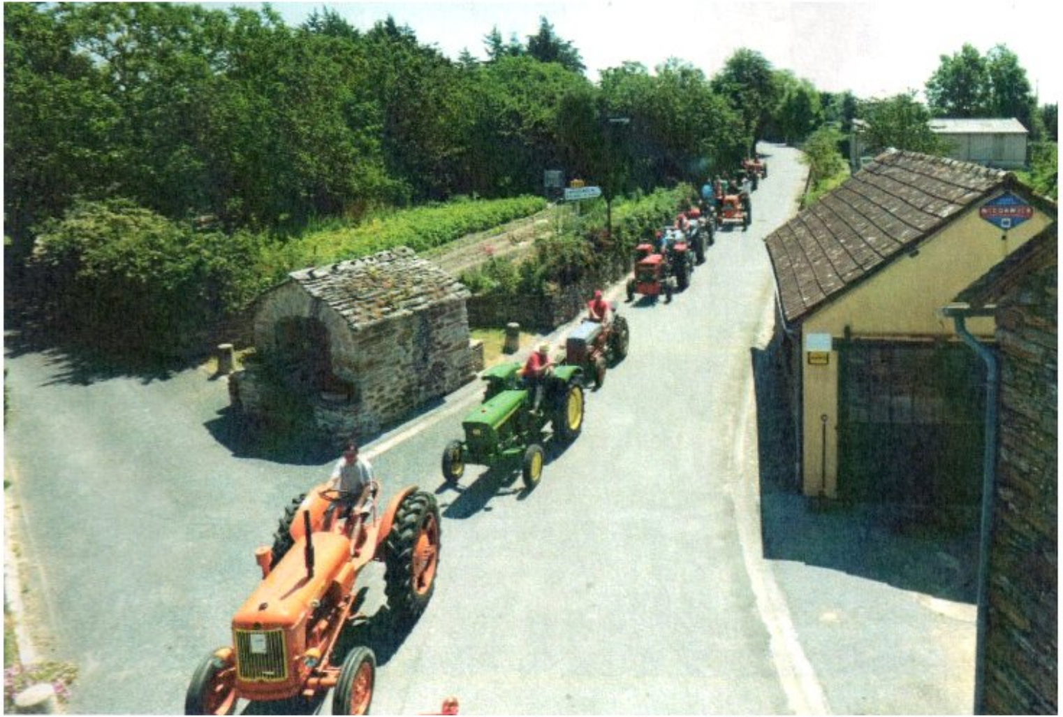
Le dimanche 30 juin 2019, une cinquantaine de tracteurs anciens ont défilé dans le bourg de Meljac