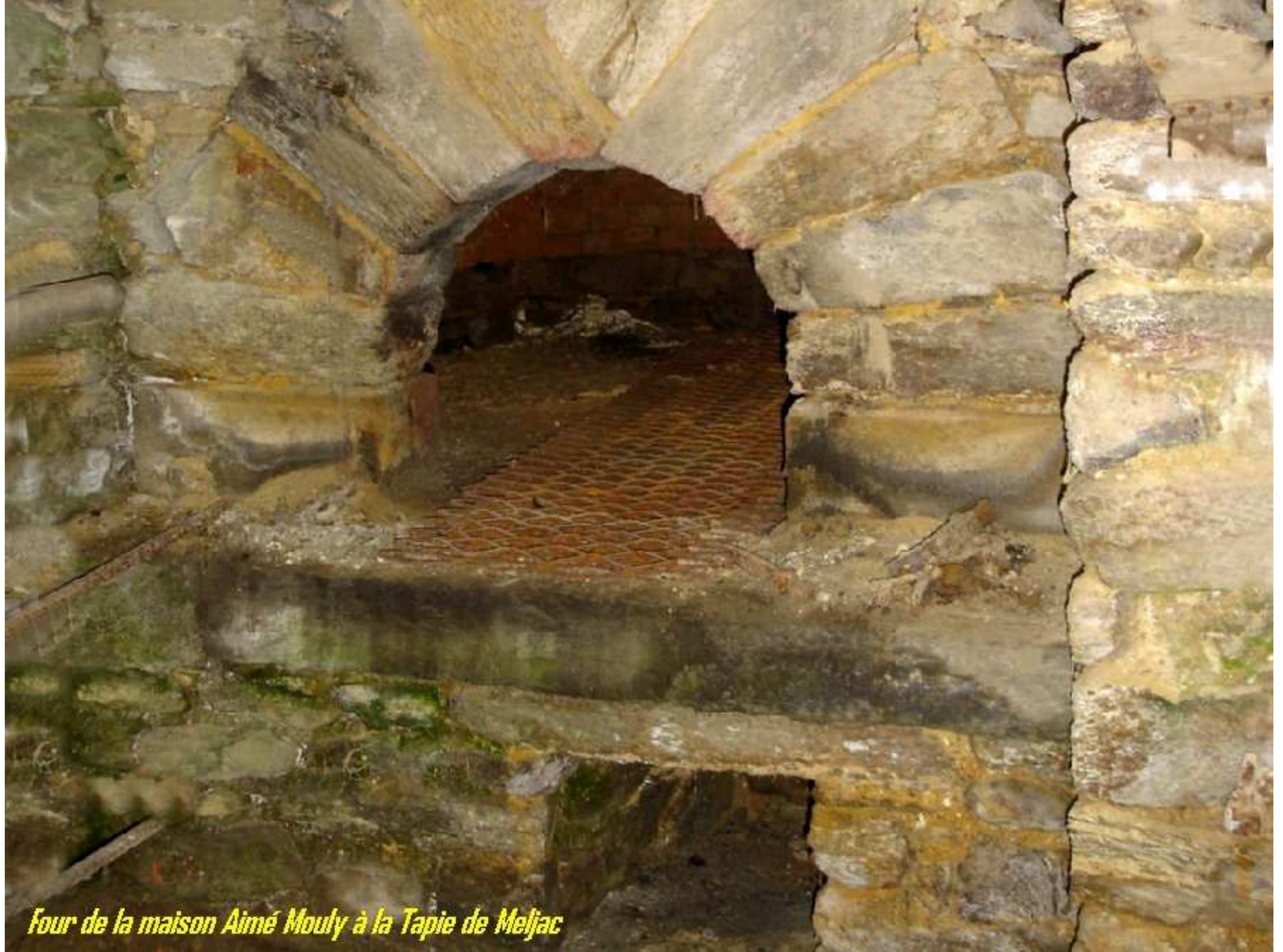
Four de la maison Aimé Mouly à la Tapie de Meljac