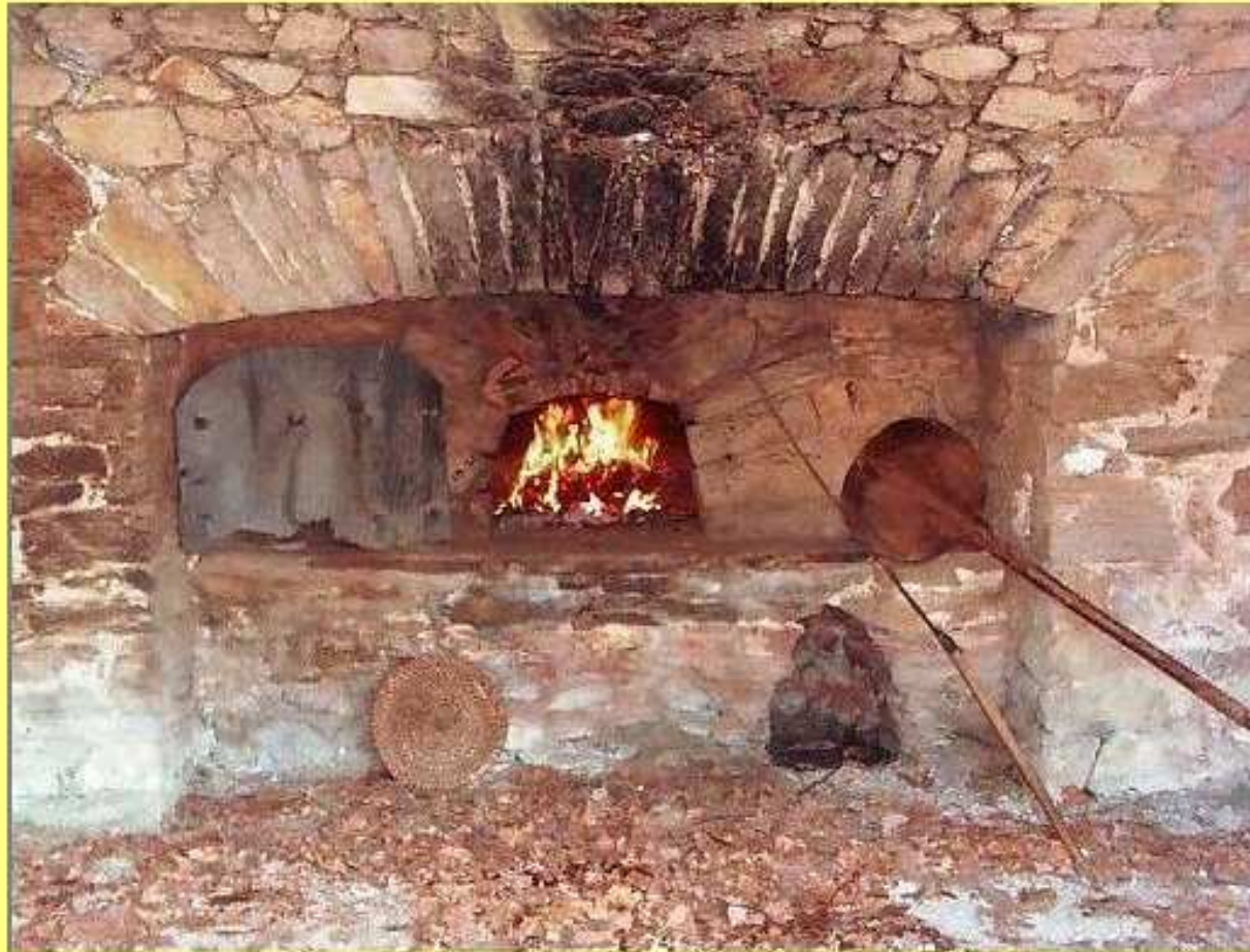
Four de la ferme Mazars de La Bessière de Meljac