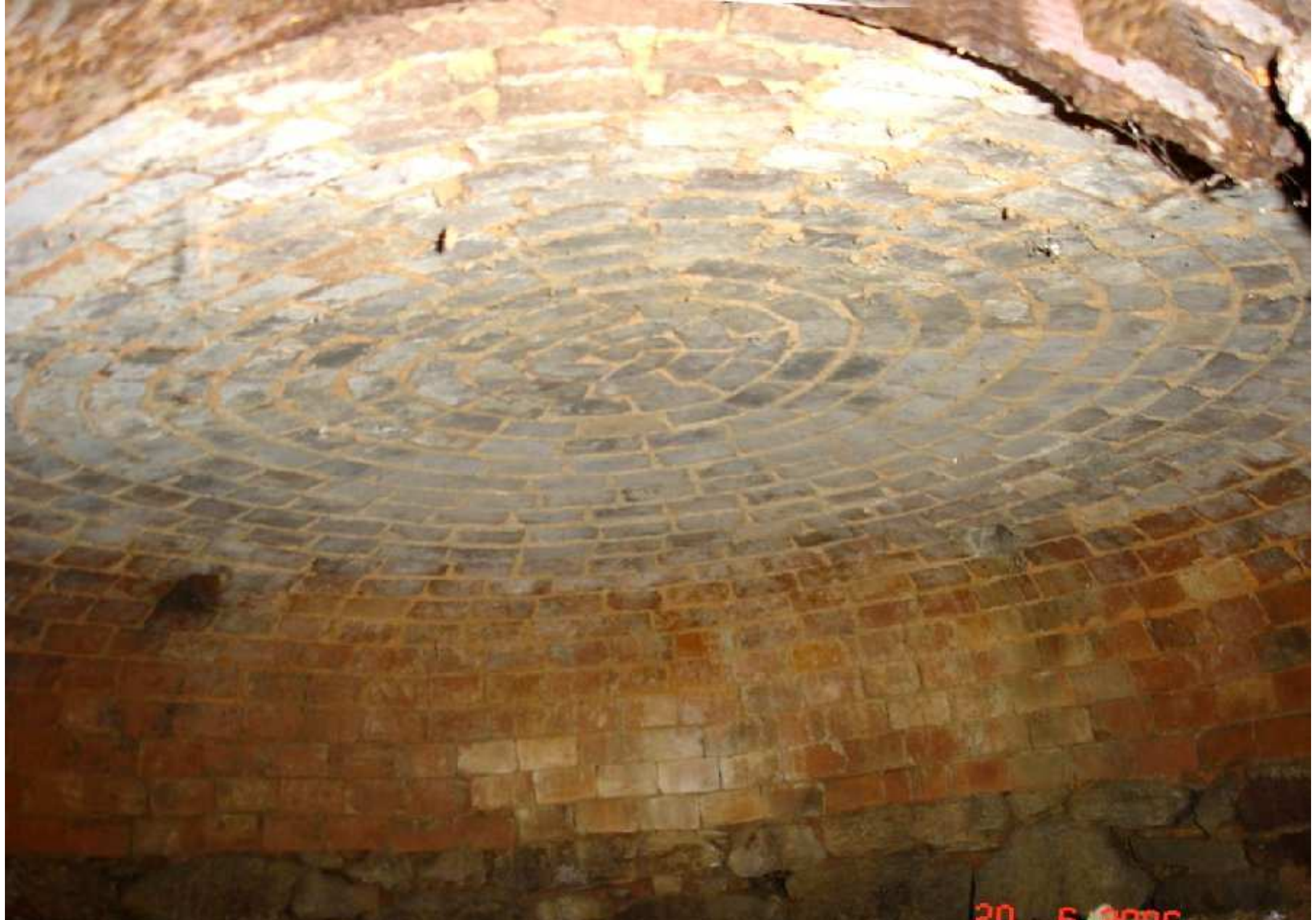
Four de la maison Aimé Mouly à la Tapie de Meljac (intérieur-plafond du four)