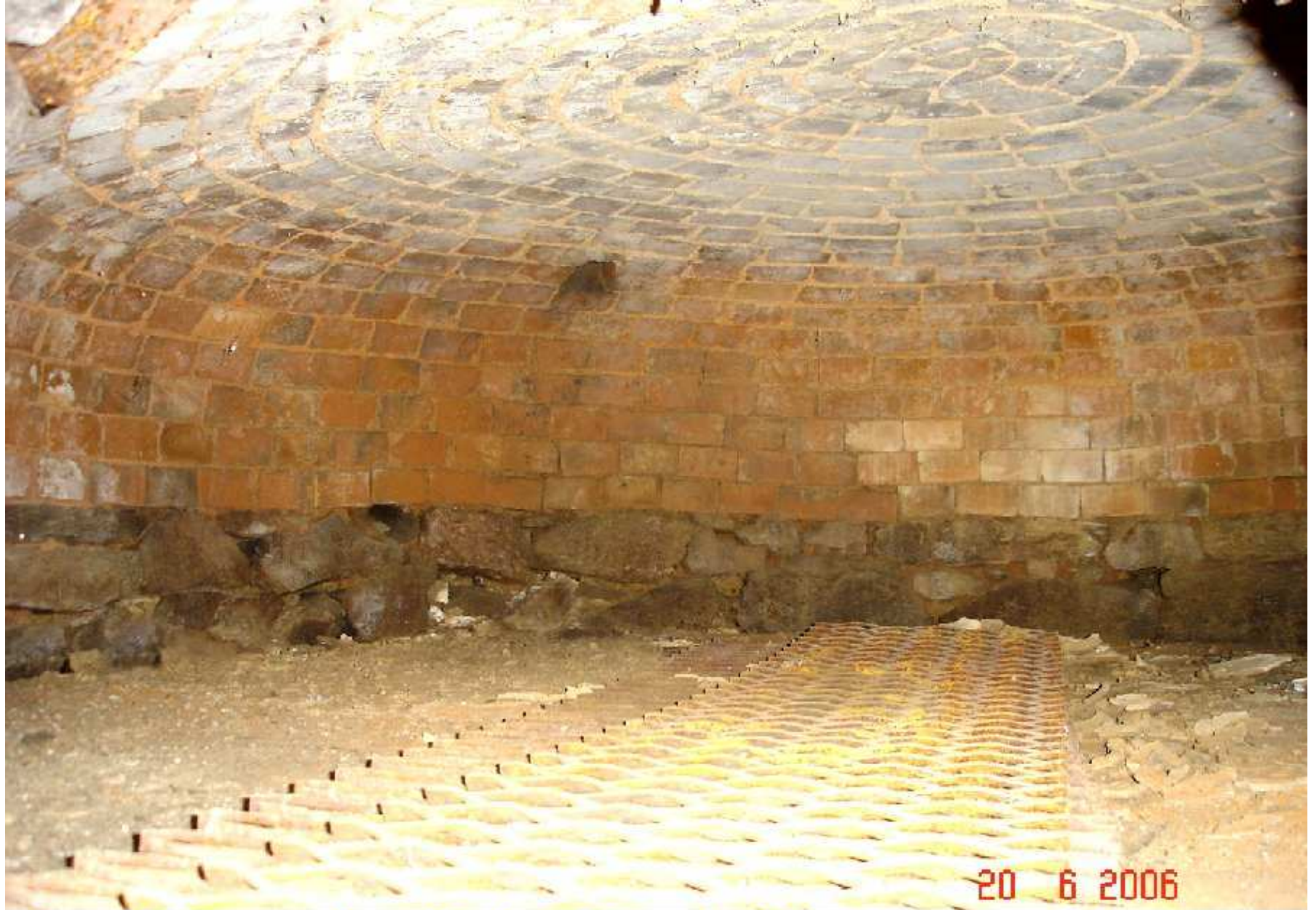
Four de la maison Aimé Mouly à la Tapie de Meljac (intérieur du four)