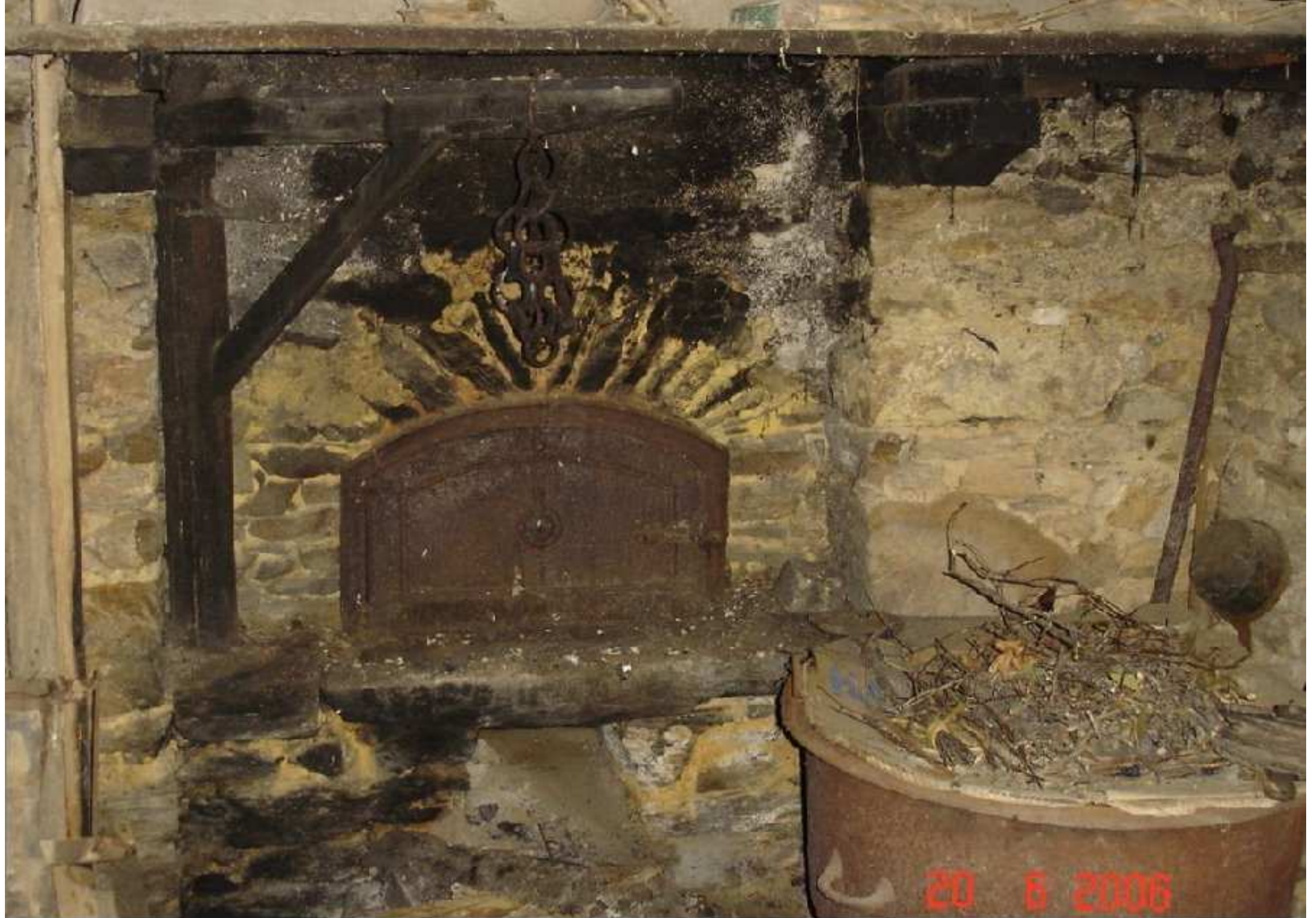
Four de la maison Barthes-Laurent au Martinesq de Meljac