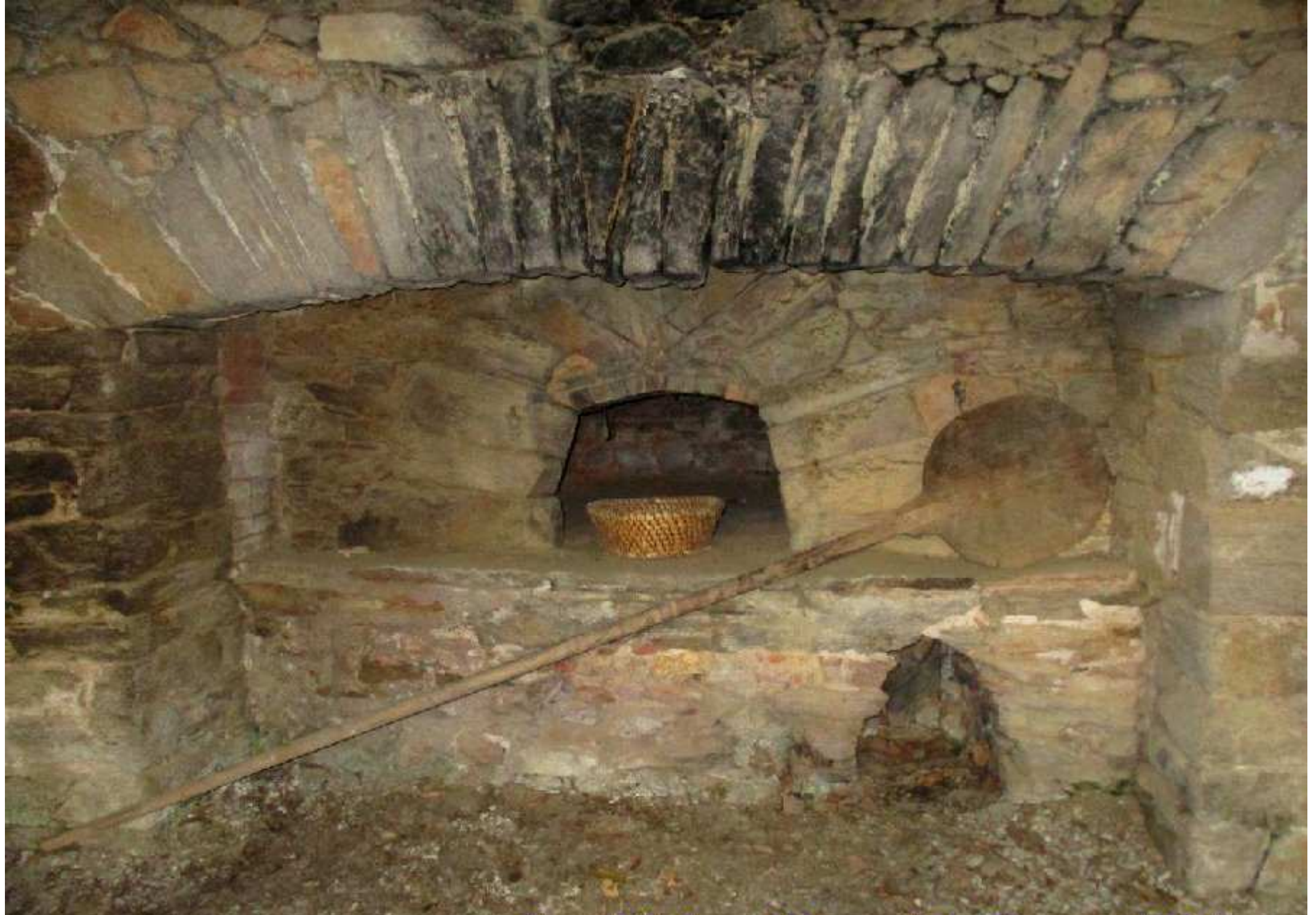
Four de la ferme Mazars de La Bessière de Meljac