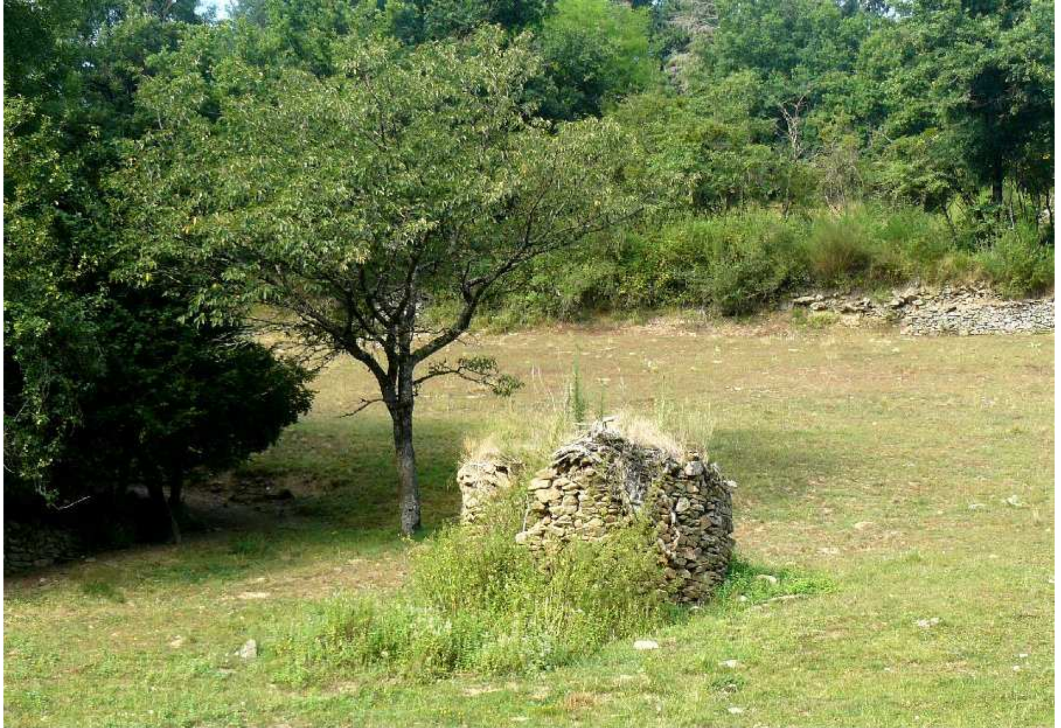
Four de la maison Boyer de Las Carrals de Meljac