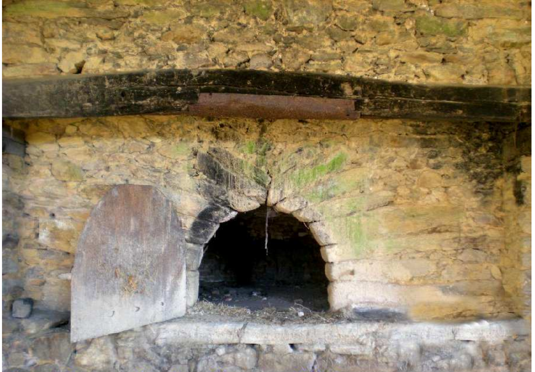
Four de la maison Fénoglio au Martinesq de Meljac