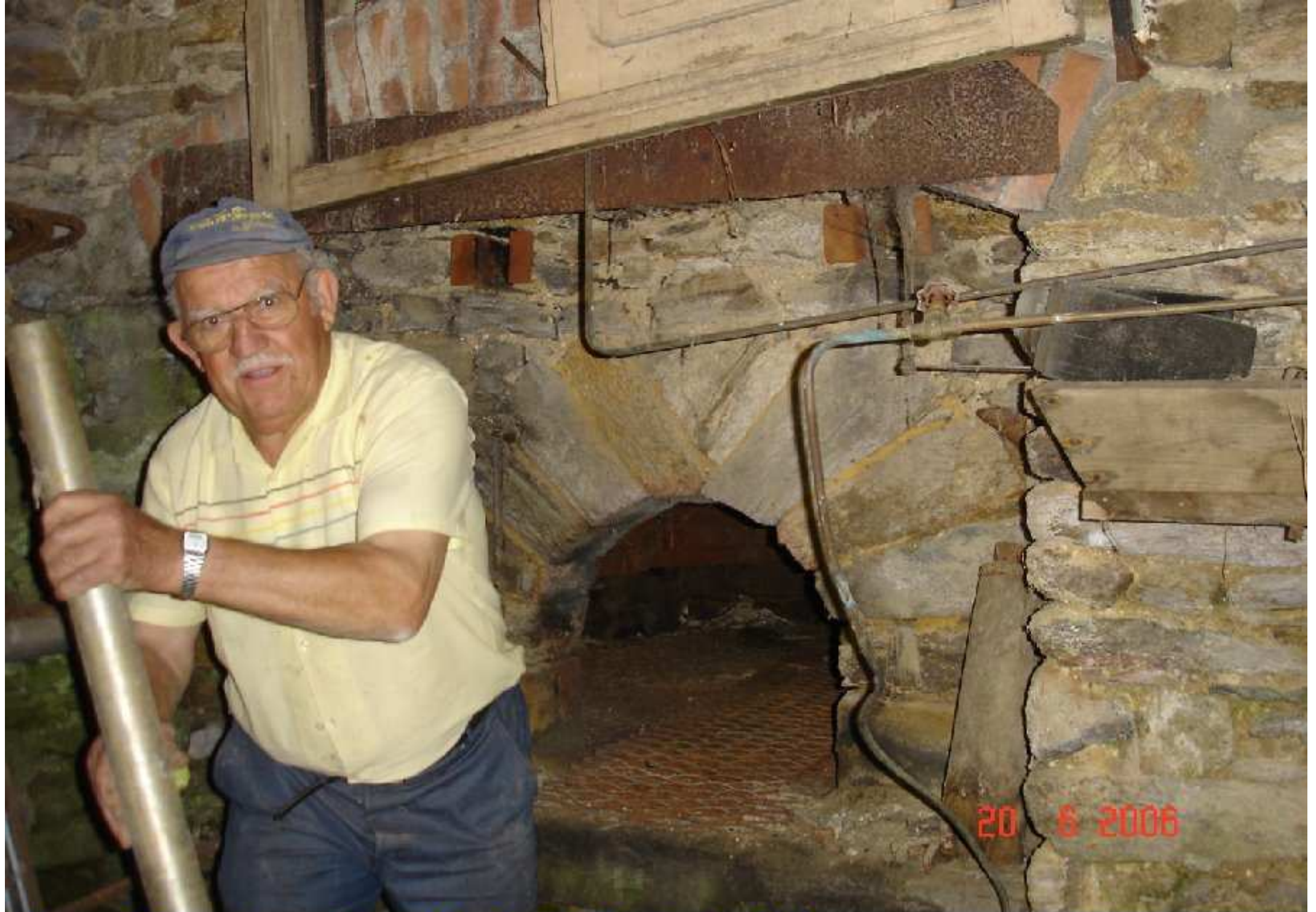
Four de la maison Aimé Mouly à la Tapie de Meljac