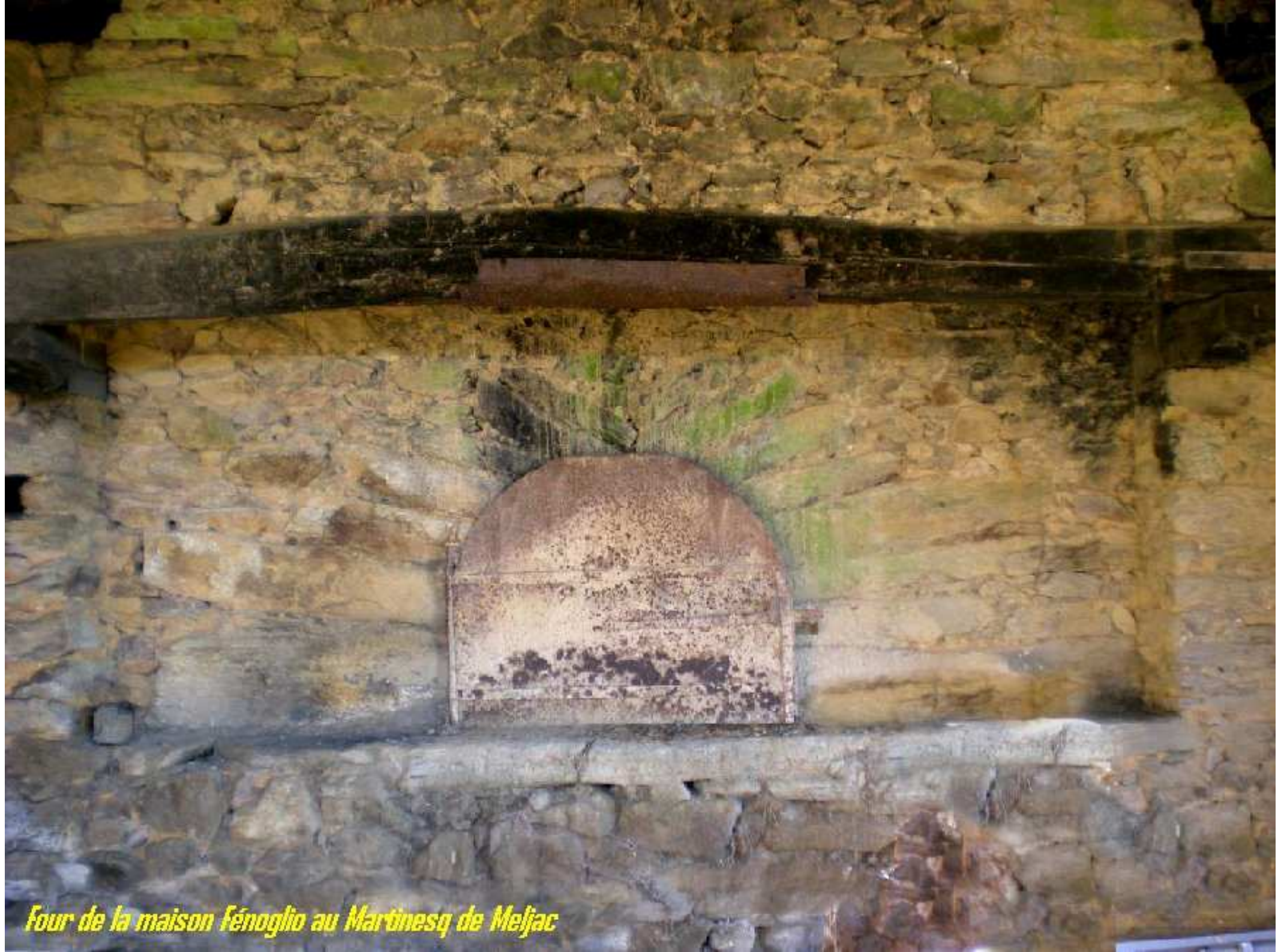
Four de la maison Fénoglio au Martinesq de Meljac