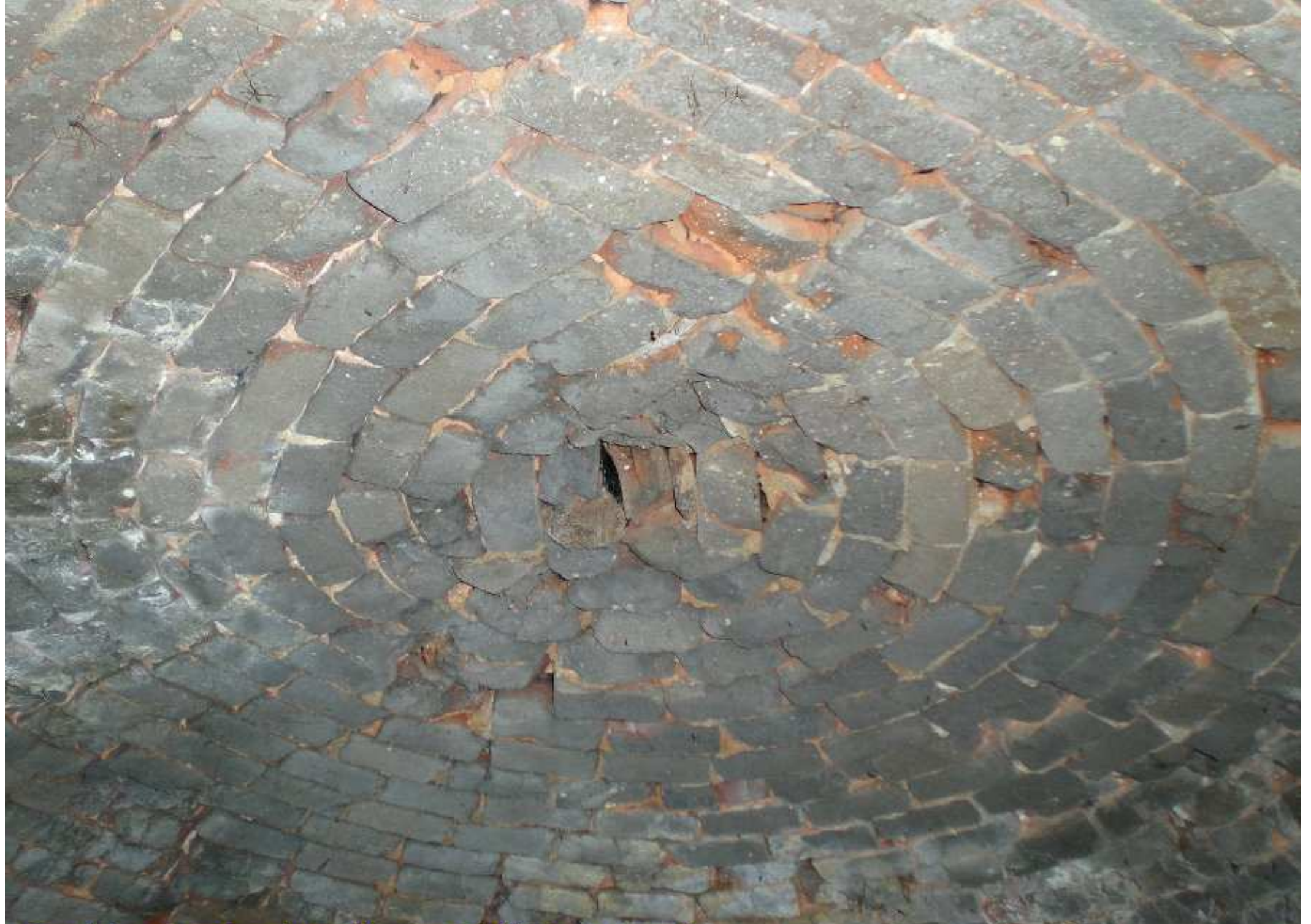
Four de la maison Fénoglio au Martinesq de Meljac (intérieur)