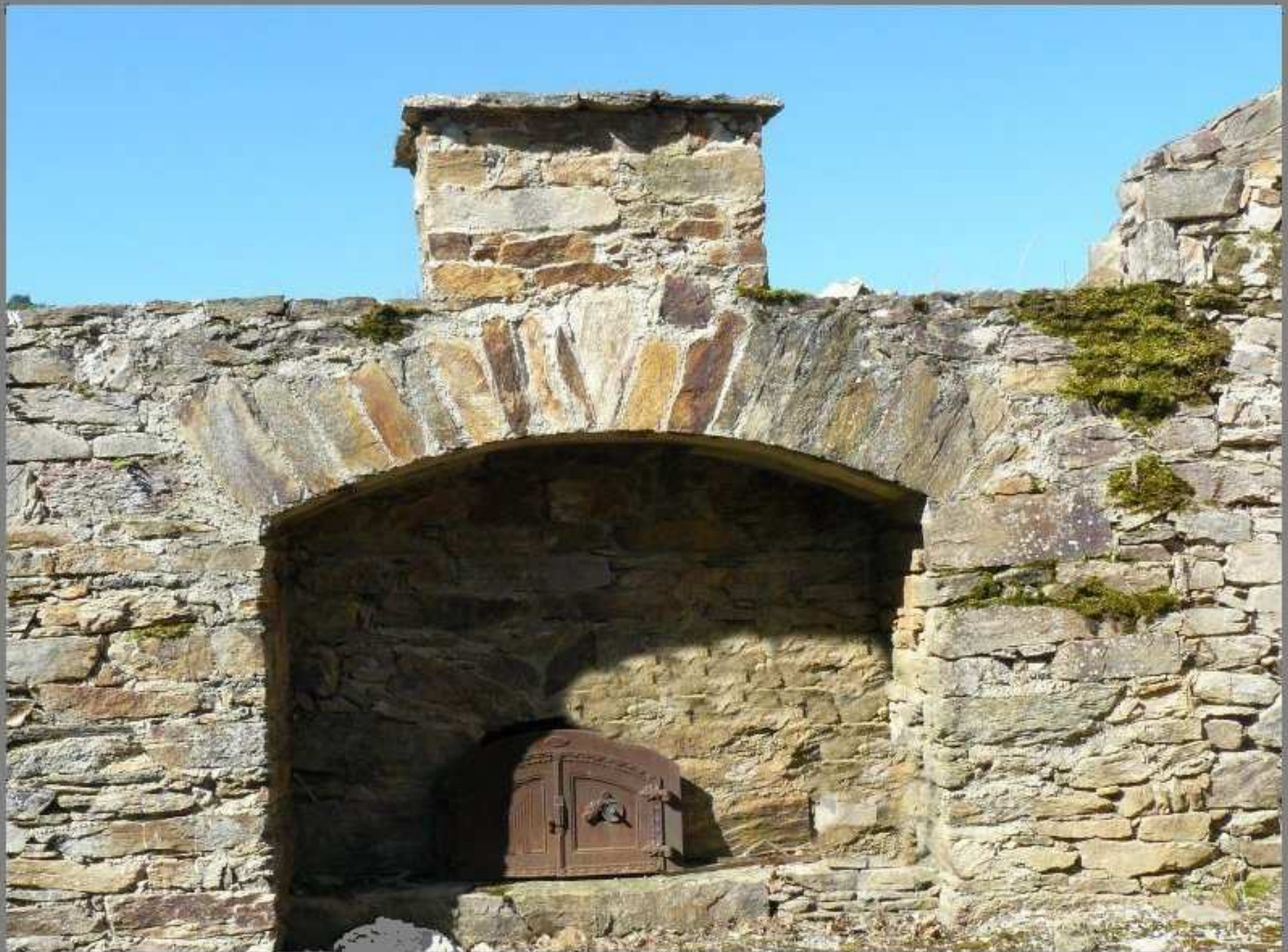
Four de la Bastide de JPM sous Meljac