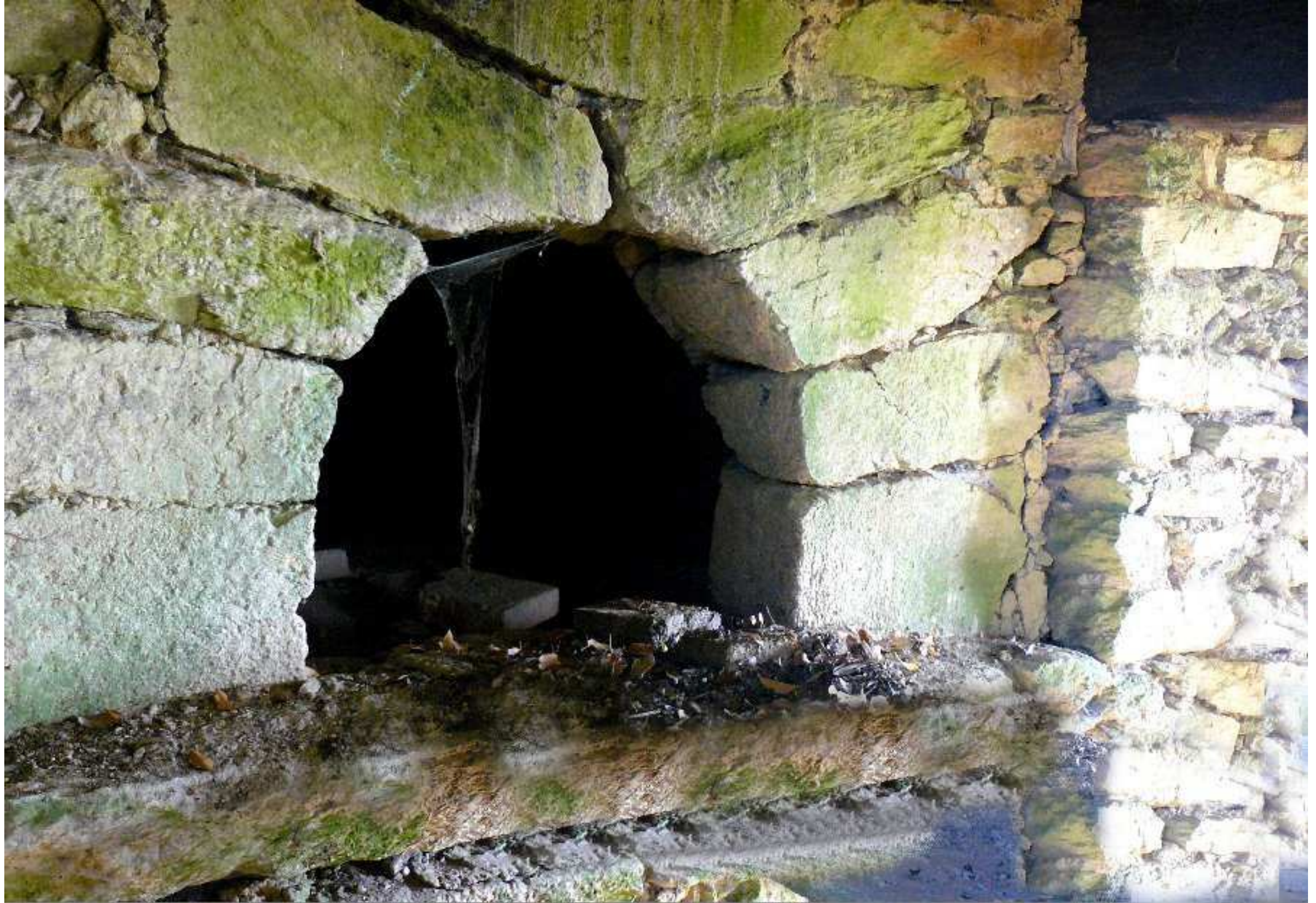
Four de l'ancienne maison Emile Boyer ("Milet") au Bourg de Meljac