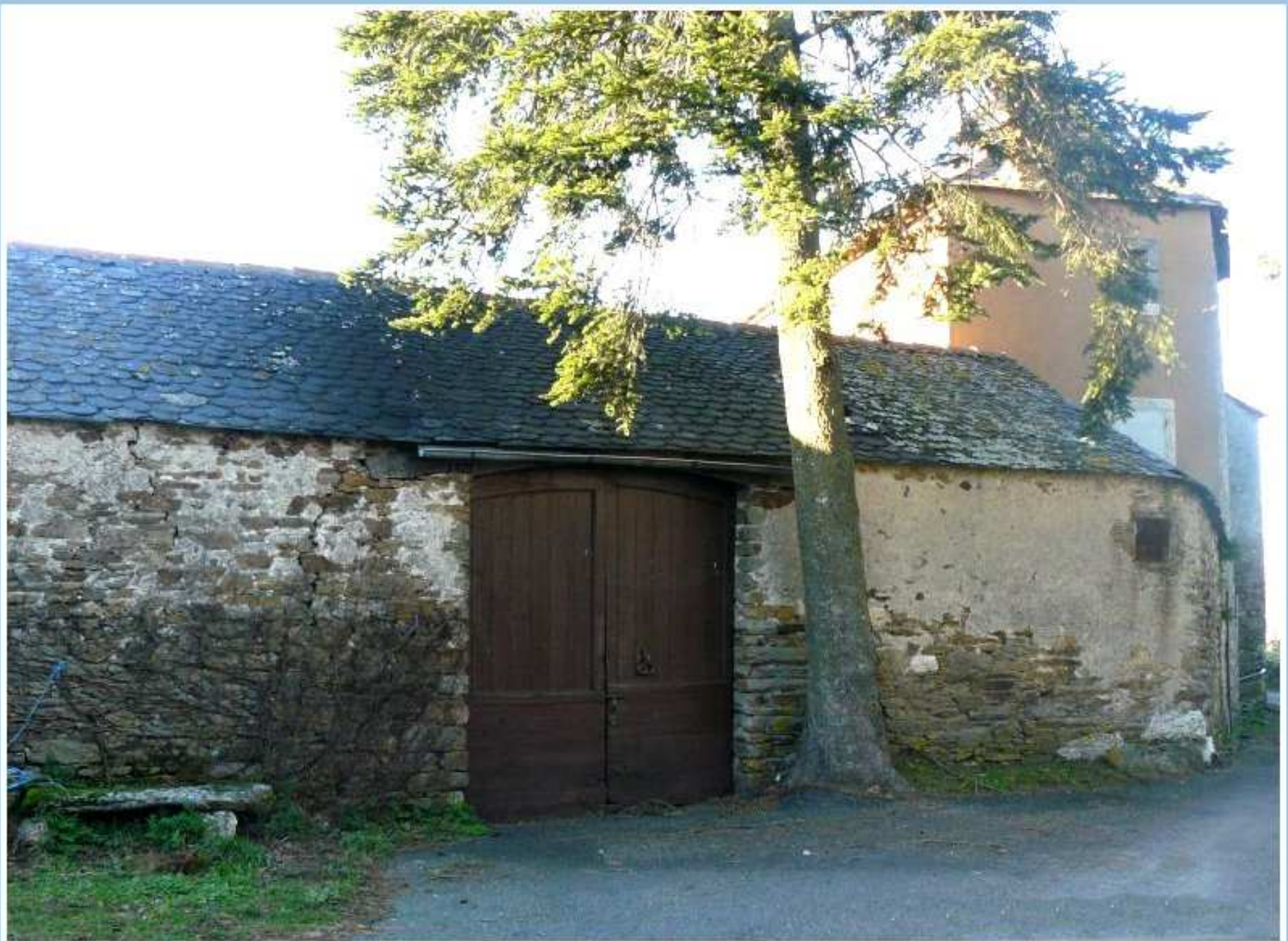
Porche de la cour de l'ancienne maison Sirmin au Bourg de Meljac - côté rue