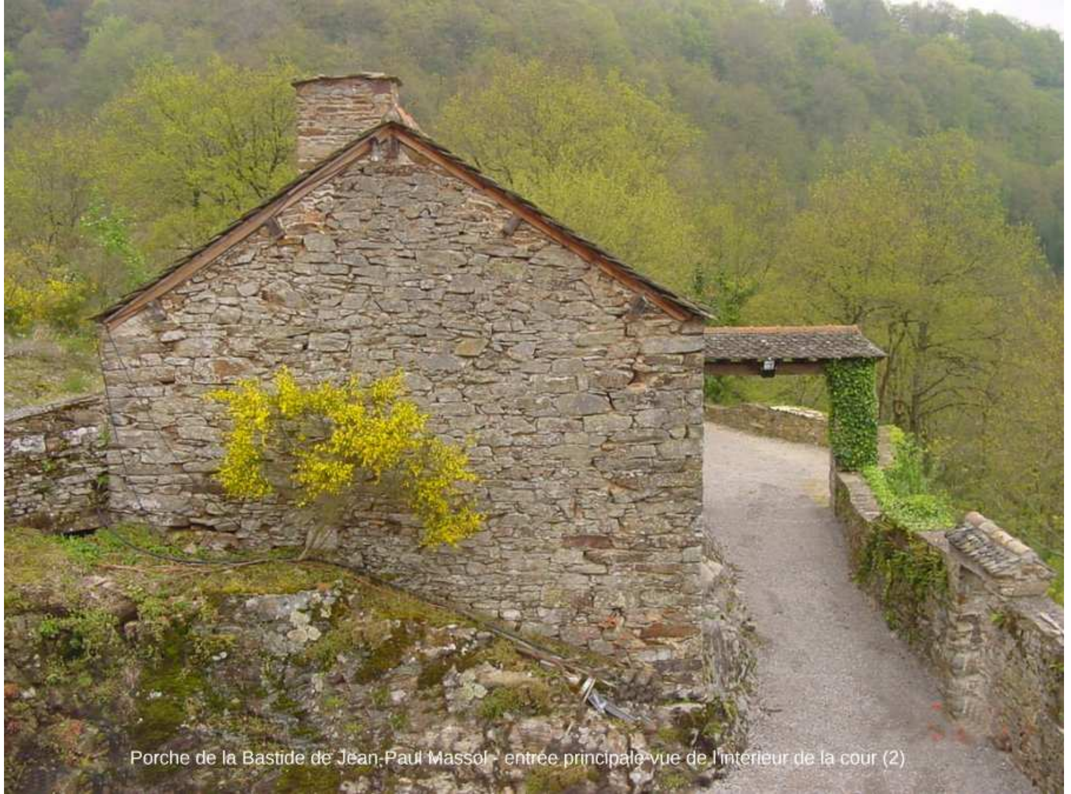
Porche de la Bastide de Jean-Paul Massol - entrée principale vue de l'intérieur de la cour (2)