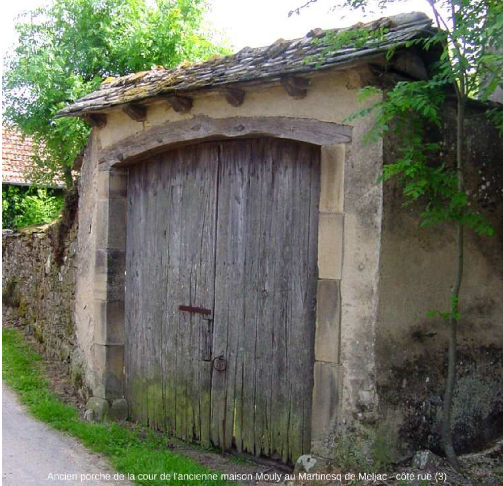
Ancien porche de la cour de l'ancienne maison Mouly au Martinesq de Meljac - côté rue (3)