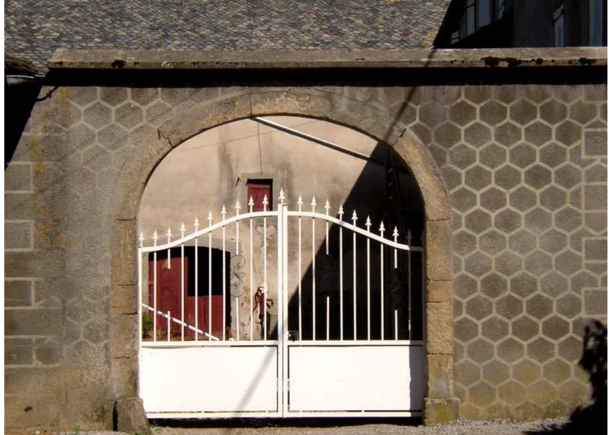
Porche de la cour de la ferme de Xavier Mazars de la Bessière de Meljac