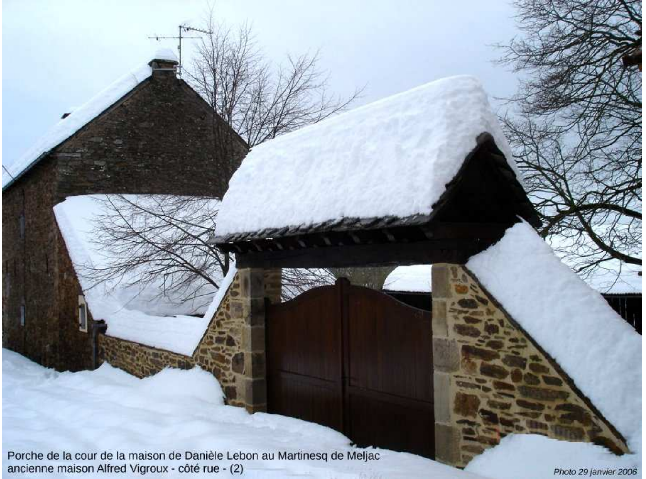
Porche de la cour de la maison de Danièle Lebon au Martinesq de Meljac ancienne maison Alfred Vigroux - côté rue - (2)