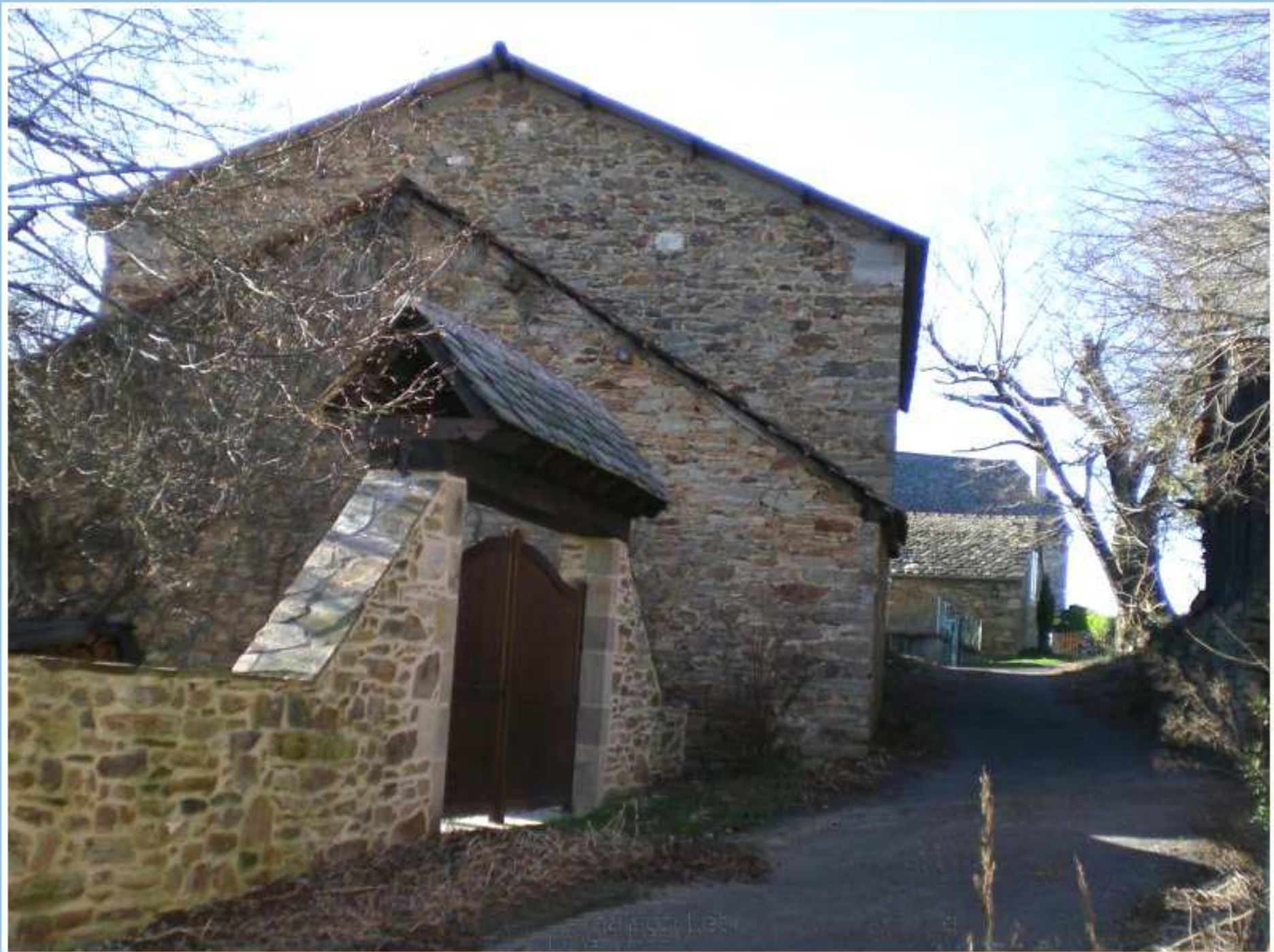
Porche de la cour de la maison de Danièle Lebon au Martinesq de Meljac côté rue - (1)