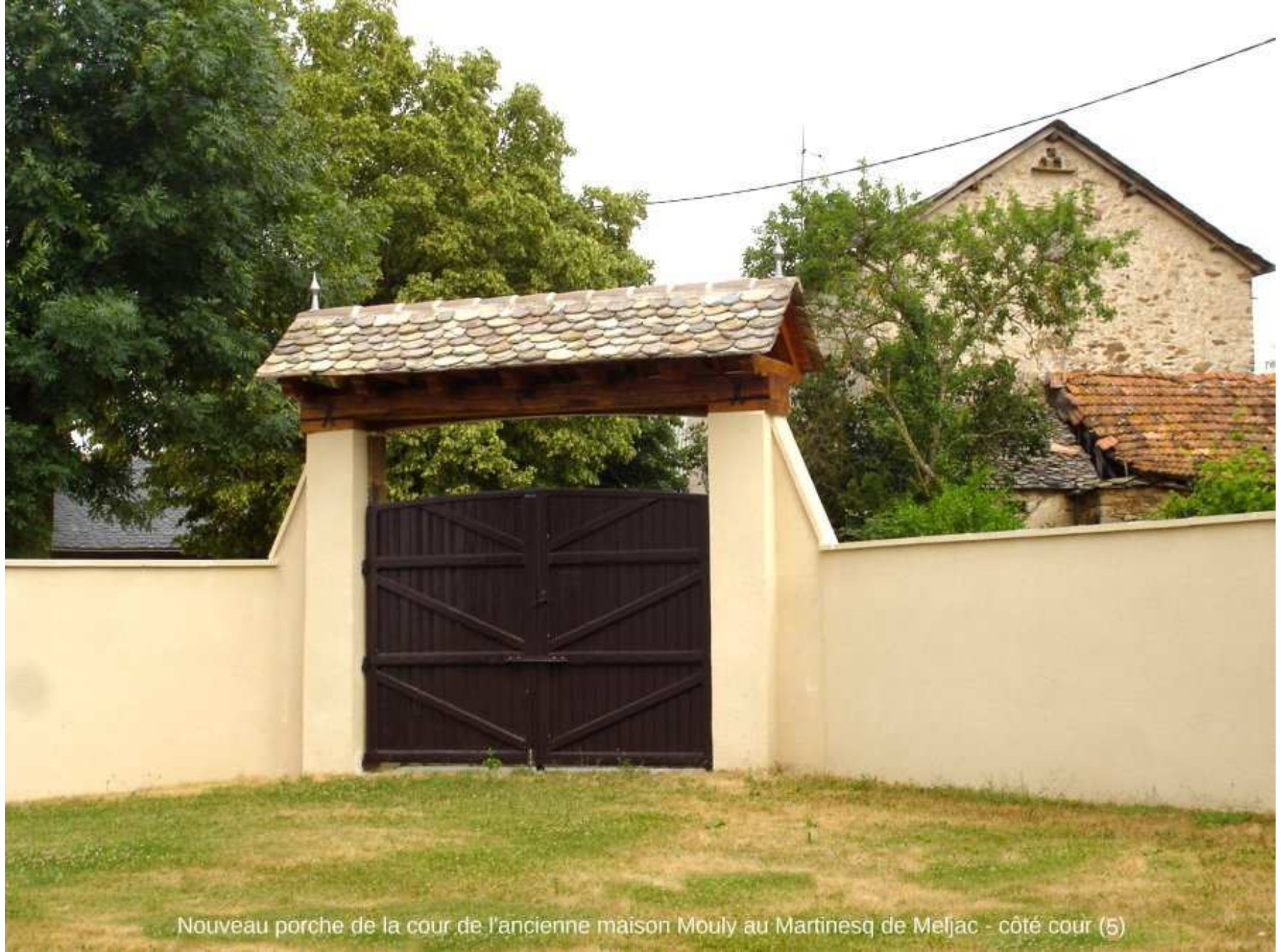
Nouveau porche de la cour de l'ancienne maison Mouly au Martinesq de Meljac - côté cour (5)