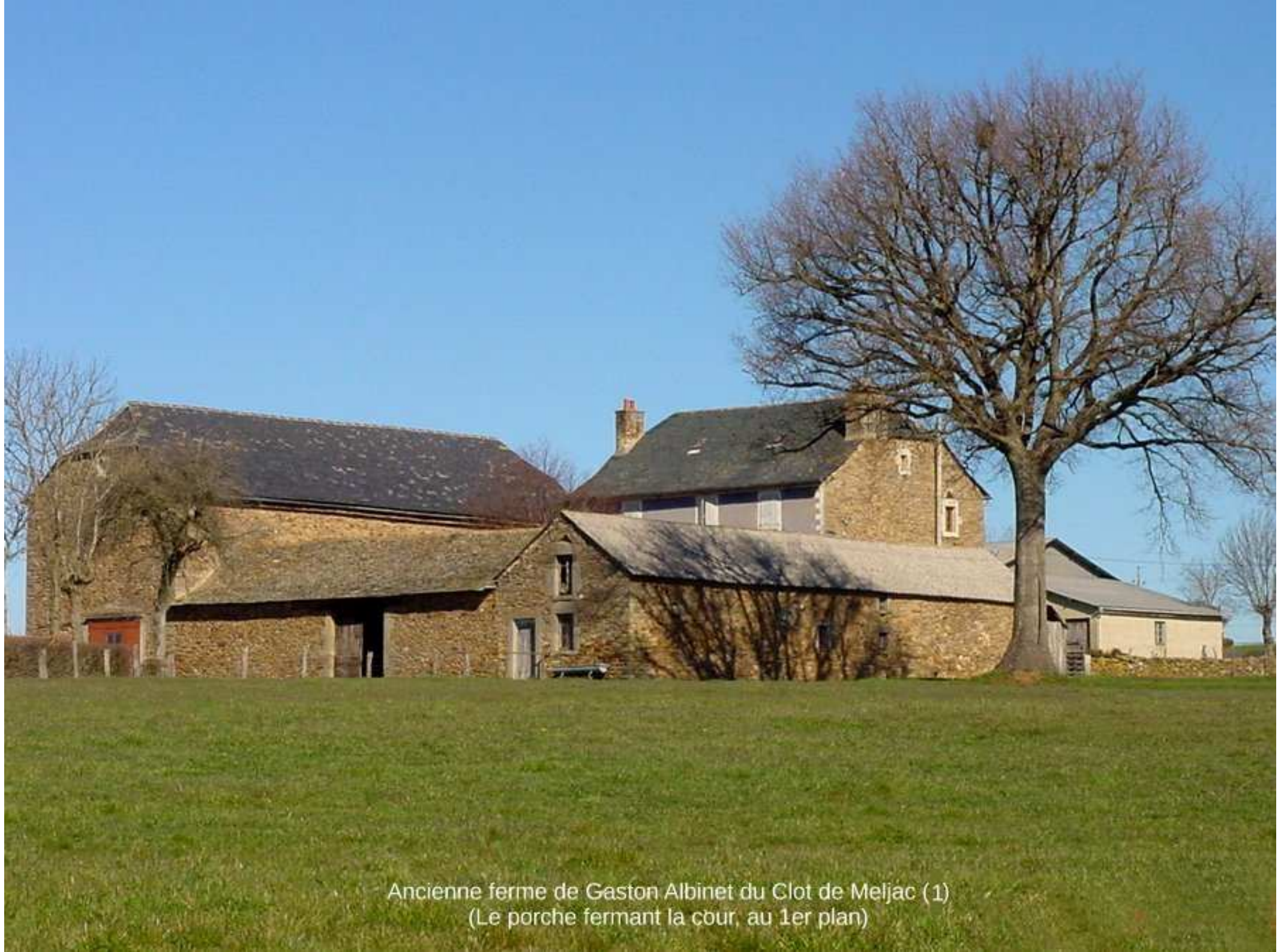
Ancienne ferme de Gaston Albinet du Clot de Meljac (1) (Le porche fermant la cour, au 1er plan)