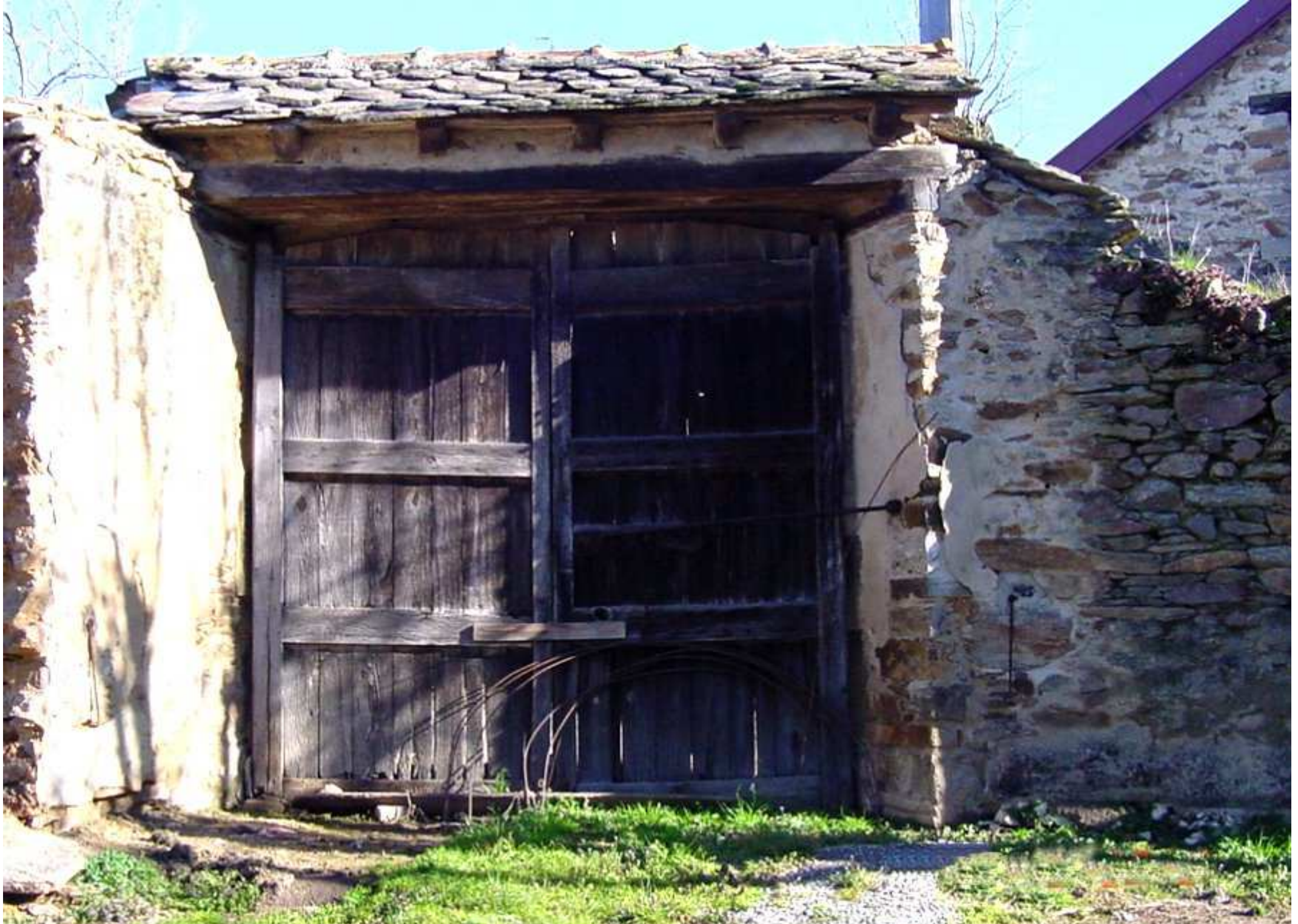
Ancien porche de la cour de l'ancienne maison Mouly au Martinesq de Meijac - côté cour (2)