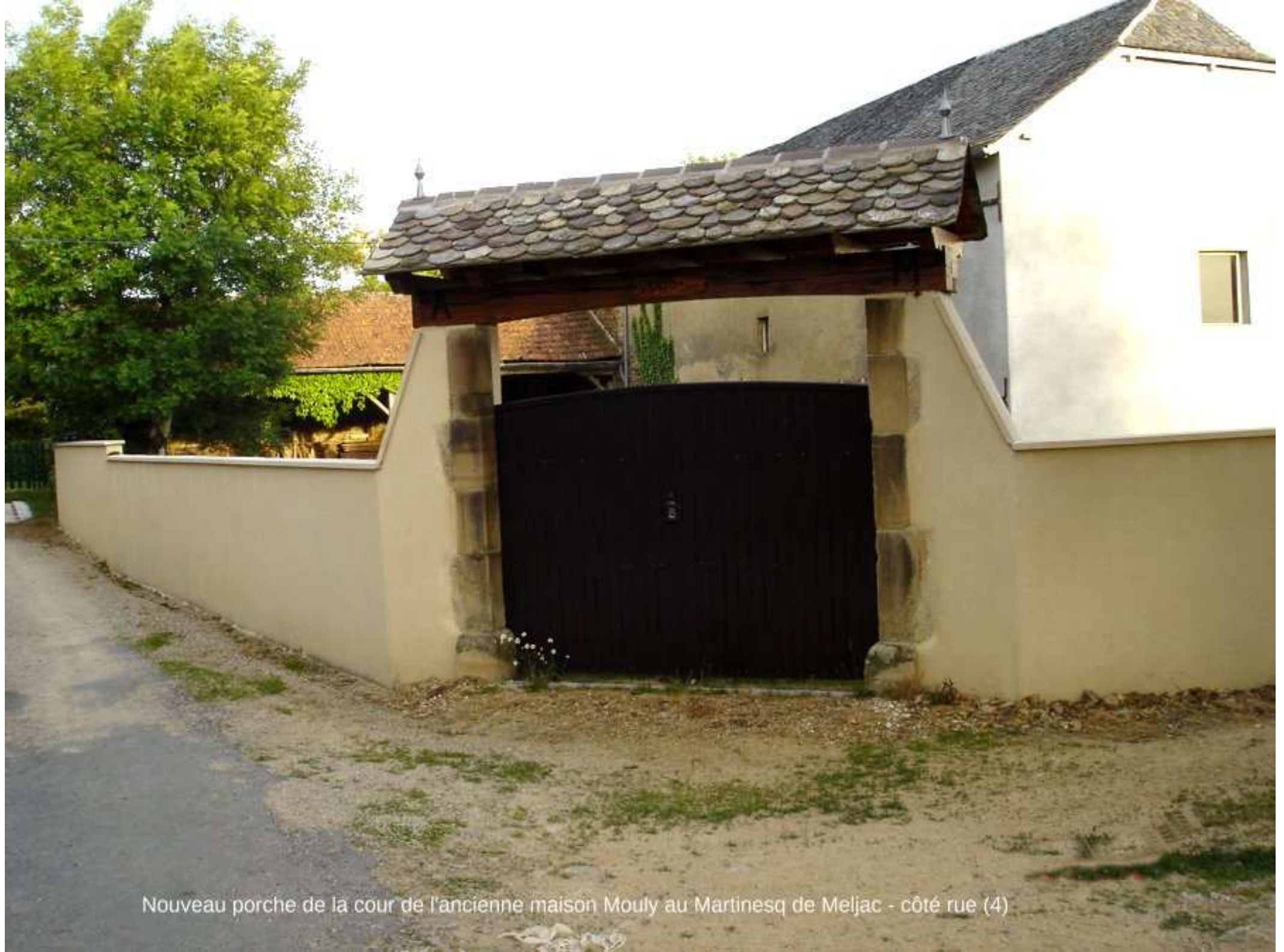
Nouveau porche de la cour de l'ancienne maison Mouly au Martinesq de Meljac - côté rue (4)