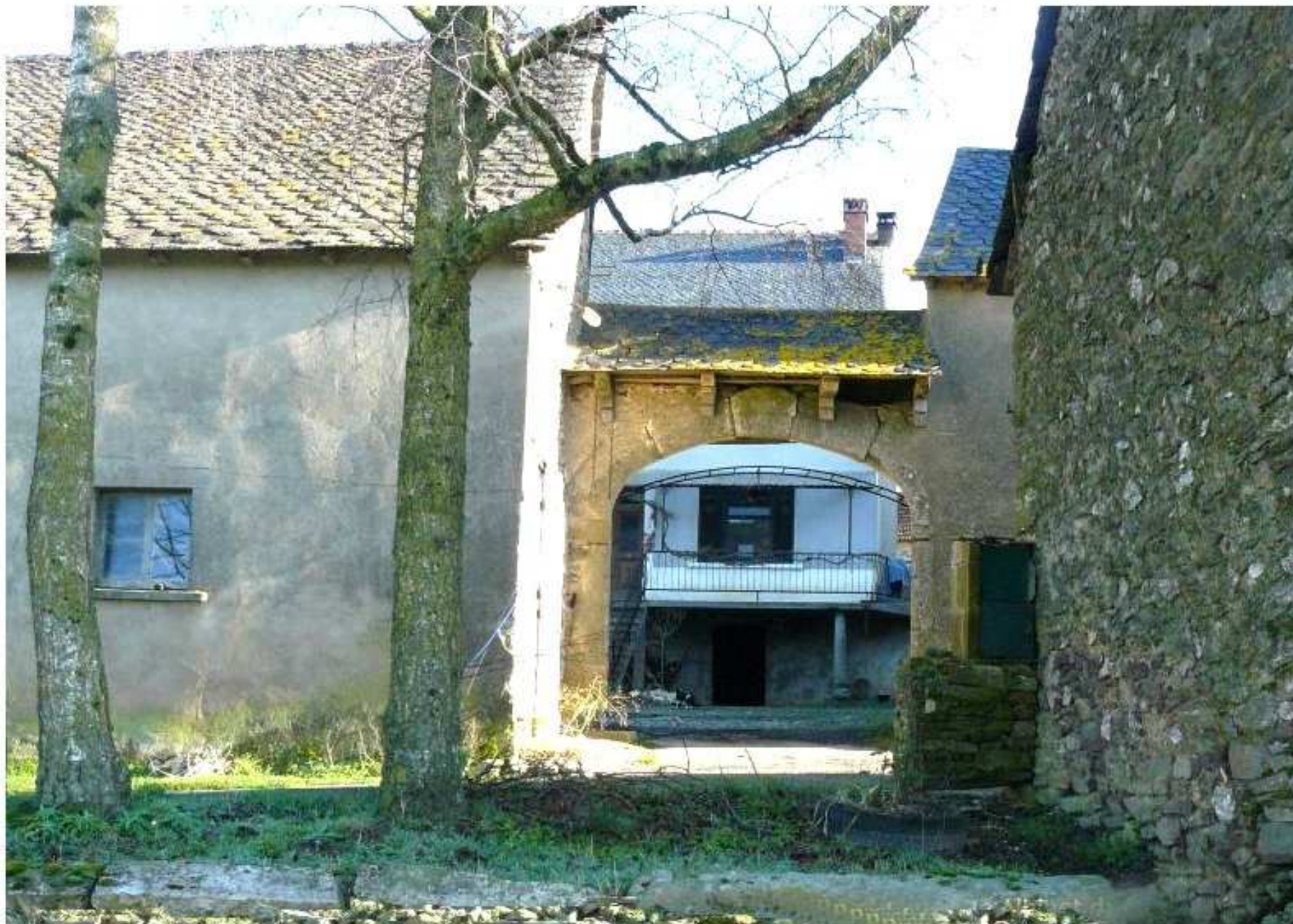
Porche de la ferme Henri Albinet du Puech Issaly de Meljac vue vers l'intérieur de la cour - (2)