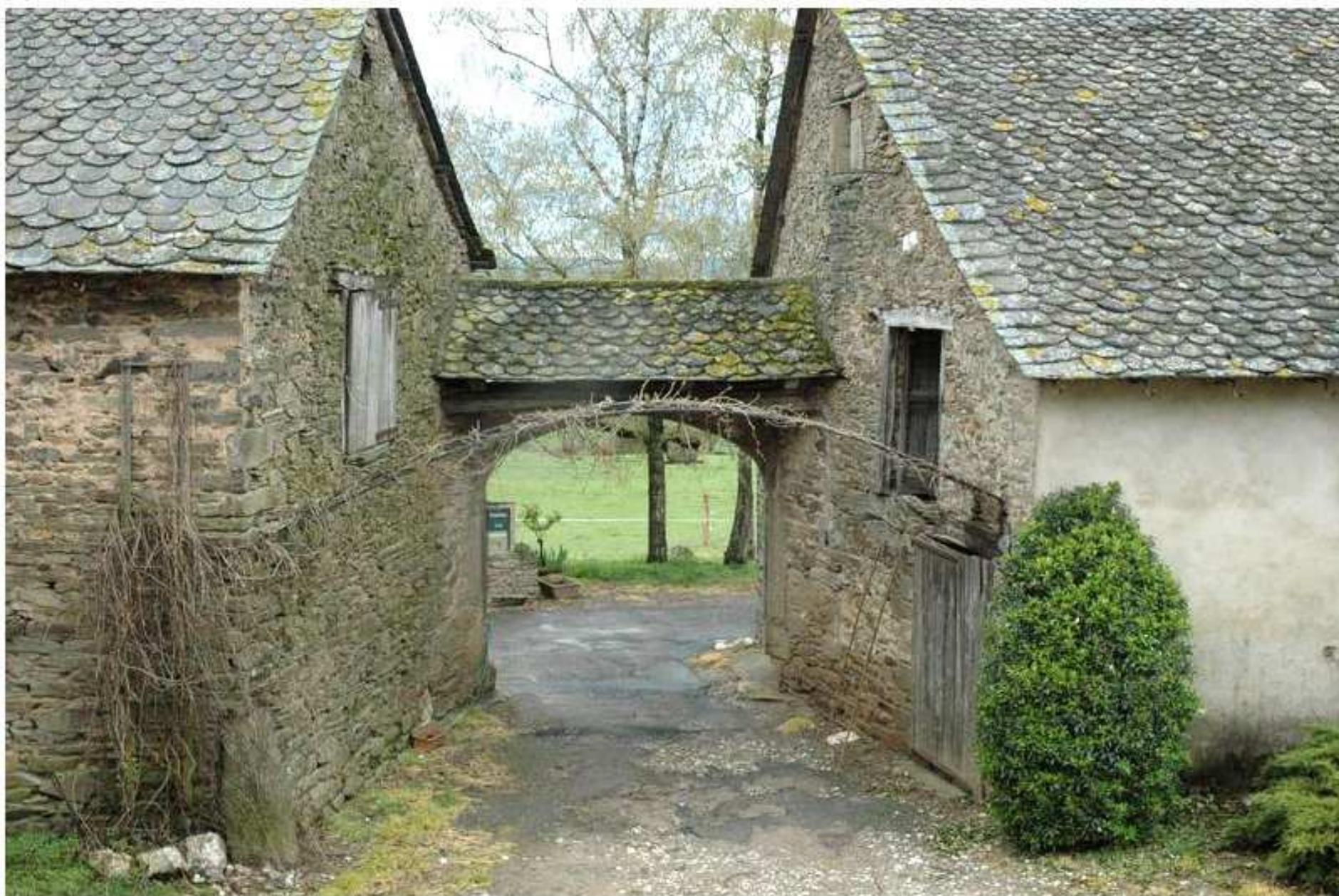
Porche de la ferme Henri Albinet du Puech Issaly de Meljac vue vers l'extérieur de la cour - (1)