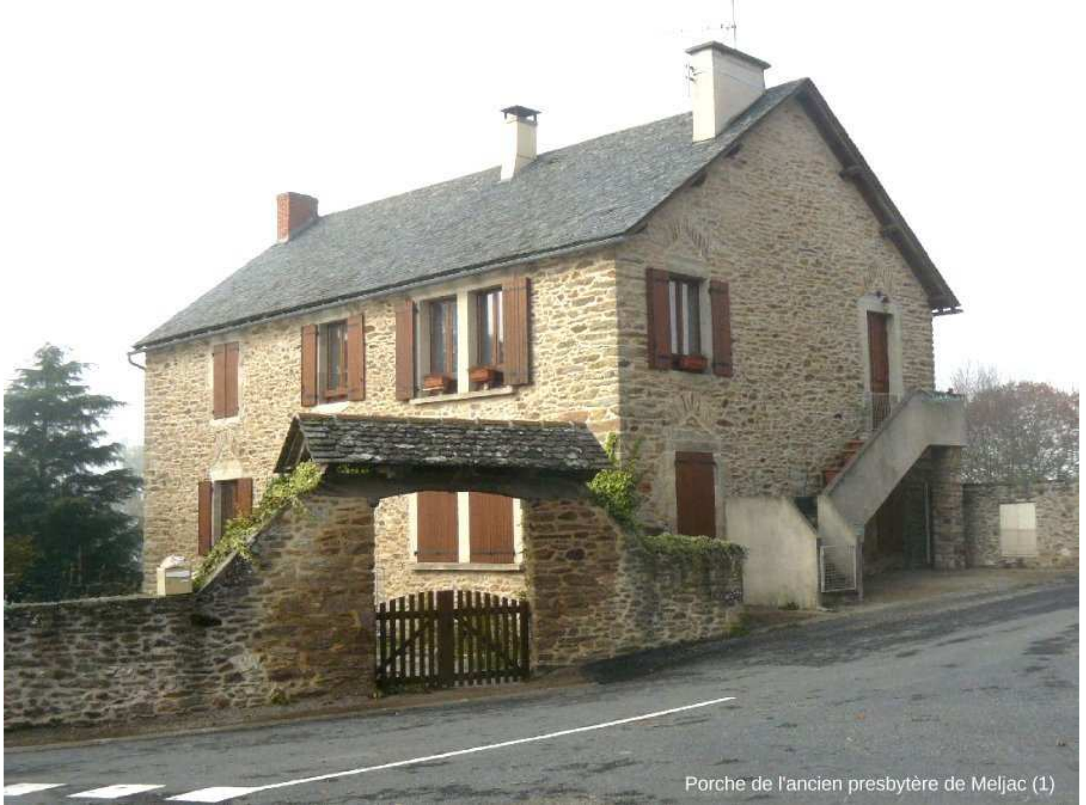
Porche de l'ancien presbytère de Meljac (1)