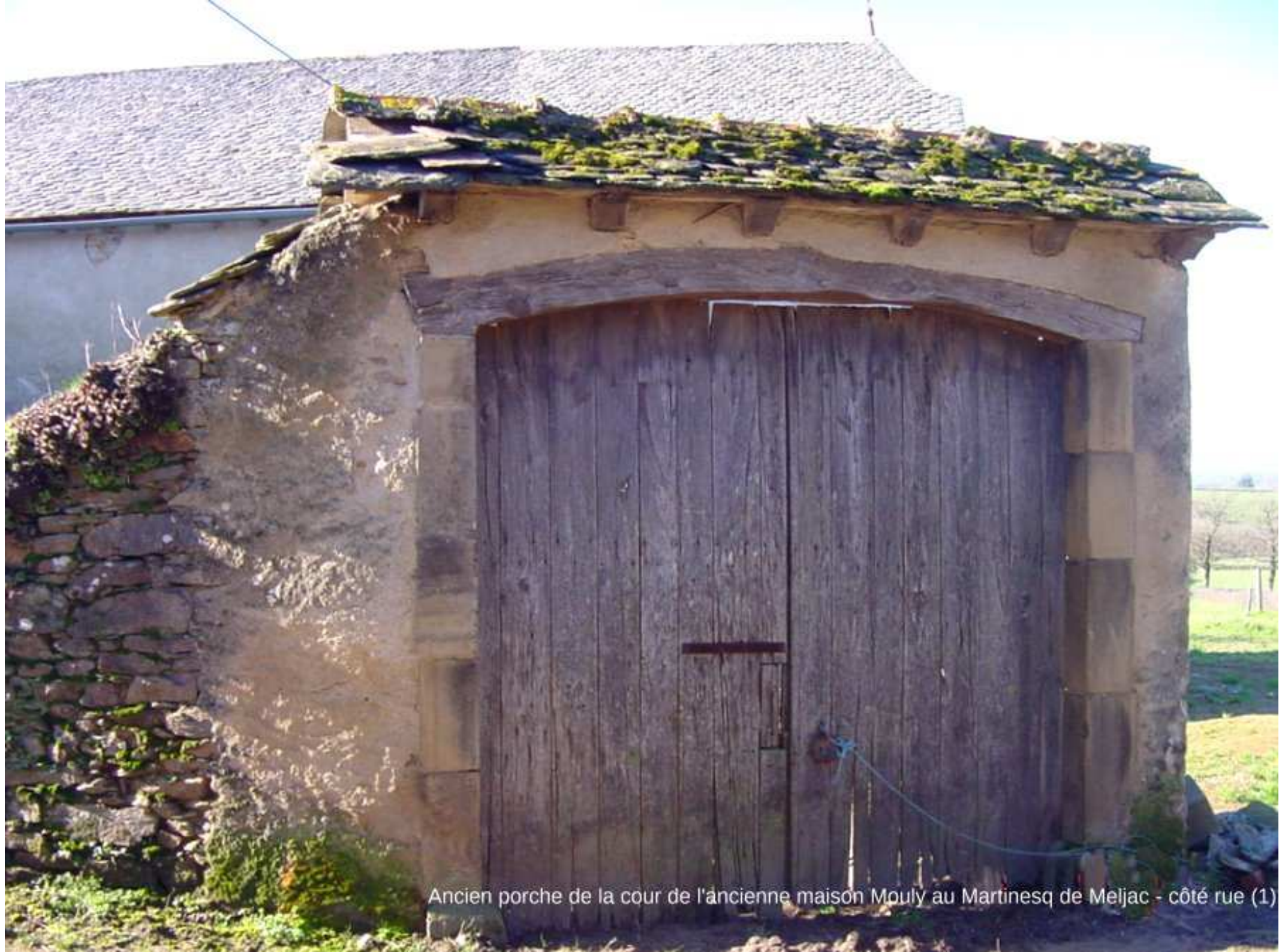
Ancien porche de la cour de l'ancienne maison Mouly au Martinesq de Meljac - côté rue (1)