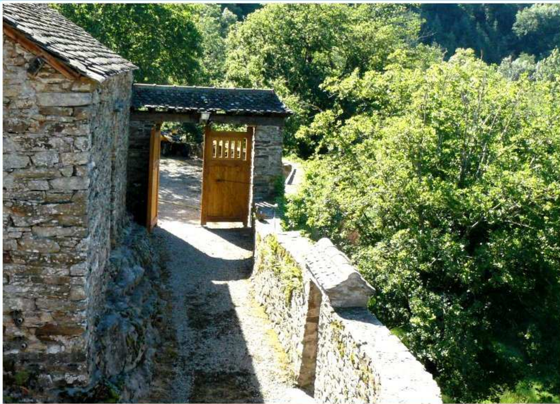
Porche de la Bastide de Jean-Paul Massol - entrée principale vue de l'intérieur de la cour avec sur la droite un petit porche sur porte ouvrant sur le vide (3 )