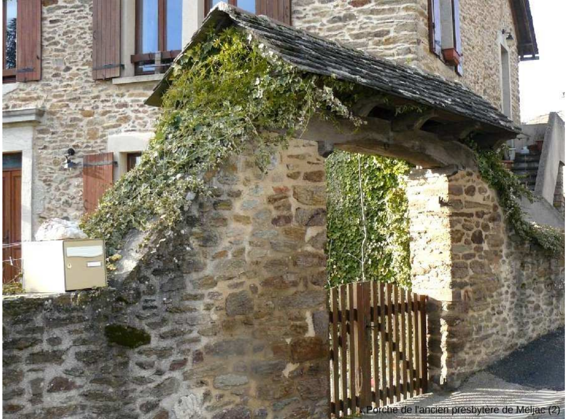
Porche de l'ancien presbytere de Meljac (2)