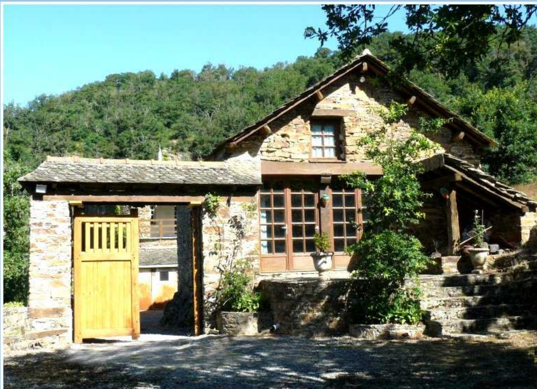
Porche de la Bastide de Jean-Paul Massol - entrée principale côté chemin (1)