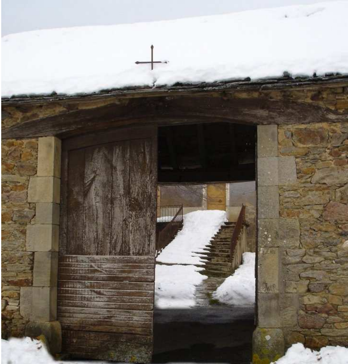
Porche de l'ancienne ferme de Gaston Albinet du Clot de Meljac (3) - 29 janvier 2006