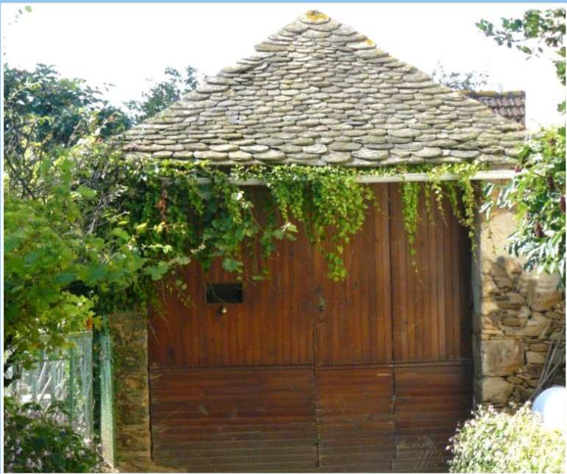
Porche de la cour de la maison de Guy Barthes au Martinesq de Meljac - côté rue