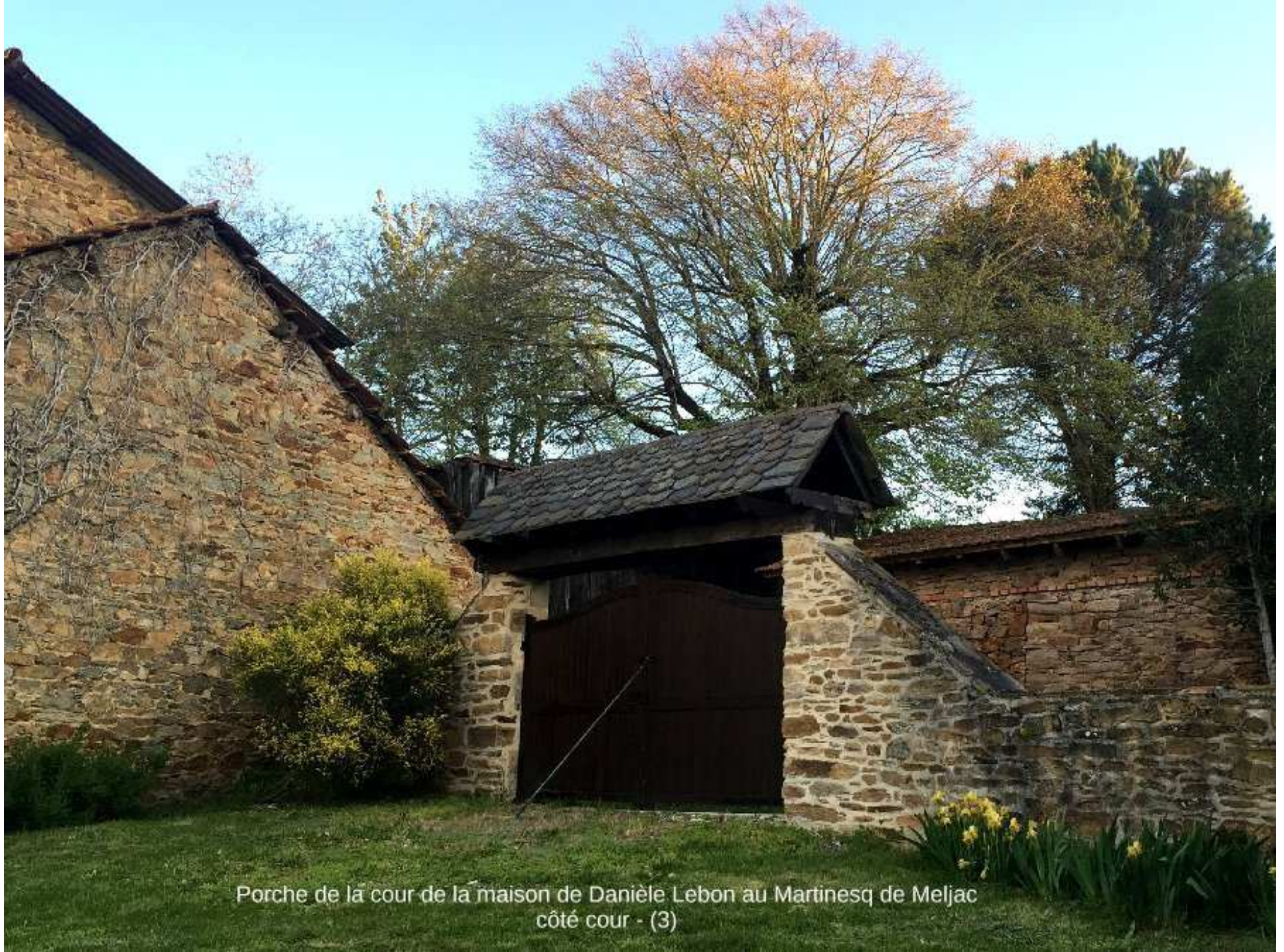
Porche de la cour de la maison de Danièle Lebon au Martinesq de Meljac côté cour - (3)