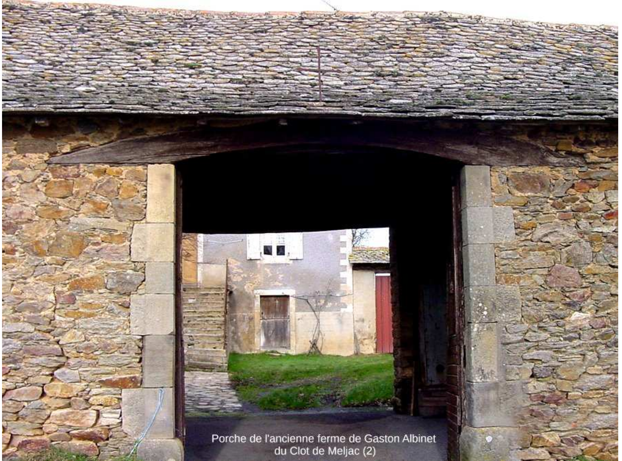
Porche de l'ancienne ferme de Gaston Albinet du Clot de Meljac (2)