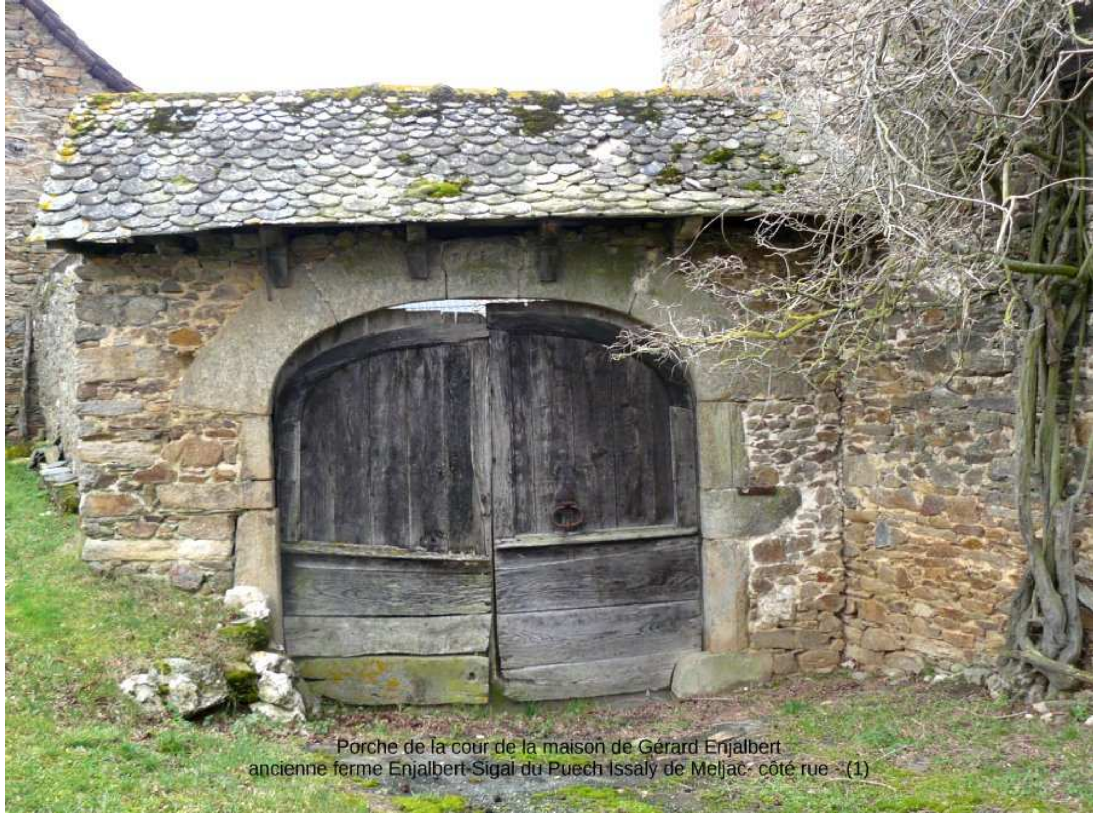
Porche de la cour de la maison de Gérard Enjalbert ancienne ferme Enjalbert-Sigal du Puech Issaly de Meljac - côté rue - (1)