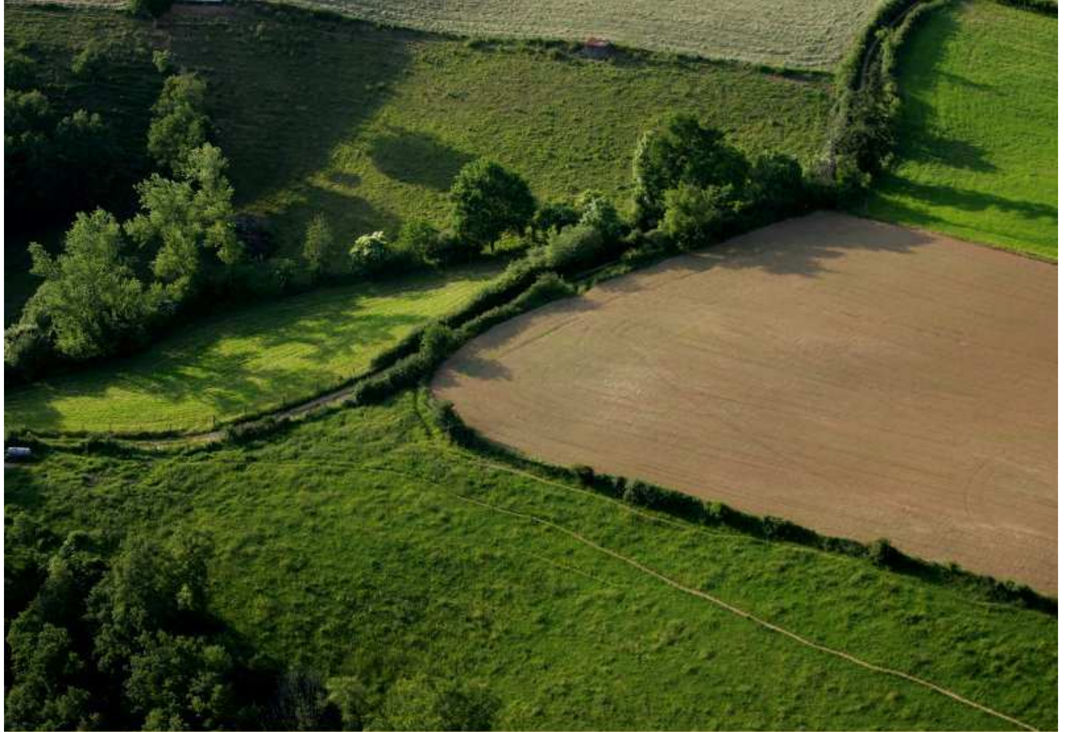
Meljac vu du ciel - à travers champs - Triol - juin 2010