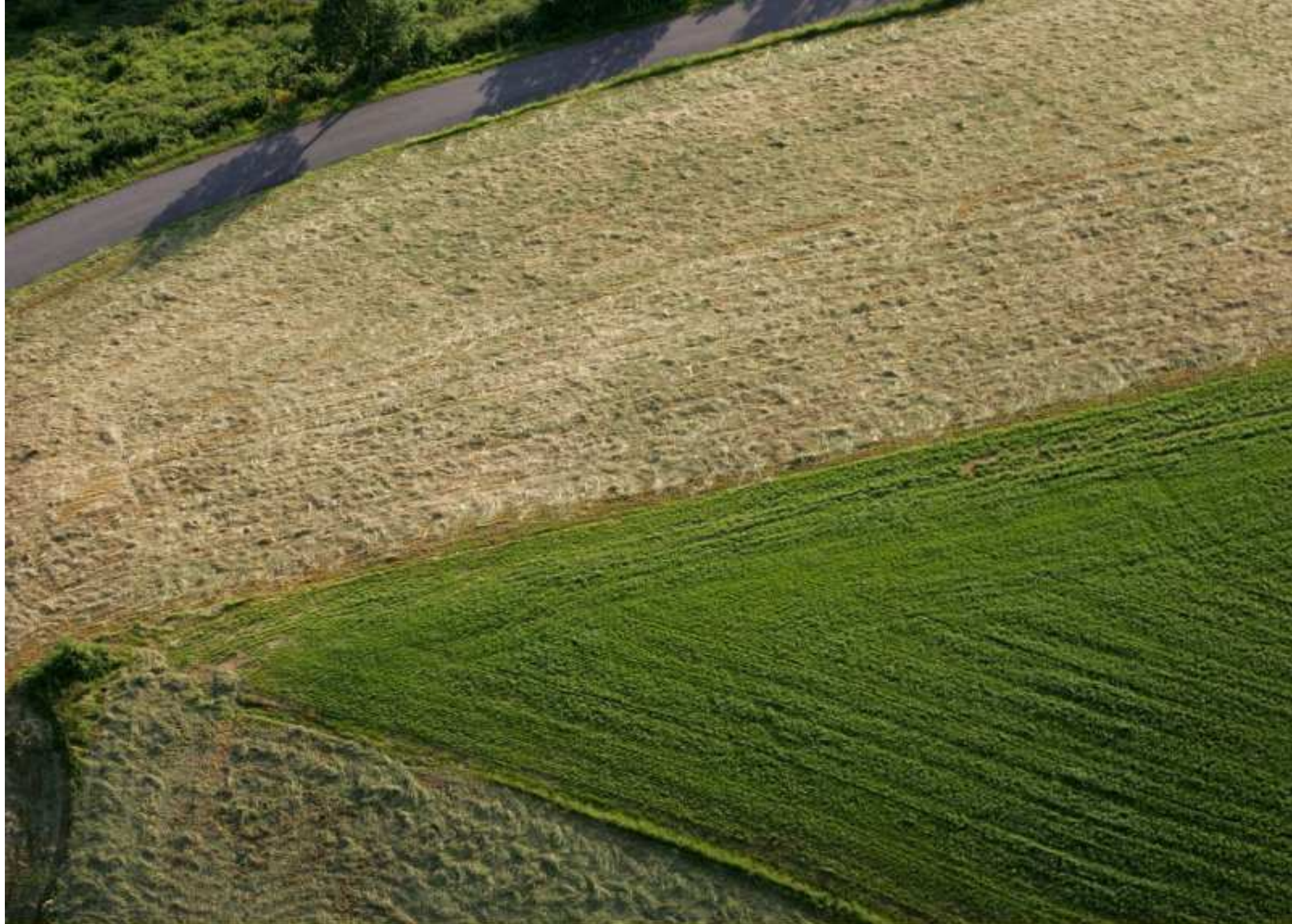
Meljac vu du ciel - à travers champs - au dessus de Triol - juin 2010