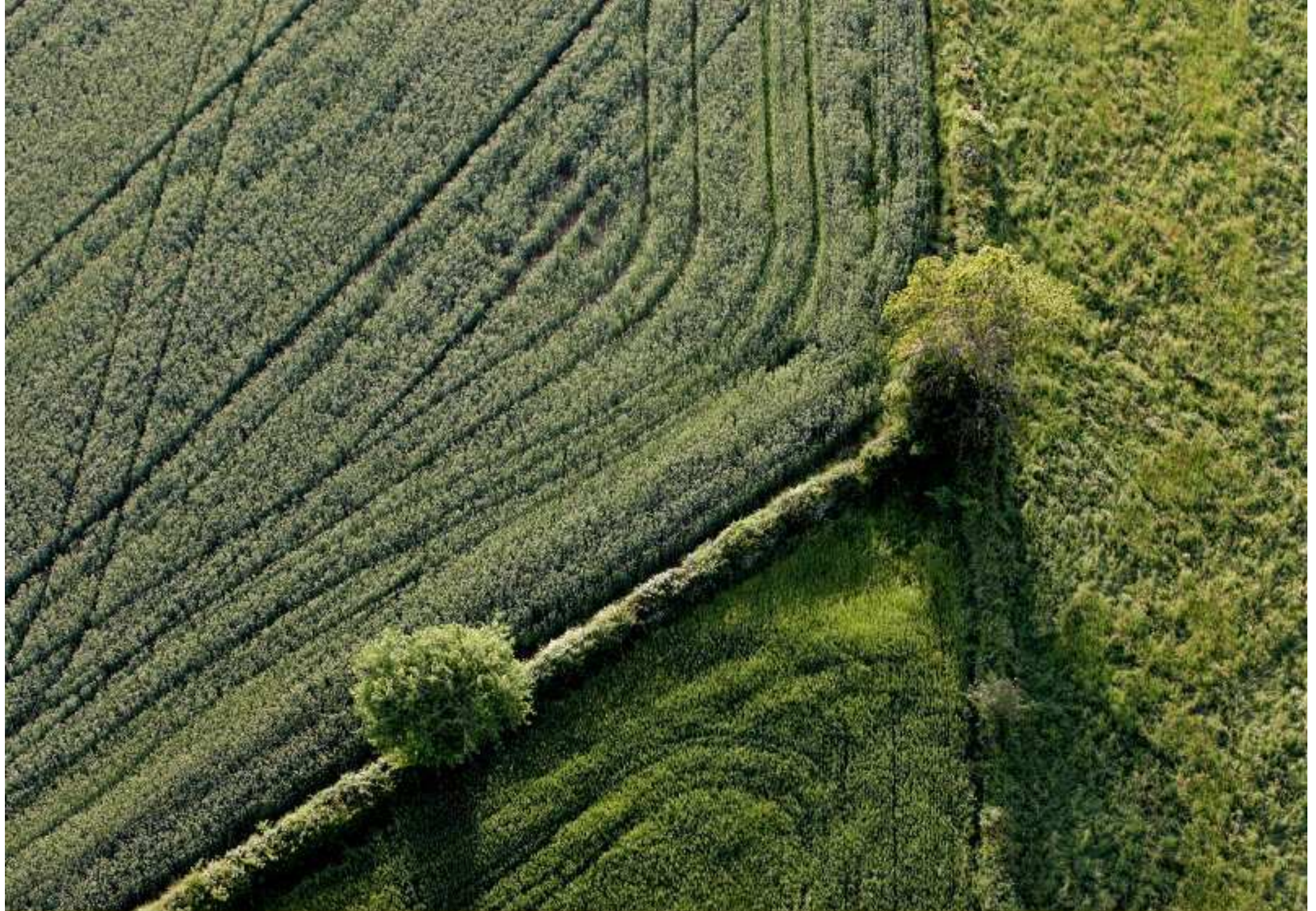
Meljac vu du ciel - à travers champs - juin 2010