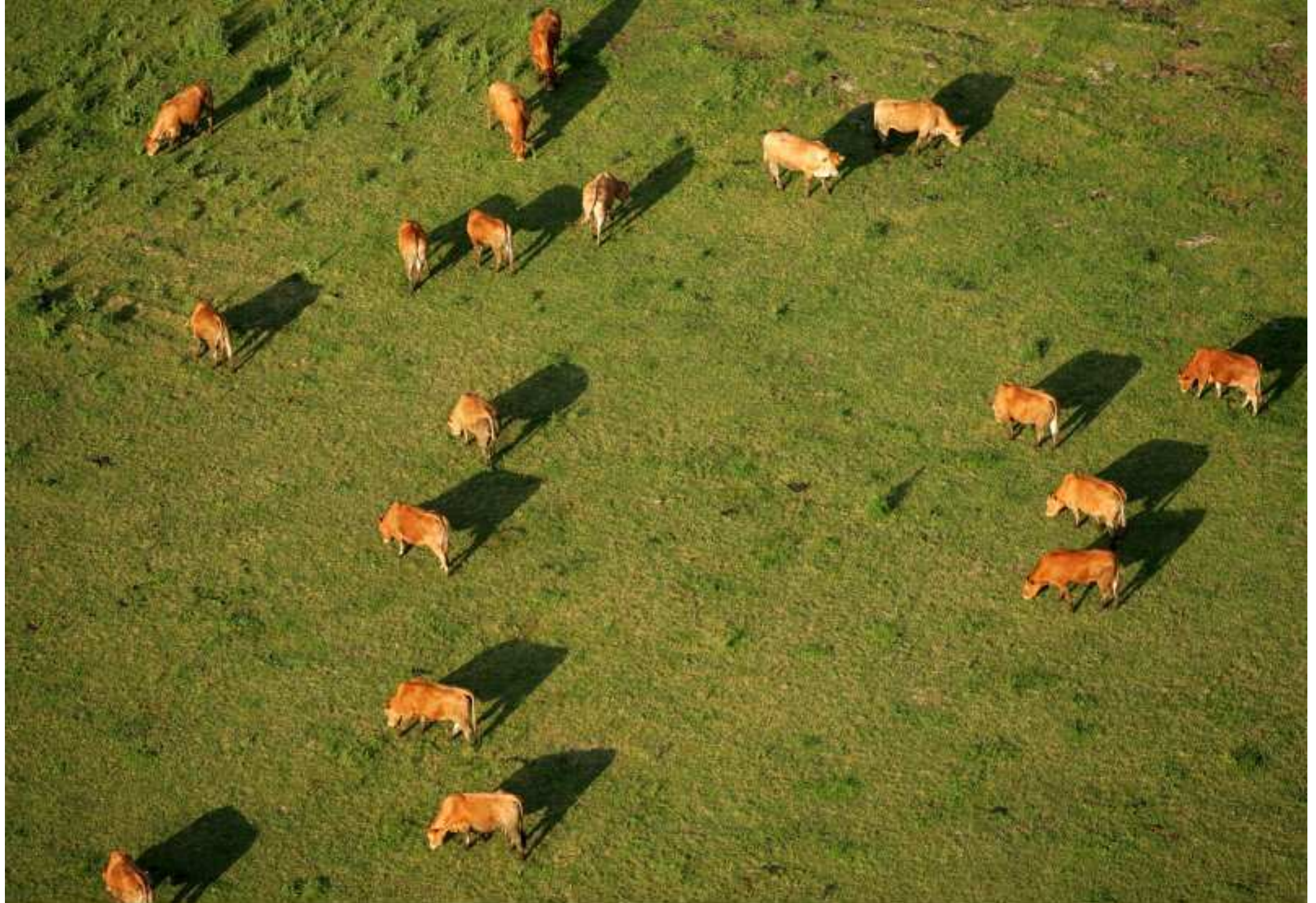
Meljac vu du ciel - à travers champs - survol d'un troupeau à la Bessière - juin 2010