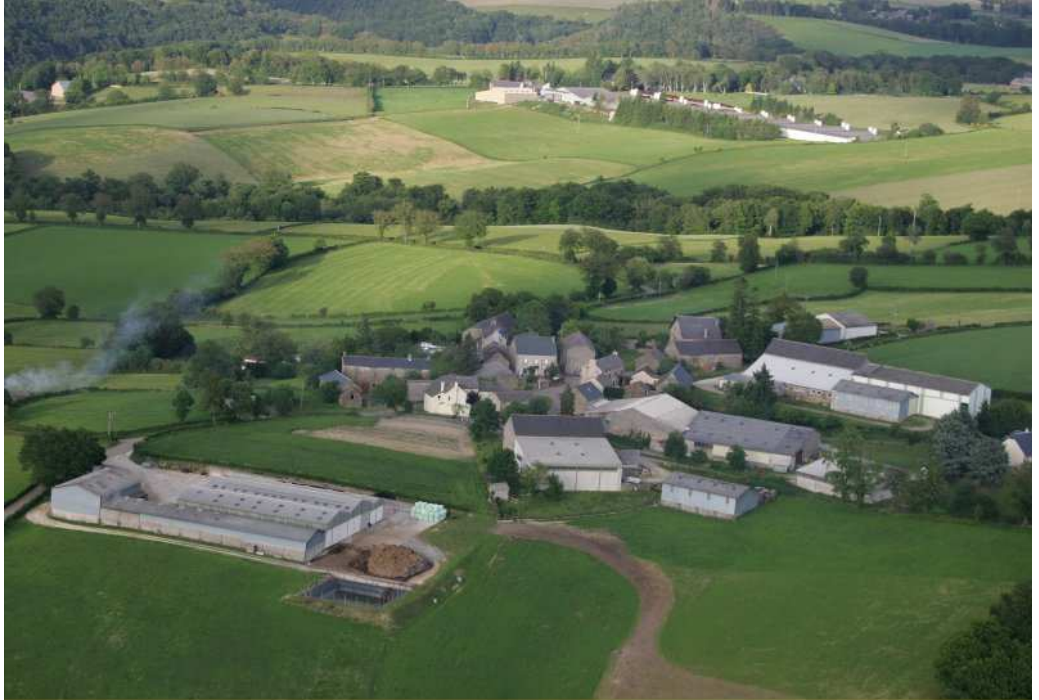
proximité Meljac - vu du ciel - les Hameaux - de Rouffrenac (1er plan) à Parisot (2ème plan) - juin 2010