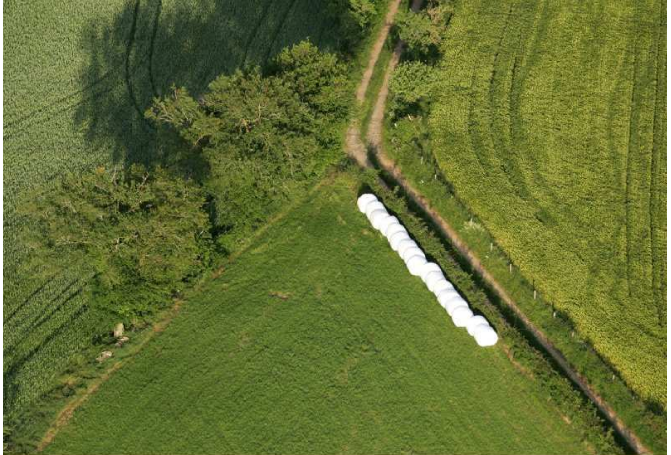
Meljac vu du ciel - à travers champs - juin 2010