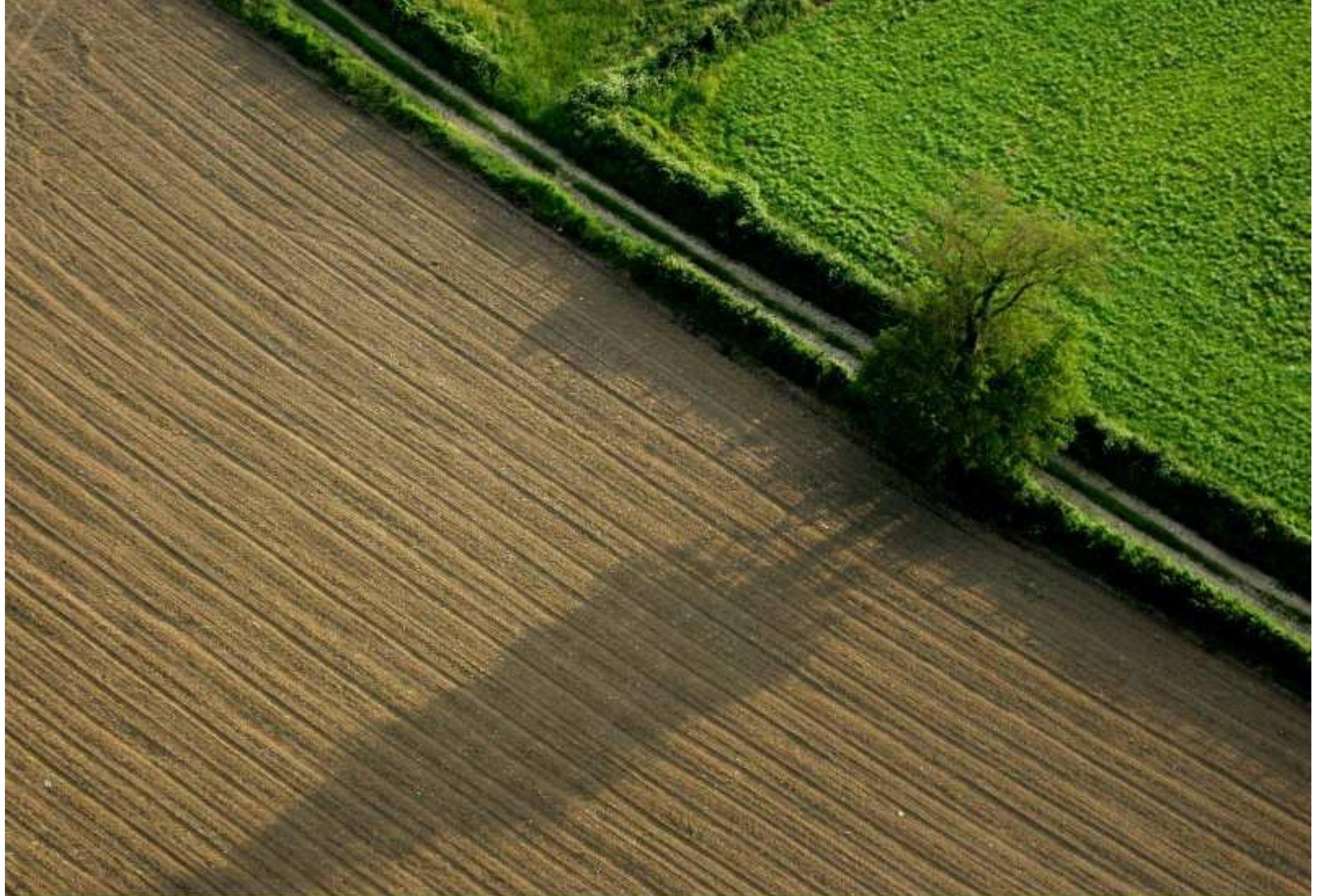
Meljac vu du ciel - à travers champs - juin 2010