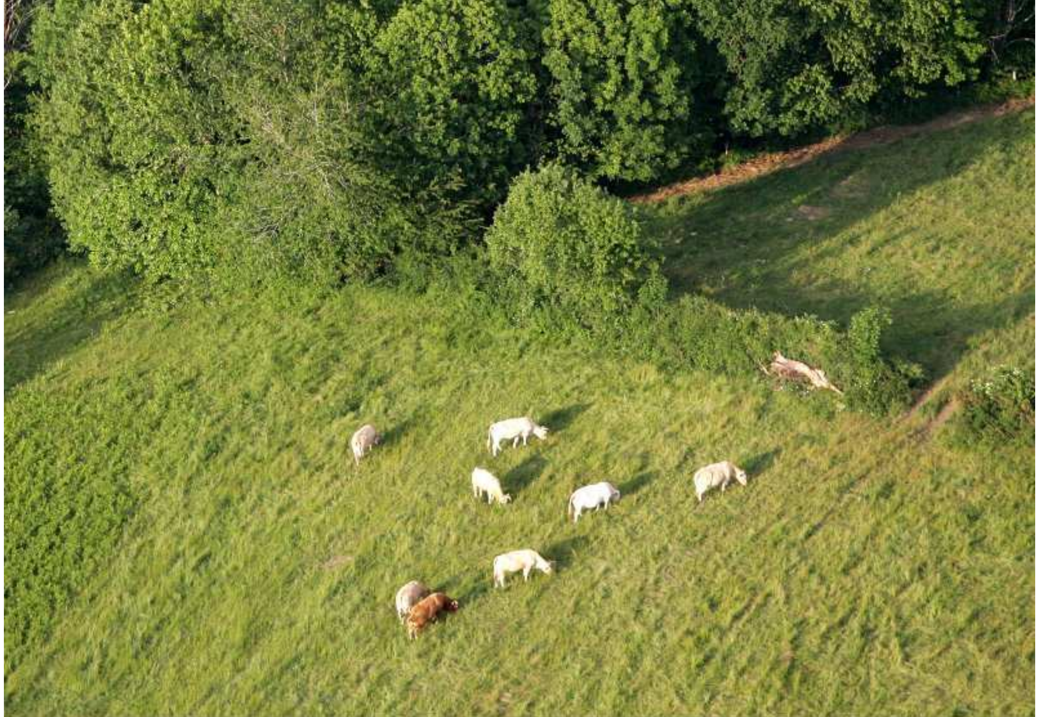
Meljac vu du ciel - à travers champs, des vaches de Guy Loubière du Mas Ricard - juin 2010