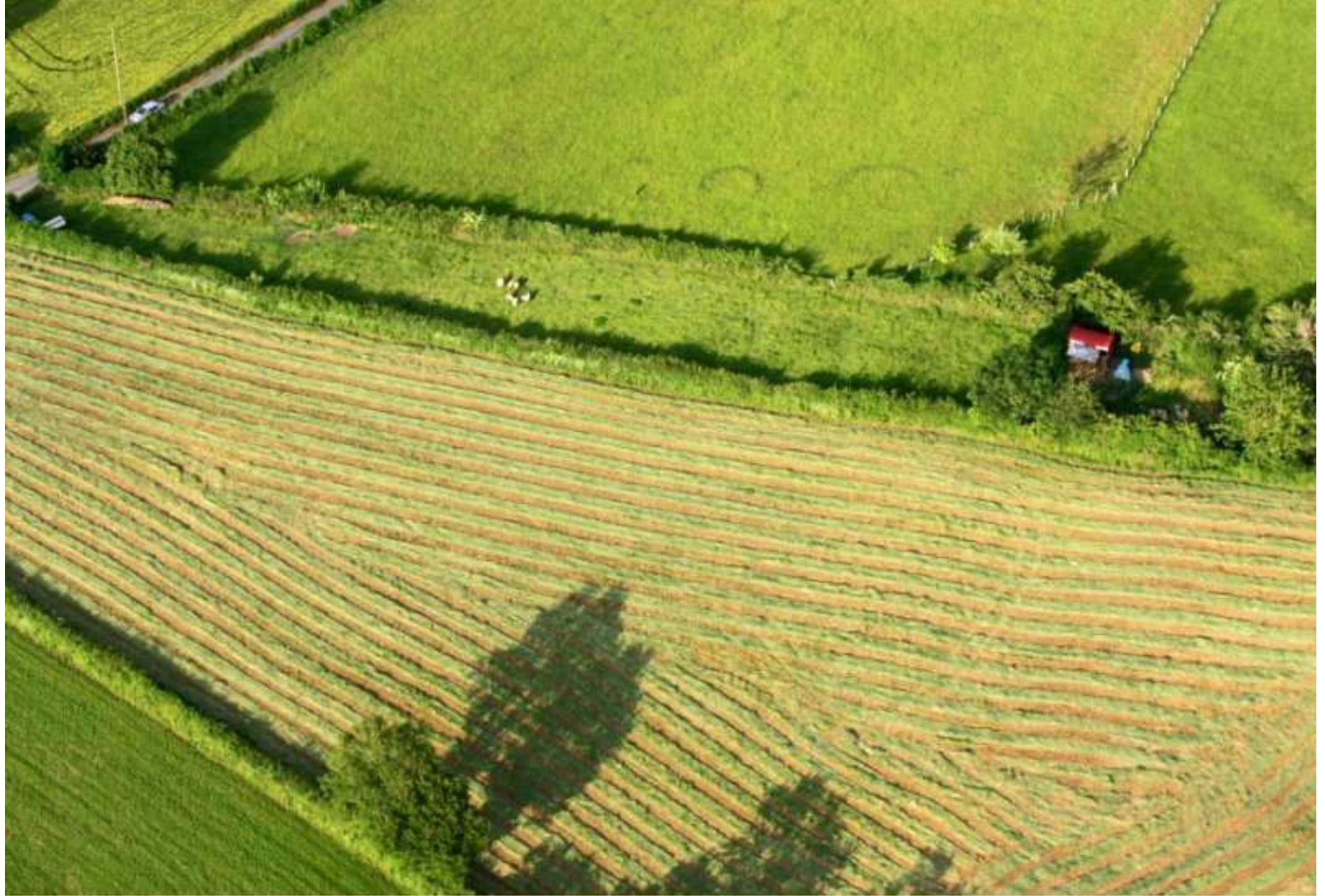
Meljac vu du ciel - à travers champs vers Cabrol, les brebis de Gérard Deleuze - juin 2010