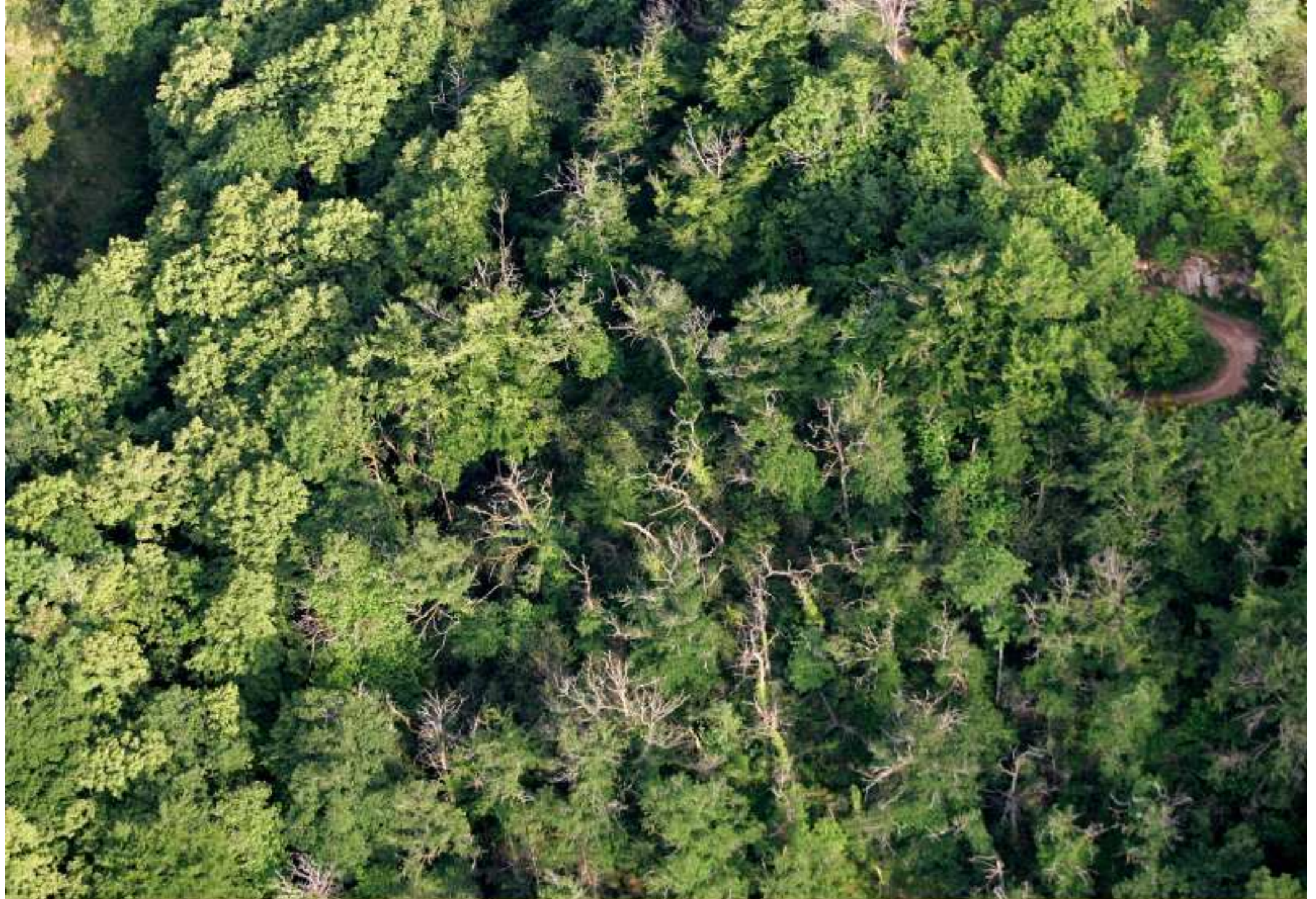
Meljac vu du ciel - à travers champs - au dessus des bois du Batut - juin 2010 (à droite sur la photo le chemin qui conduit à l'ancienne "usine Delaure")