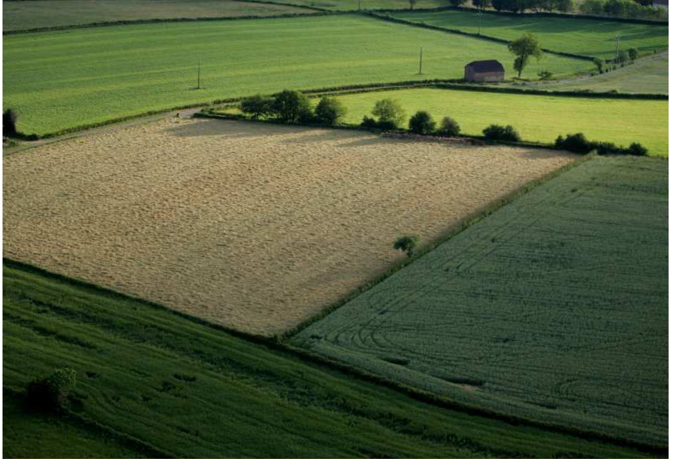
Meljac vu du ciel - à travers champs - le Puech de Bonal (le long de la D592) - juin 2010