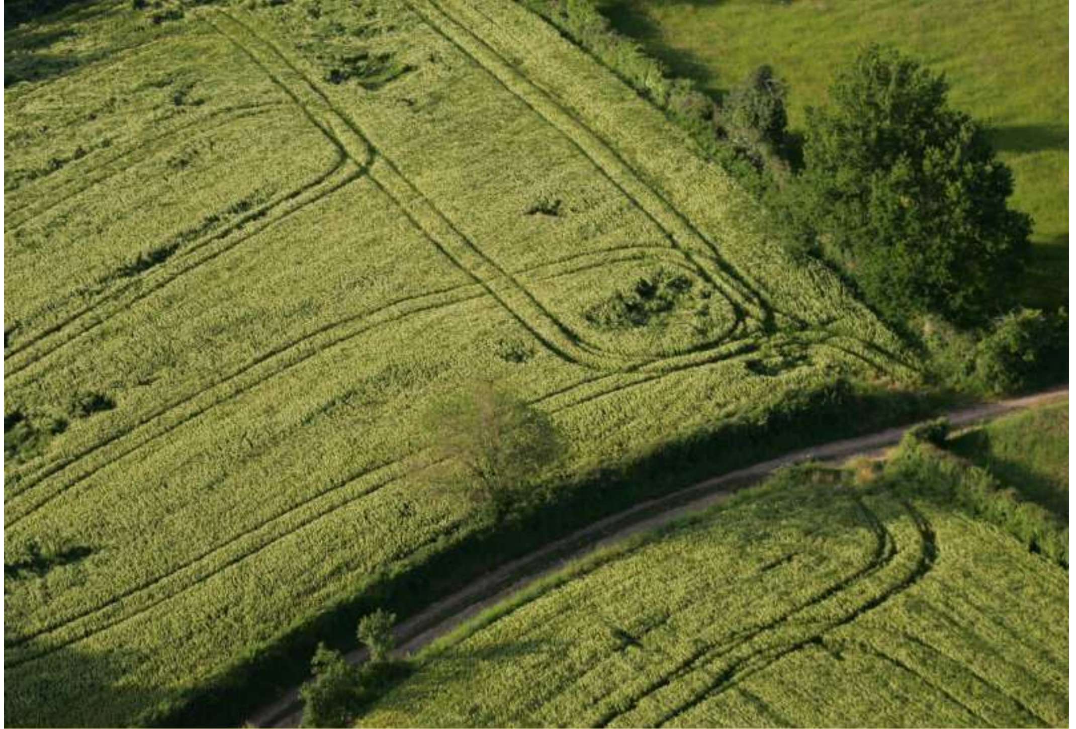
Meljac vu du ciel - à travers champs - juin 2010