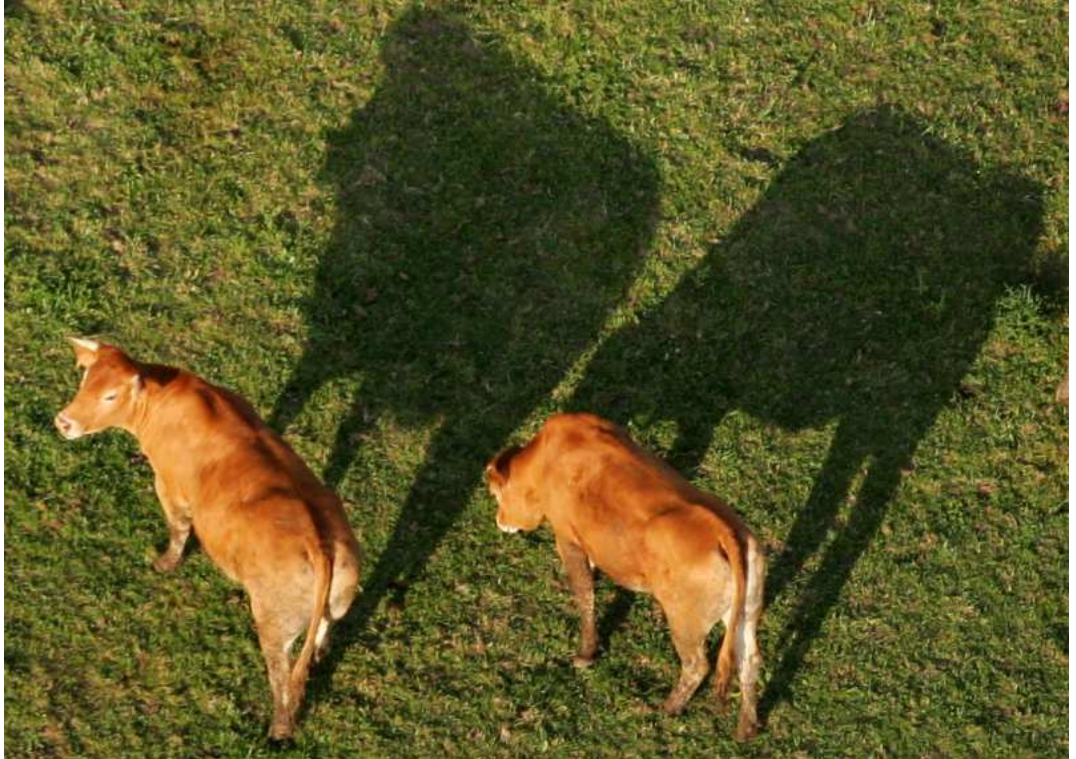
Meljac vu du ciel - à travers champs à la Bessière - juin 2010