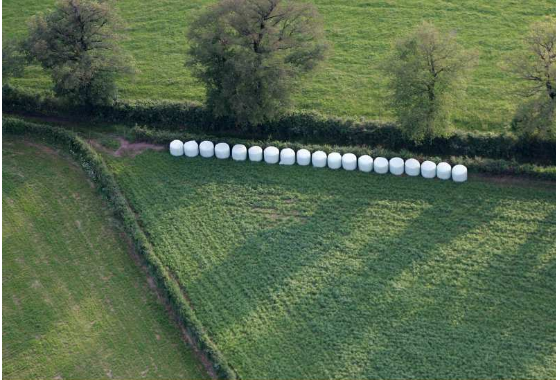
Meljac vu du ciel - à travers champs - juin 2010