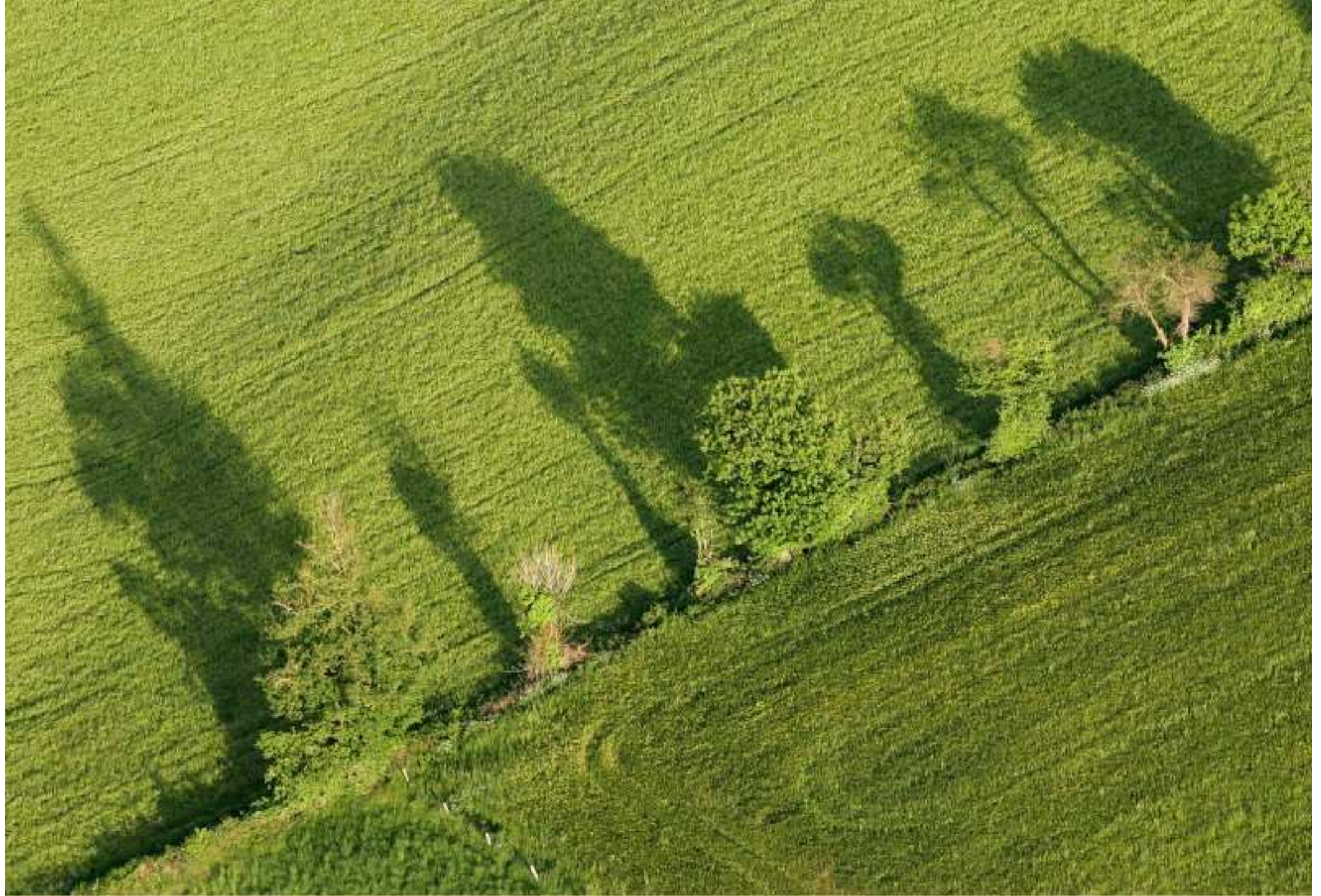
Meljac vu du ciel - à travers champs - juin 2010