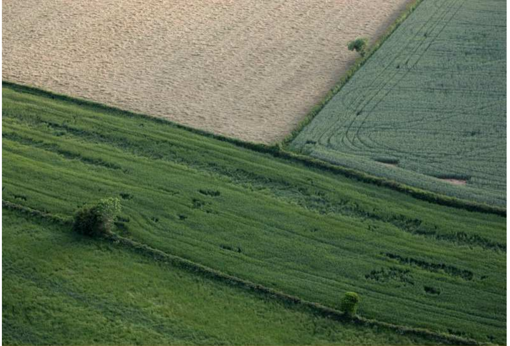
Meljac vu du ciel - à travers champs - juin 2010