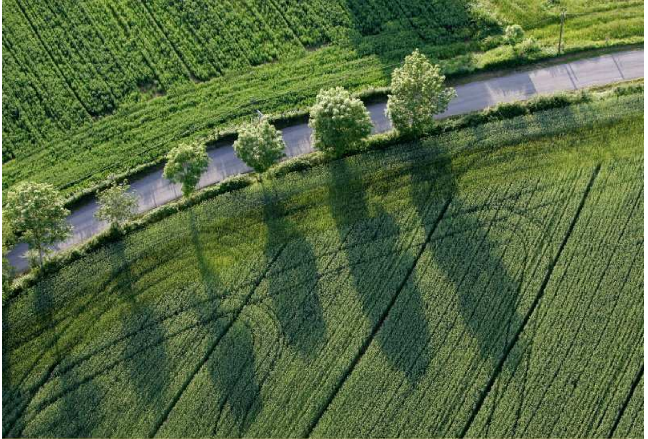
Meljac vu du ciel - à travers champs - juin 2010