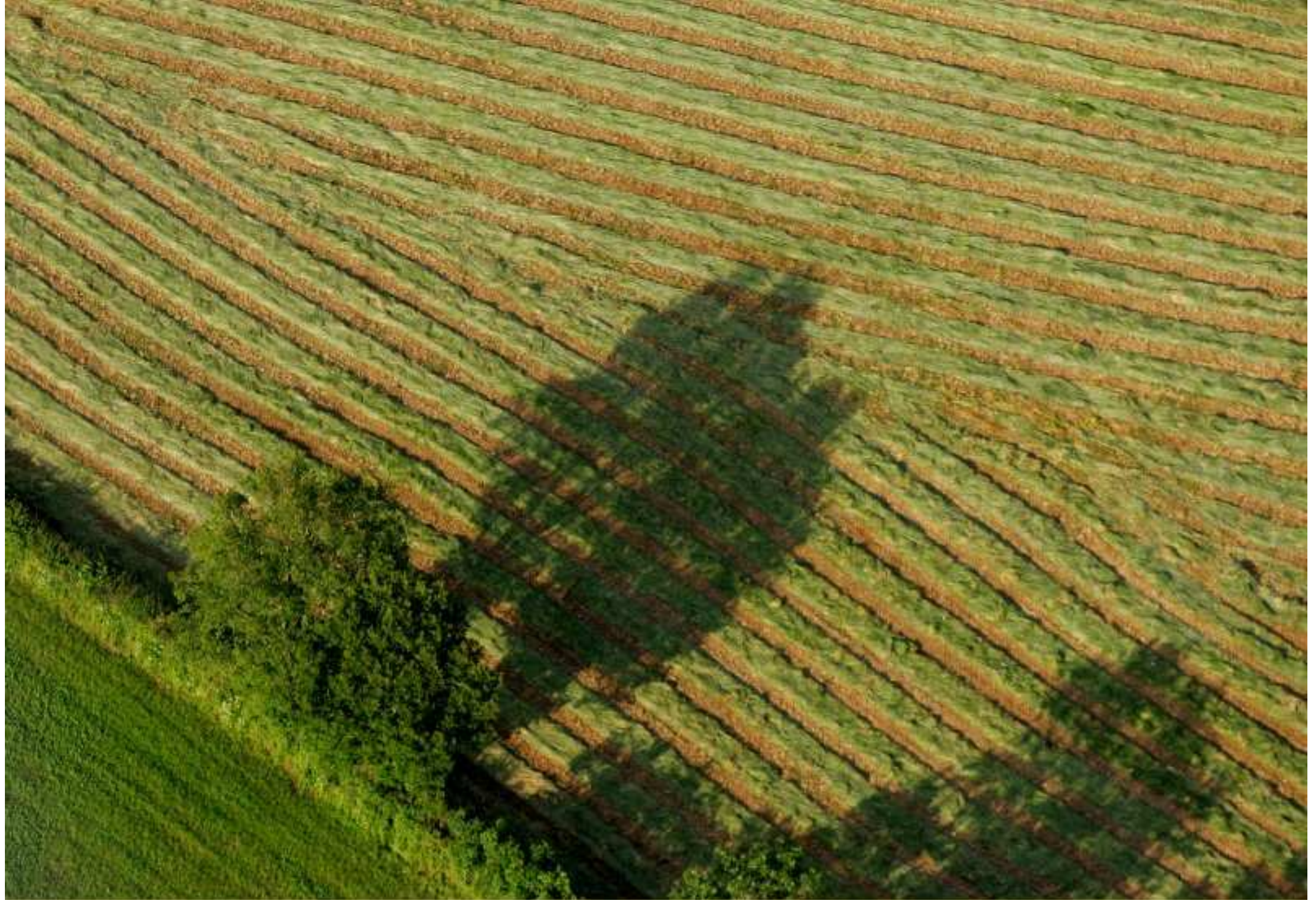
Meljac vu du ciel - à travers champs - au Clot - juin 2010