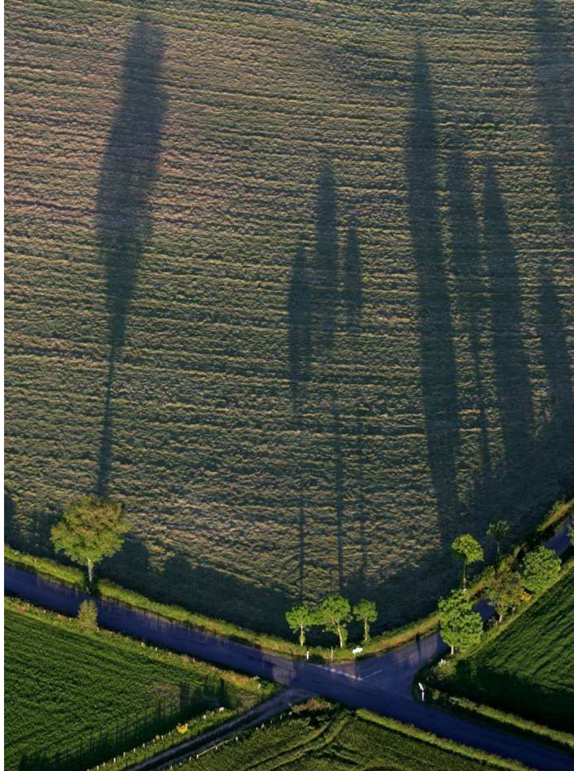
Meljac vu du ciel - à travers champs - juin 2010