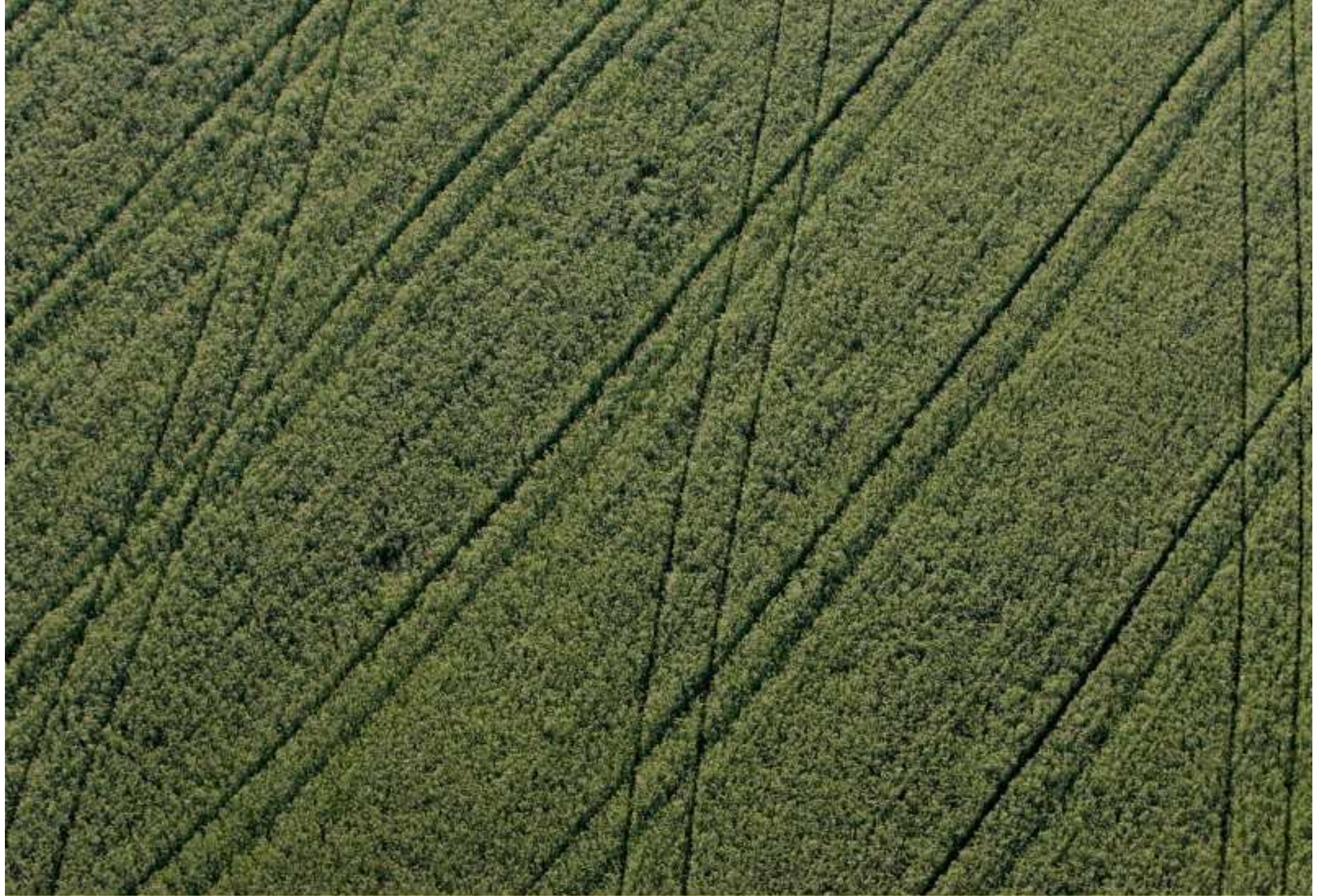
Meljac vu du ciel - à travers champs - juin 2010