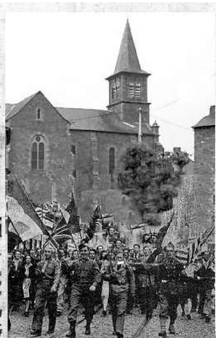
A Meljac, la victoire est fêtée... p.3