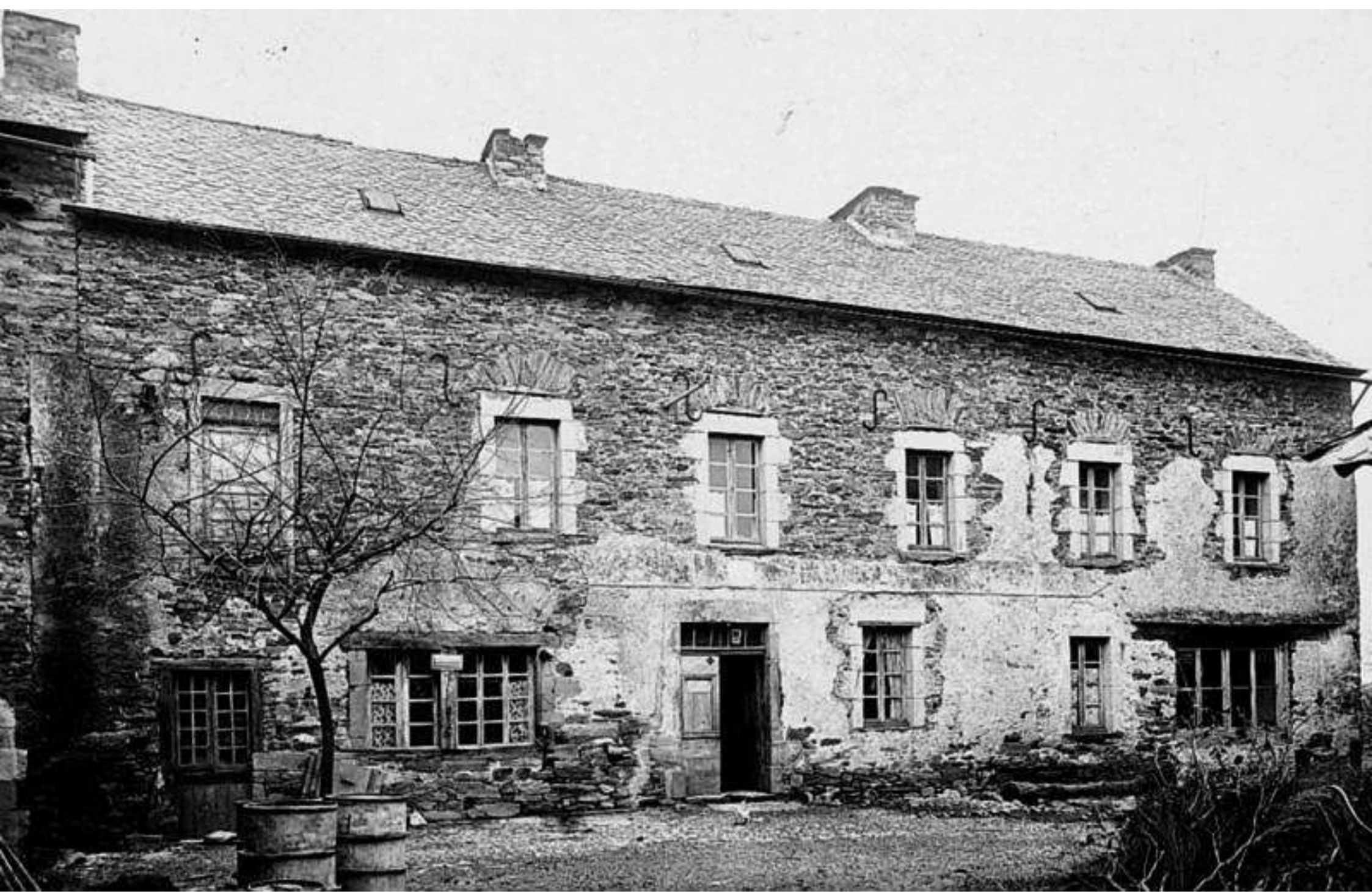
café - épicerie Bousquet à Meljac (photo 1937)