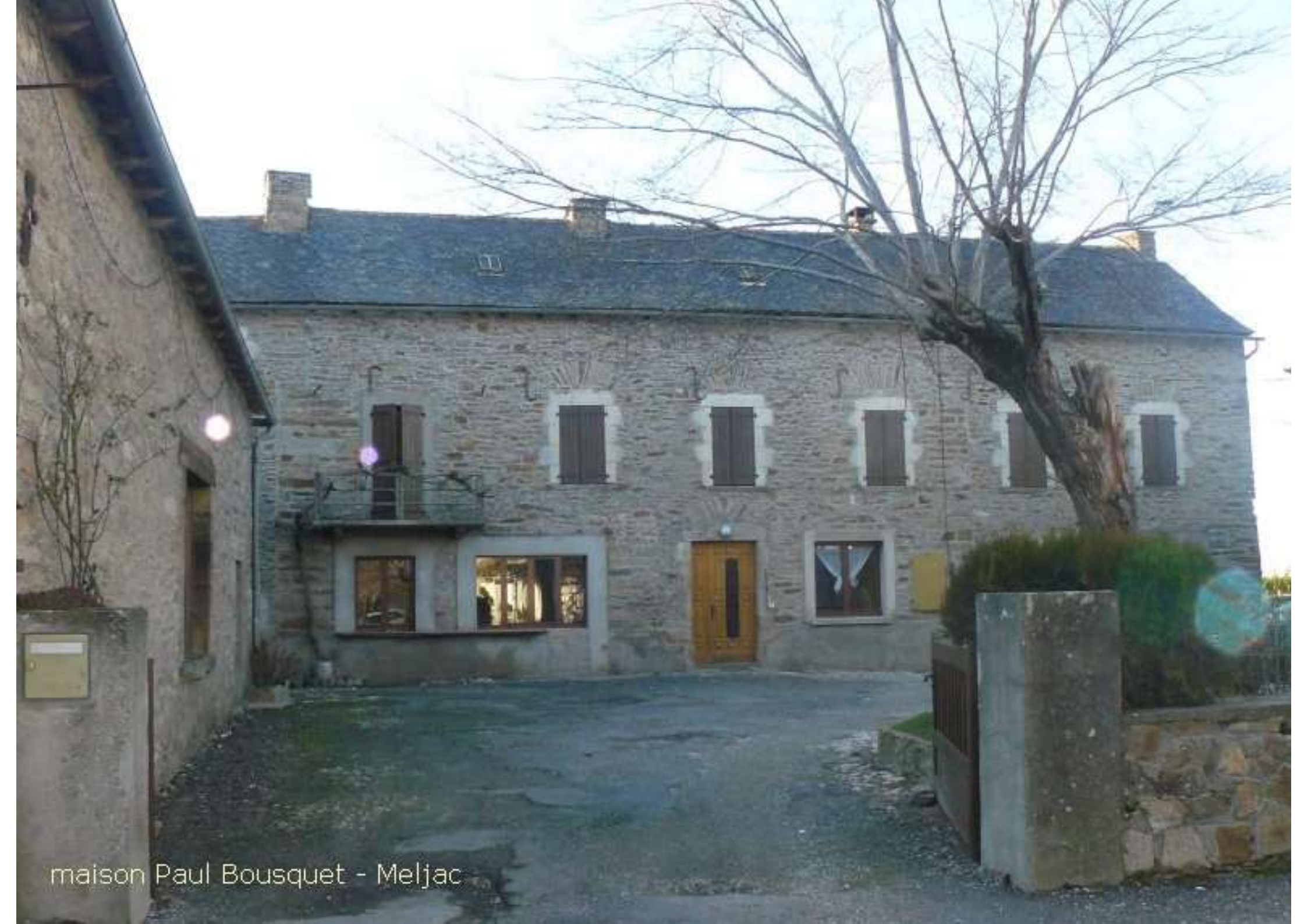
maison Paul Bousquet - Meljac