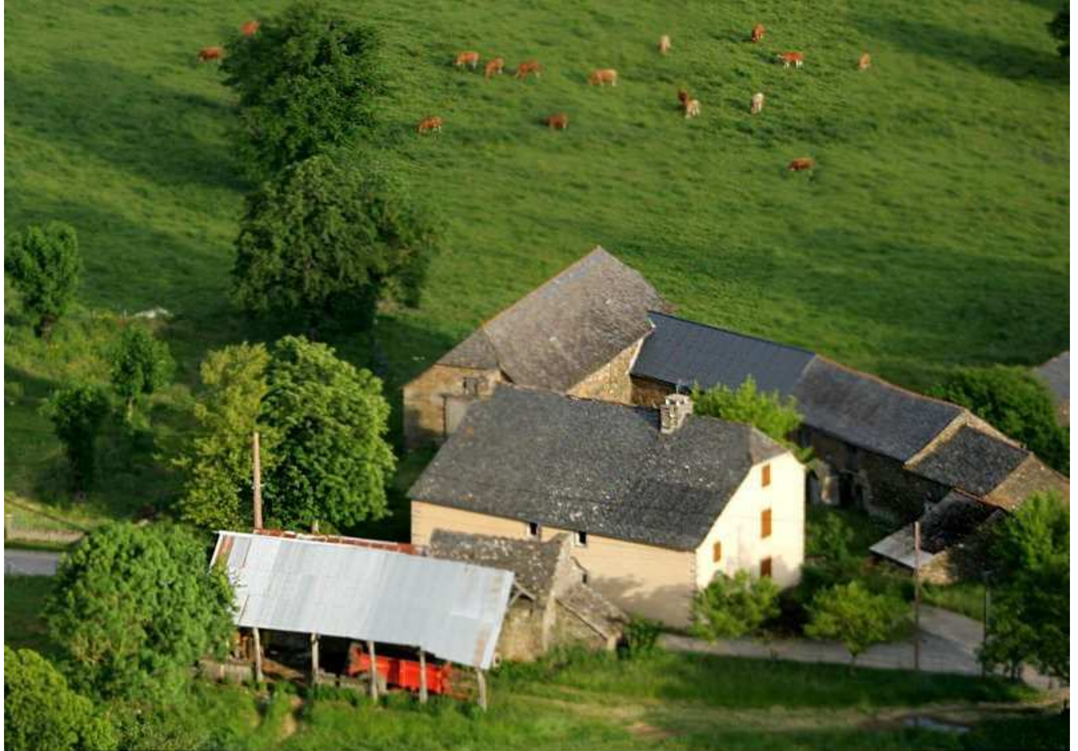
Meljac vu du ciel - les Hameaux - ferme Gérard Enjalbert au Puech Issaly - juin 2010