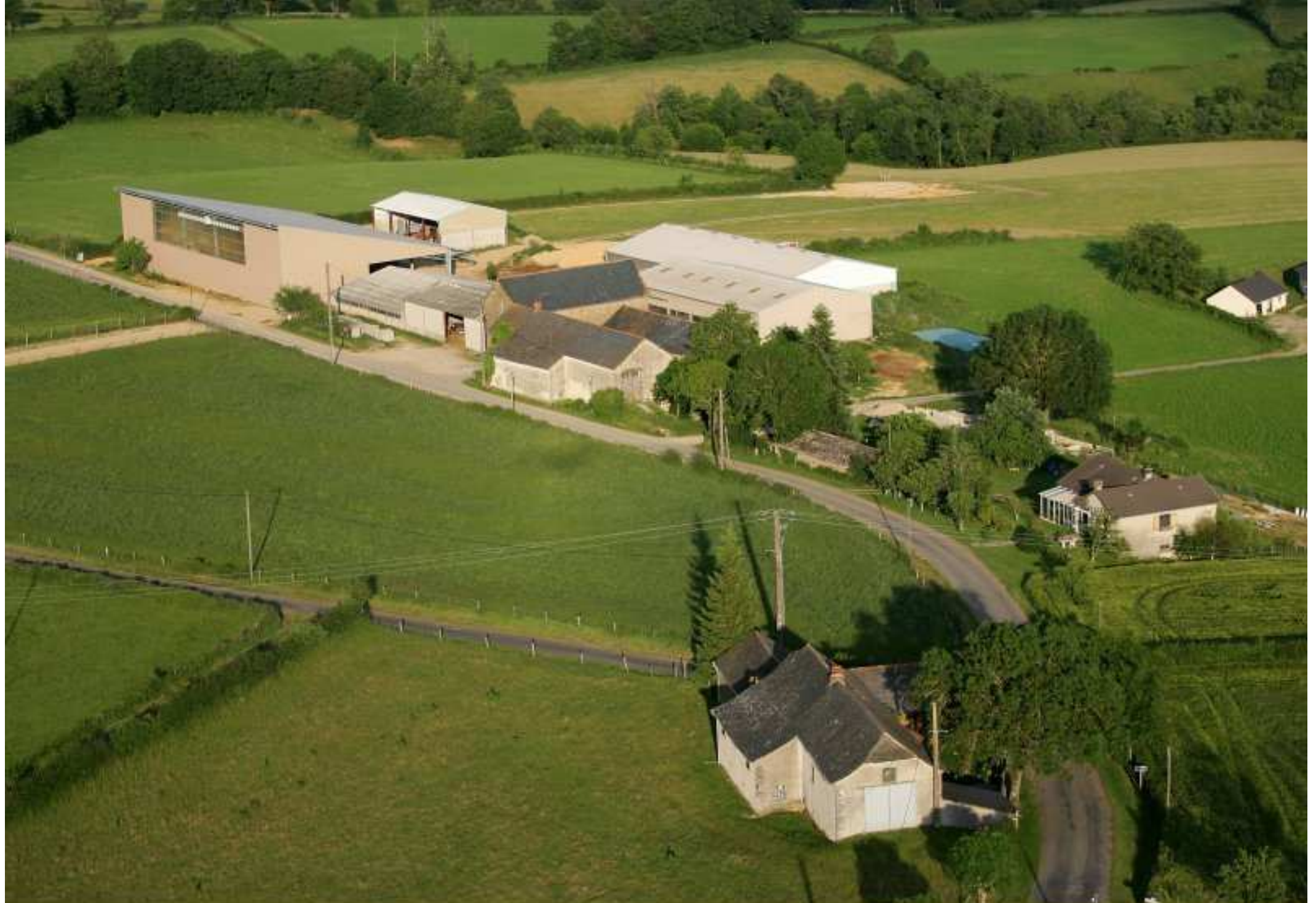
Meljac vu du ciel - au 1er plan la Pierre Blanche (maison Rodriguez de Barros), au 2ème, le Cluzel (ferme Baudy-Tayac) - juin 2010 à droite sur la photo, l'un des 3 hangars à production d'électricité photovoltaïque meljacois construits en 2008-09 également au Clot & à Soulages