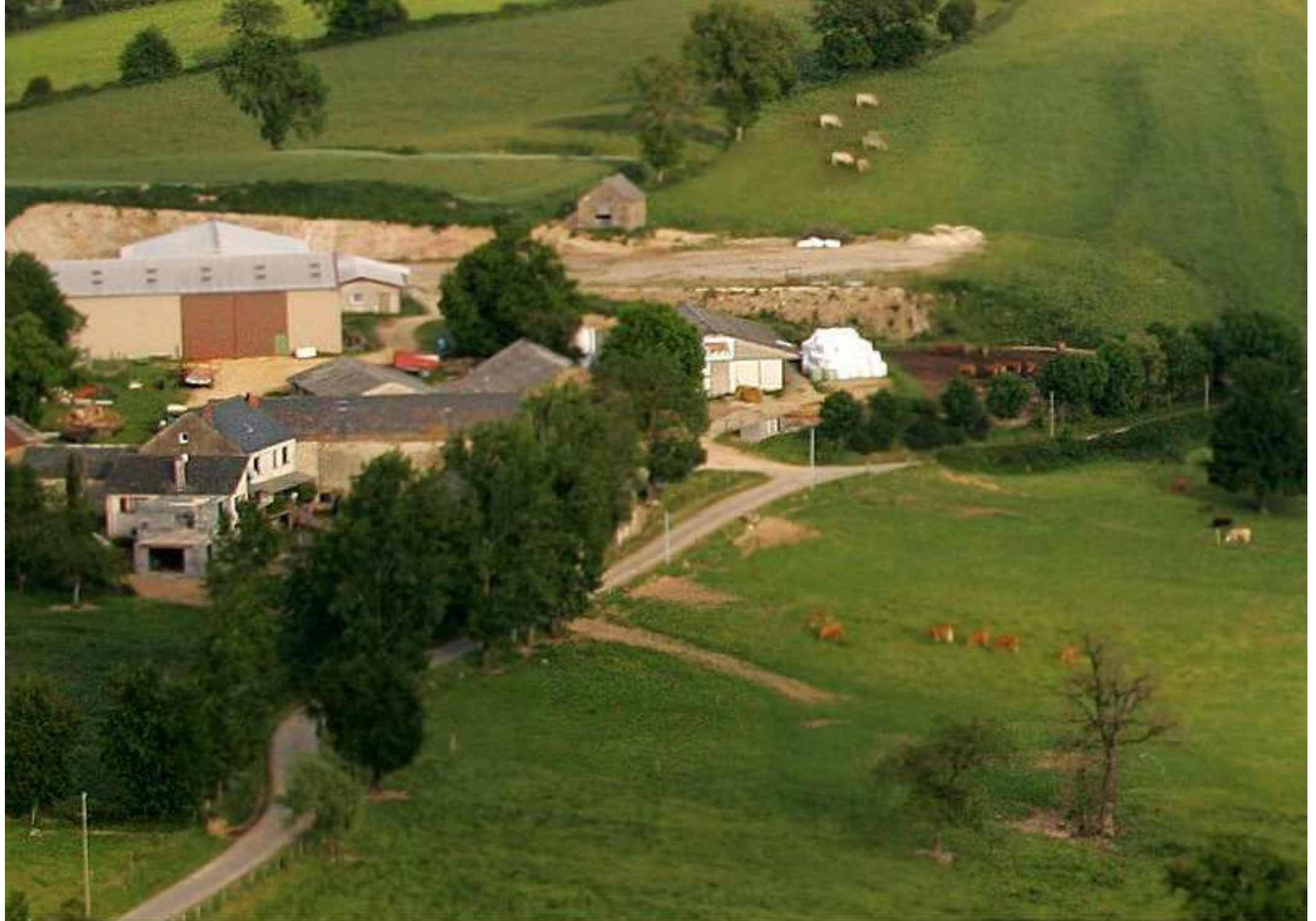
Meljac vu du ciel - les Hameaux - ferme Albinet Henri au Puech Issaly - juin 2010