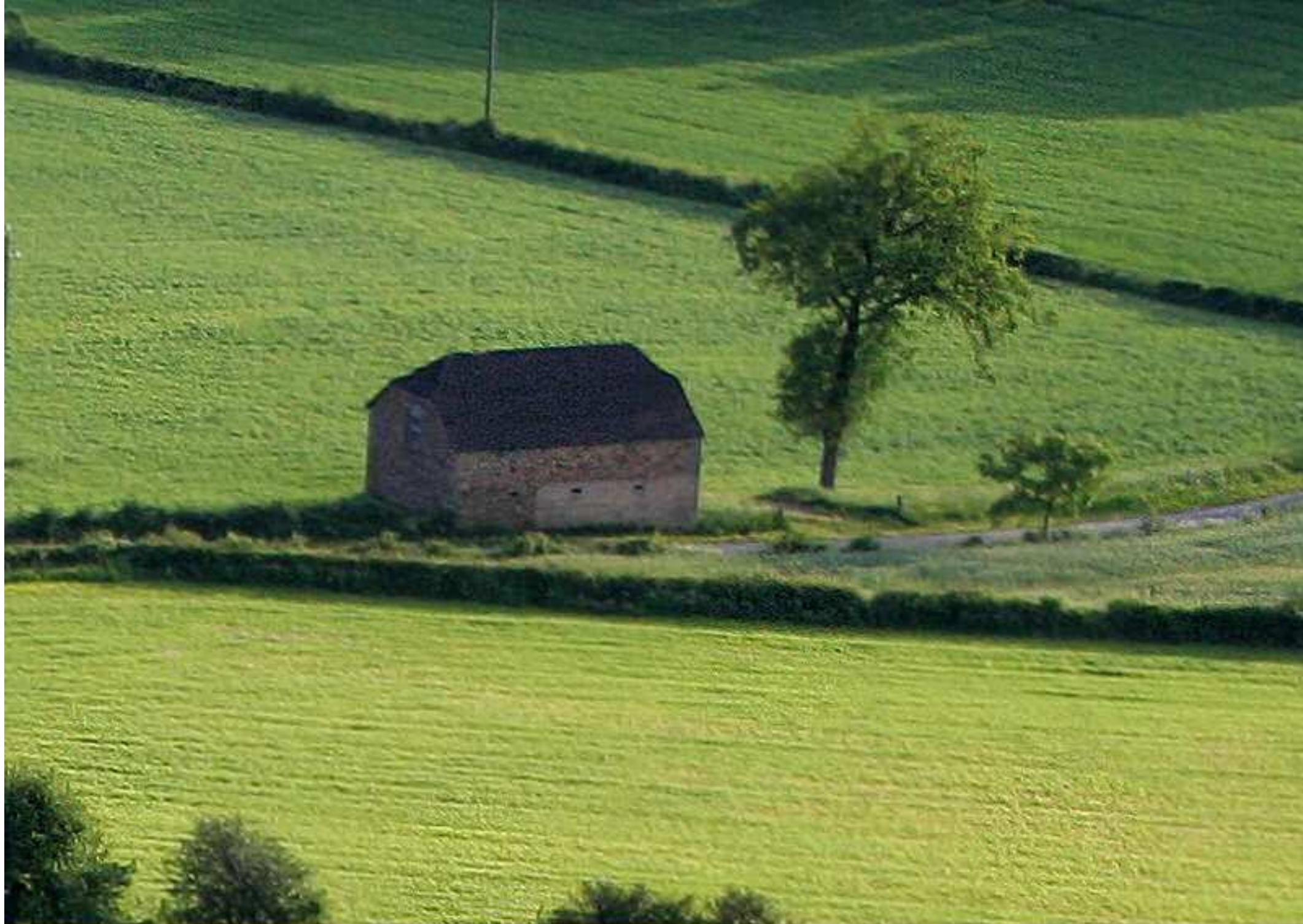
Meljac vu du ciel - les Hameaux - la jaça de Bonal d'Henri Albinet du Puech Issaly au Mas Ricard - juin 2010