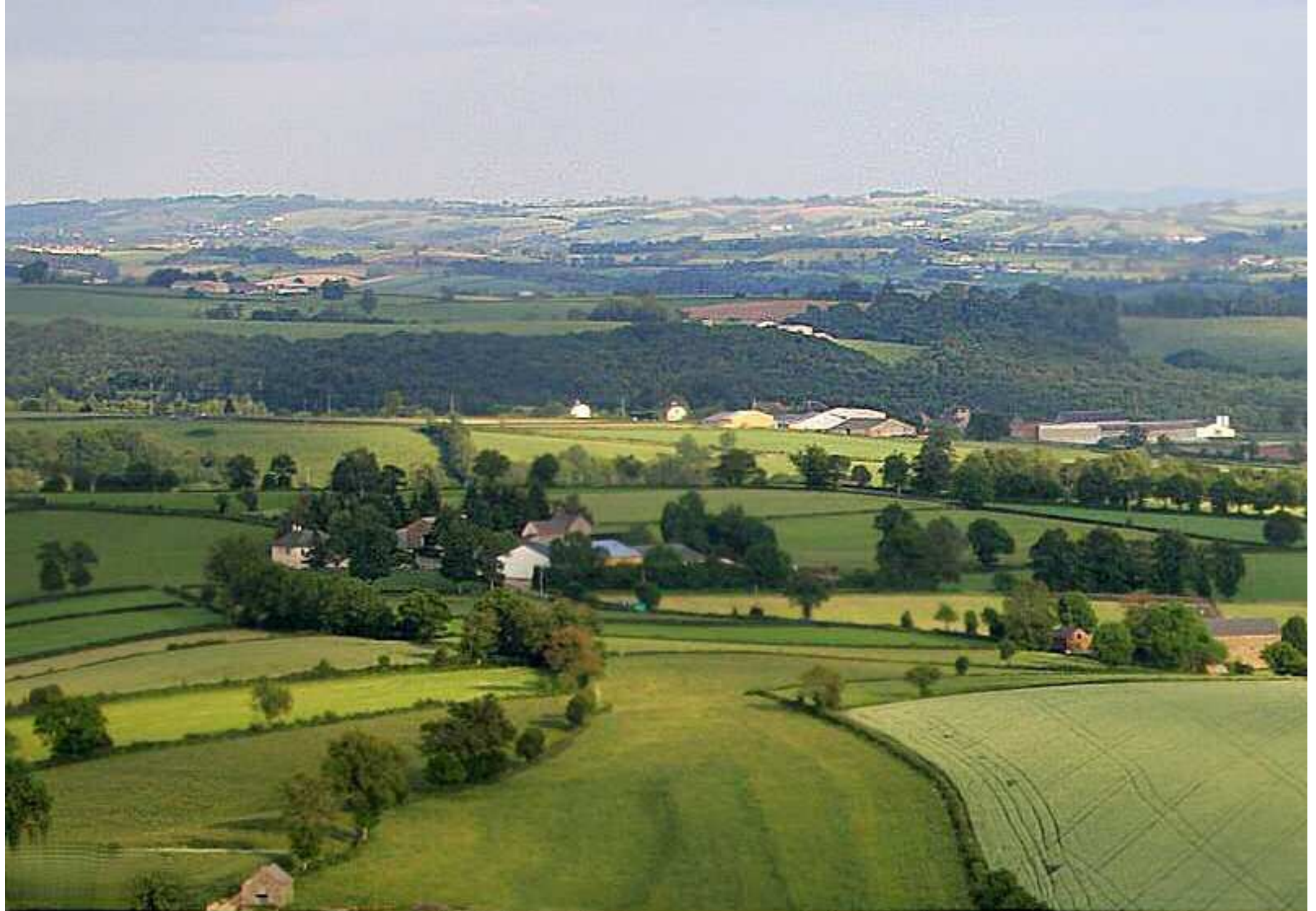
Meljac vu du ciel - les Hameaux - en venant de Centrès vers Rullac - juin 2010 au 1er plan, la Laurentie & le Puech Neuf - à l'arrière, Rullaguet