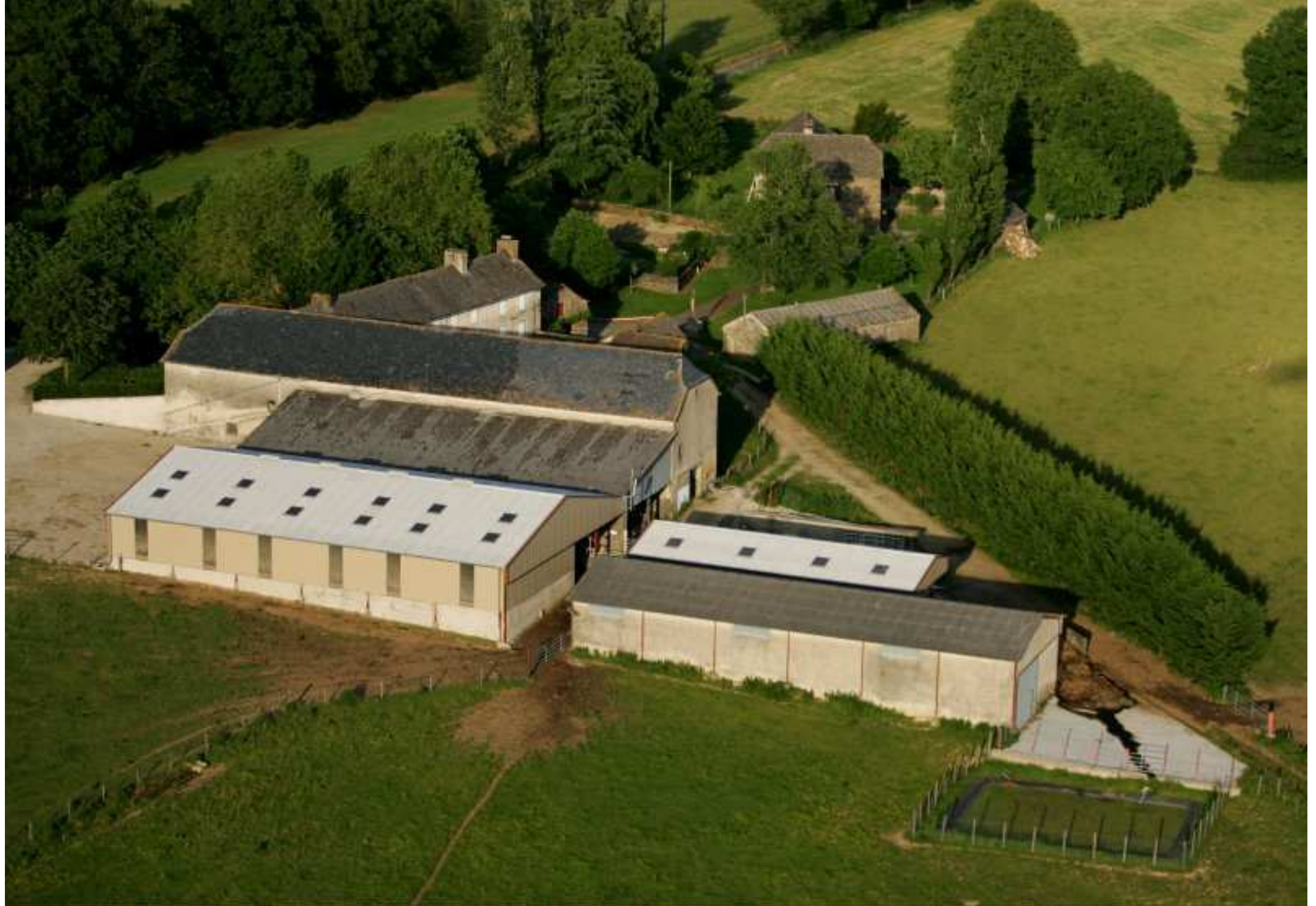
Meljac vu du ciel - les Hameaux - ferme Mazars de la Bessière - juin 2010