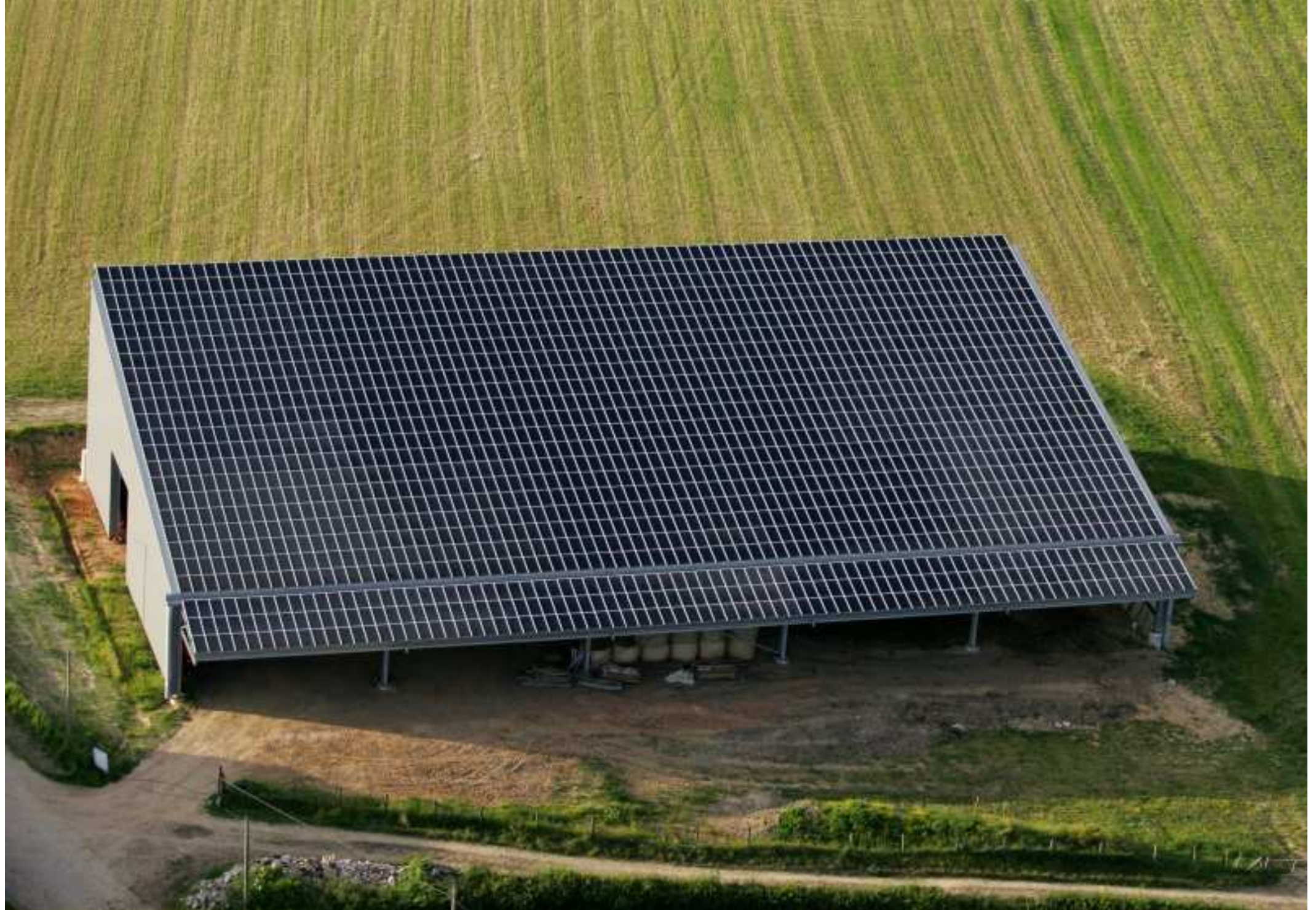
Meljac vu du ciel - les Hameaux - ferme Bosc guy à Soulages - juin 2010 (l'un des 3 hangars à production d'électricité photovoltaïque meljacois construits en 2008-09 également au Clot & au Cluzel)