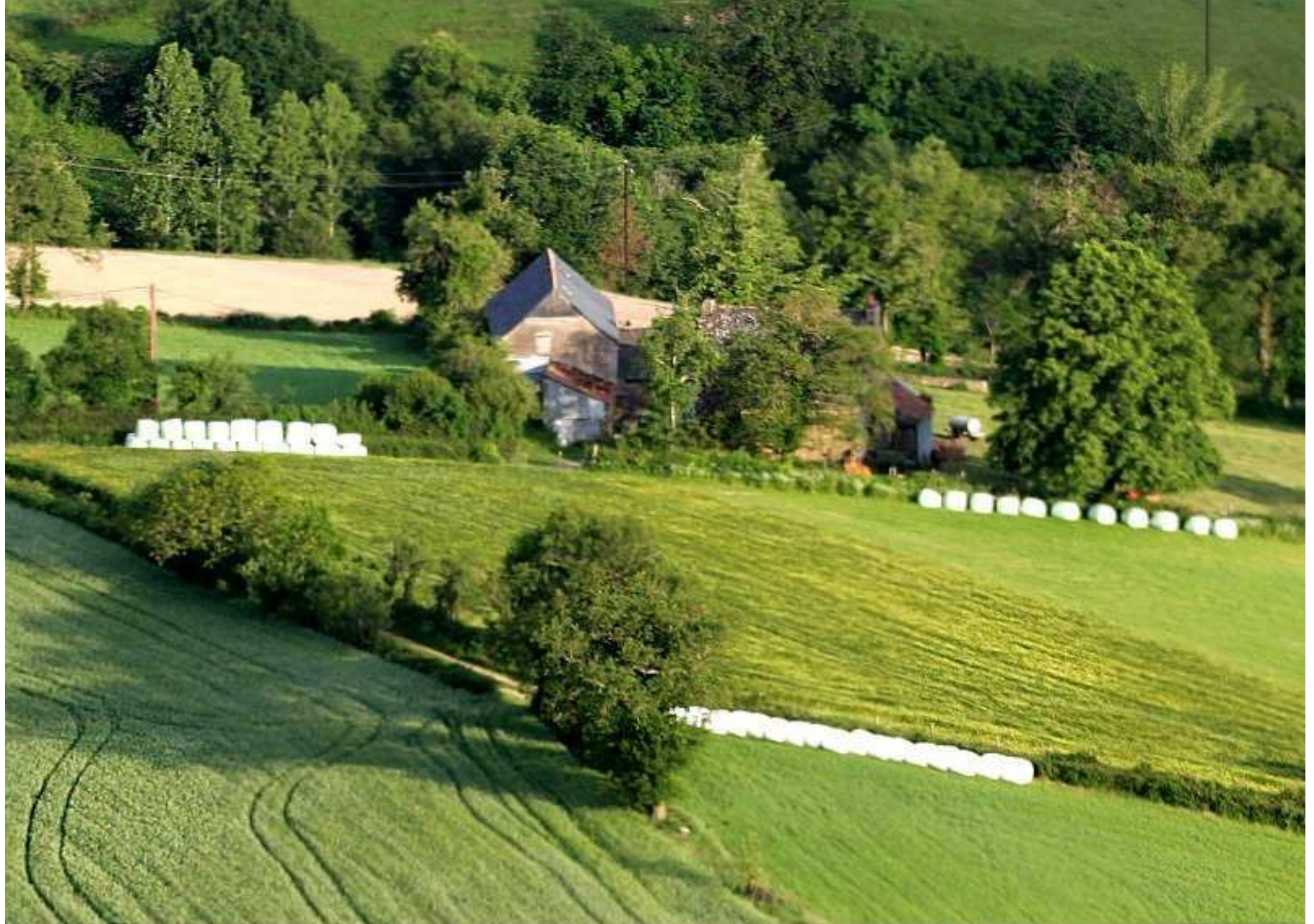
Meljac vu du ciel - ferme Hervé Albinet de la Tine (ancienne propriété Philou Enjalbert) au Puech Issaly - juin 2010