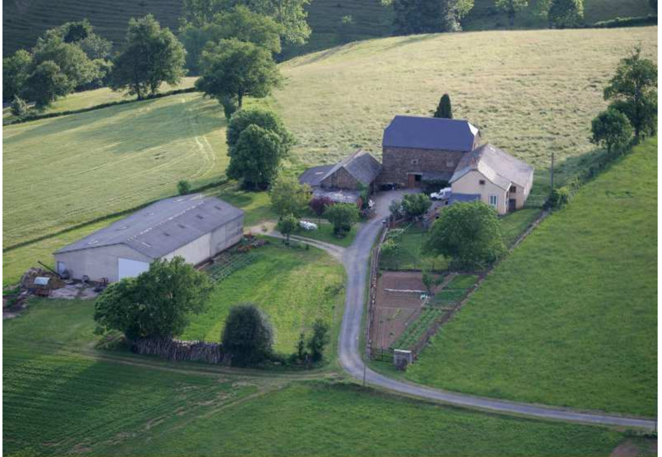
Meljac vu du ciel - les Hameaux - ferme Odile & Georges Bousquet au Pouget - juin 2010