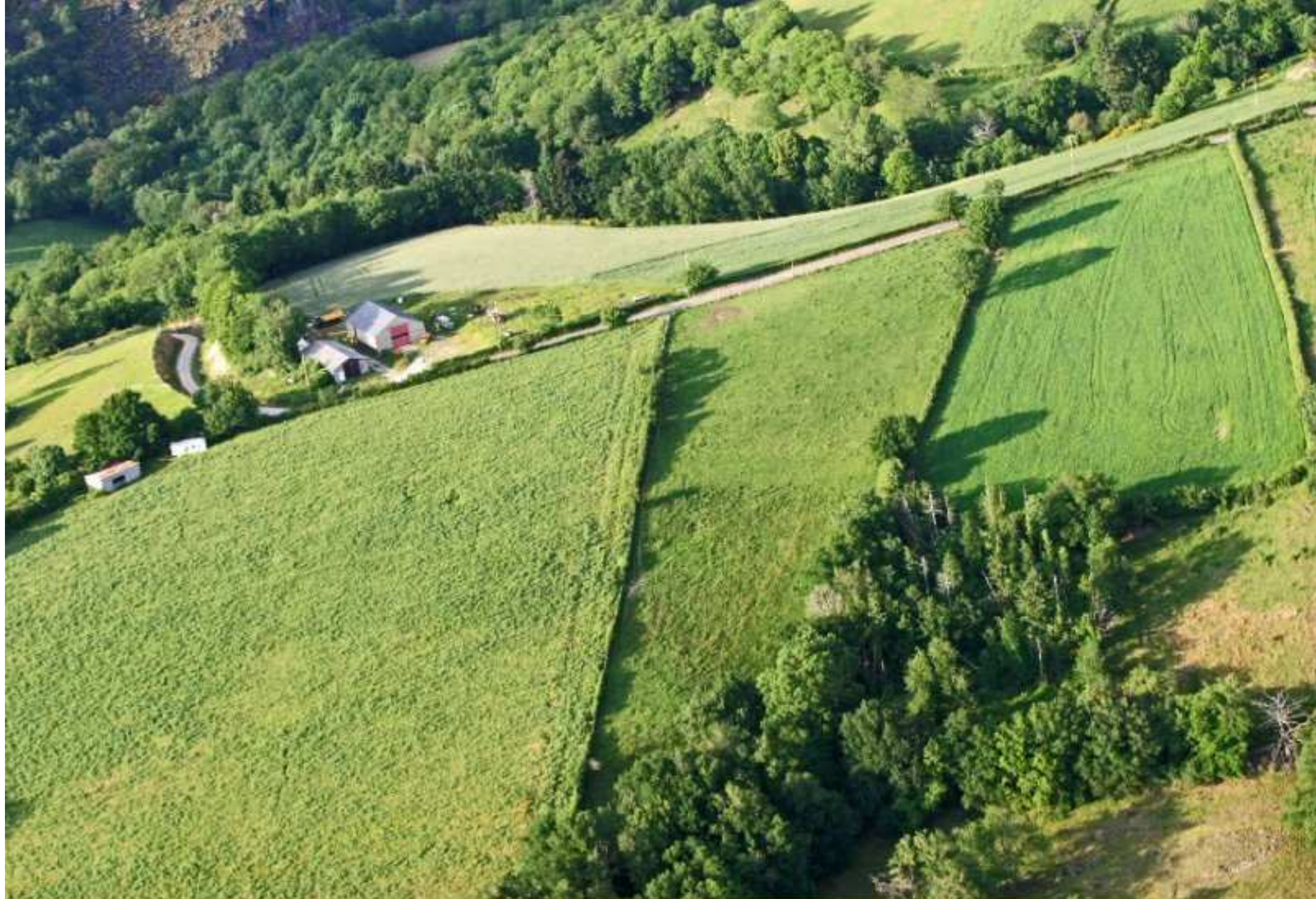
Meljac - vu du ciel - les Hameaux - la descente vers Cabrol le Vergnas - juin 2010 (à gauche les ateliers JPM - musée des machines agricoles anciennes)