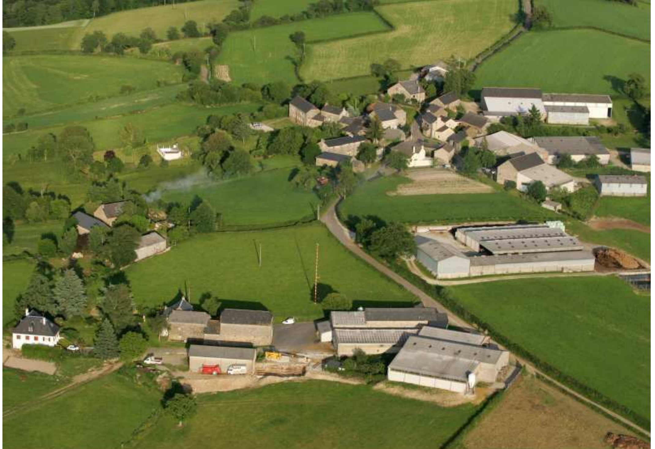
à proximité nord-est de Meljac - vu du ciel - le hameau de Rouffénac (commune de Rullac) - juin 2010