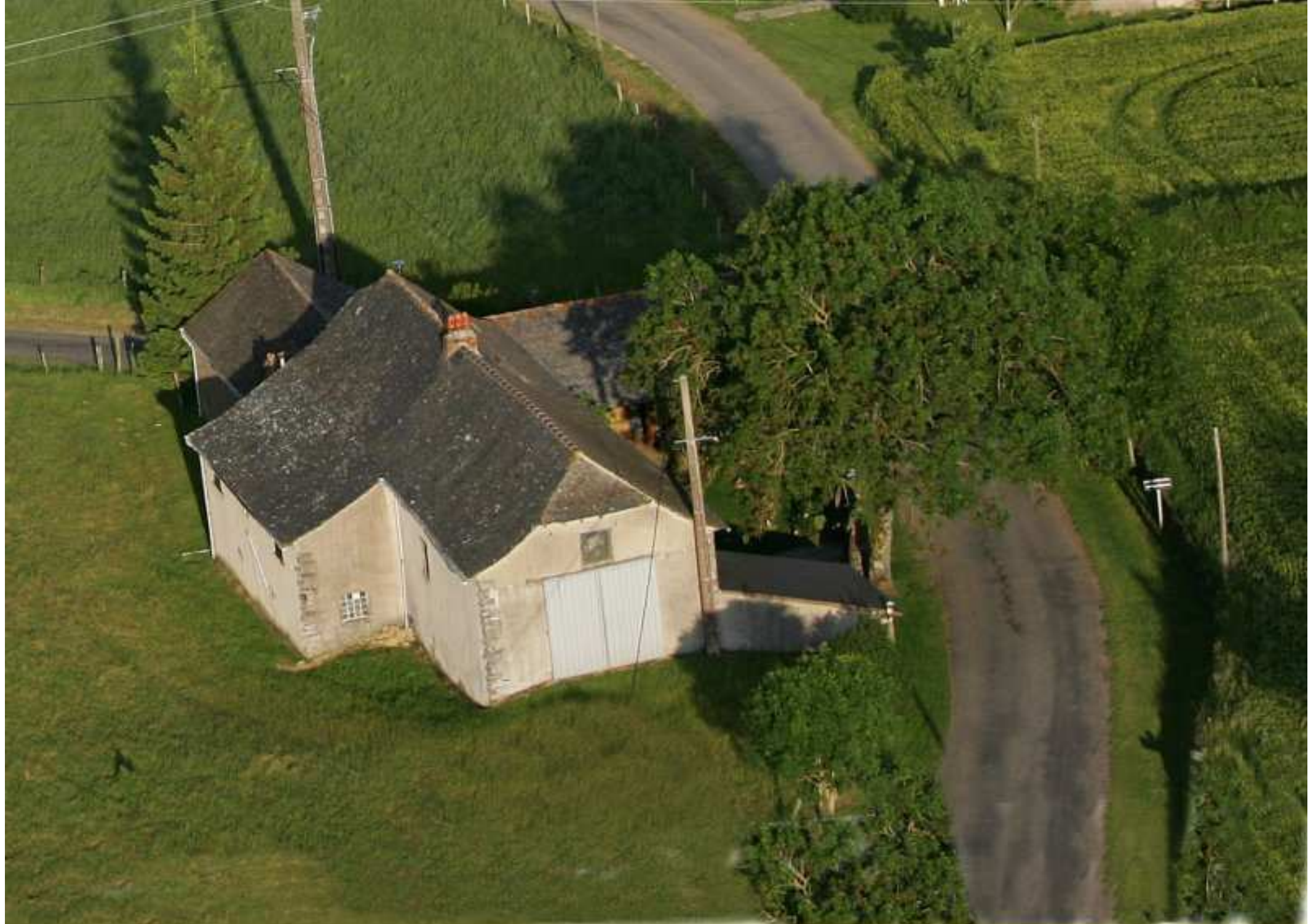
Meljac vu du ciel - les Hameaux - maison Rodriguez de Barros/Molinier de la Pierre Blanche - juin 2010