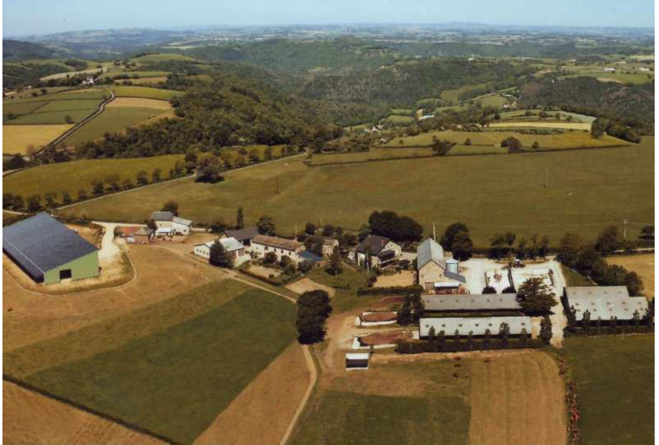
Meljac vu du ciel - les Hameaux - ferme Capoulade-Gaubert du Clot - 2010

à droite sur la photo, l'un des 3 hangars à production photovoltaïque meljacois construits en 2008-09, également au Cluzel et à Soulages