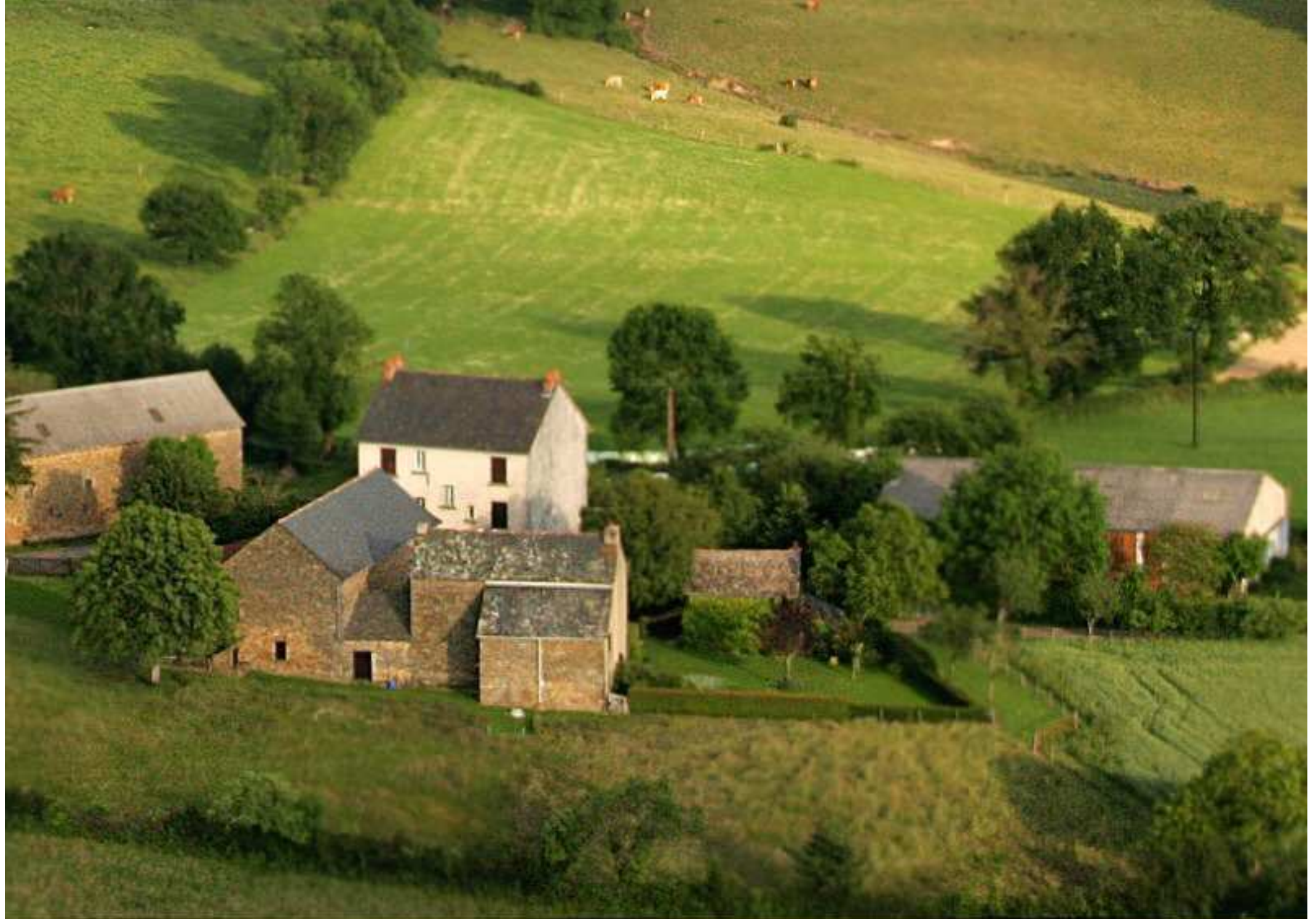
Meljac vu du ciel - Le Puech Issaly: maisons & anciens bâtiments de ferme Bosc-Azam-Loubière & Lacan-Gaben - juin 2010